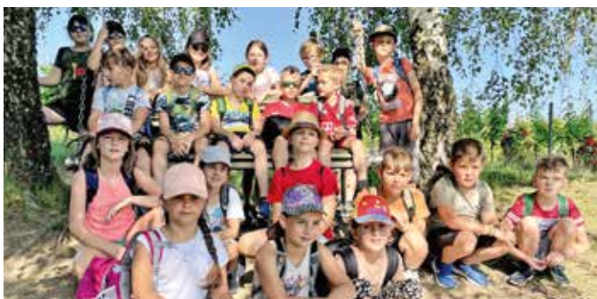
Alle genossen den Wandertag.

In der letzten Schulwoche unternahmen die Schüler und Schülerinnen der zweiten und dritten Klasse gemeinsam einen Wandertag. Mit dem Bus ging´s auf den Thermenberg, danach marschierten alle los in Richtung Lautenberg. Die Kinder hatten dabei Freude am Absolvieren des Motorikweges und konnten schon von weitem die riesengroße Weinflasche mit dem Weinglas bestaunen. Dort angekommen, erklimmen alle die zahlreichen Stufen bis nach oben und genossen bei sonnigem Wetter den herrlichen Rundum-Weitblick. Der Weg führte weiter, vorbei an Schaukelmöglichkeiten, gemütlichen Sitzplätzen und spannenden Sportstationen. Bei einem Bankerl wurde Pause gemacht und die mitgebrachte Jause genossen. Wieder zurück bei der Therme gab es ein kühles Eis, bevor mit dem Bus wieder zur Schule zurückgefahren wurde.