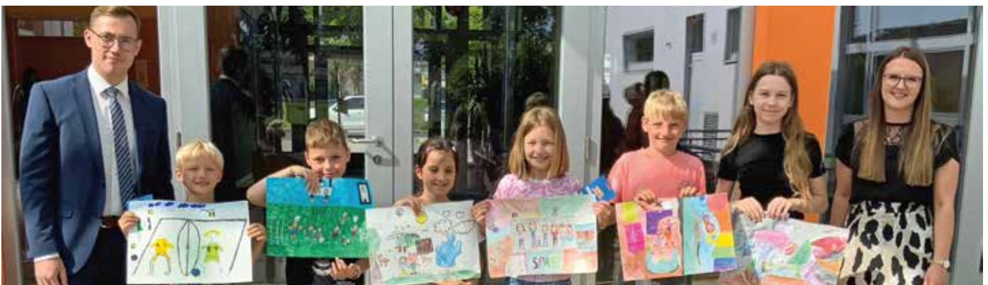
Die ausgezeichneten Zeichner:innen von der VS Bad Loipersdorf

gemalt. Am Tag der Preisverleihung waren alle aufgeregt und erhielten einen Preis. Die besten Zeichner und Zeichnerinnen wurden zusätzlich mit einem Gutschein belohnt.