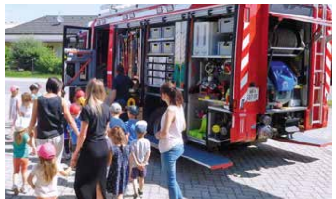
Große Begeisterung bei den KG-Kindern

Am Freitag, dem 16. Juni 2023, stattete der Kindergarten Bad Loipersdorf der Feuerwehr einen Besuch ab. Im Laufe des Vormittages wurden den Kindern die Aufgabengebiete sowie die Ausrüstung der Feuerwehr nähergebracht. Mit voller Begeisterung wurden unter anderem die Fahrzeuge, die Atemschutzgeräte sowie die Schutzbekleidung begutachtet. Auch das Element Wasser kam mit einer Zielspritzübung nicht zu kurz. Abgeschlossen wurde der Vormittag mit der Übergabe, der von den Kindern extra für die Feuerwehr gezeichneten Bildern.