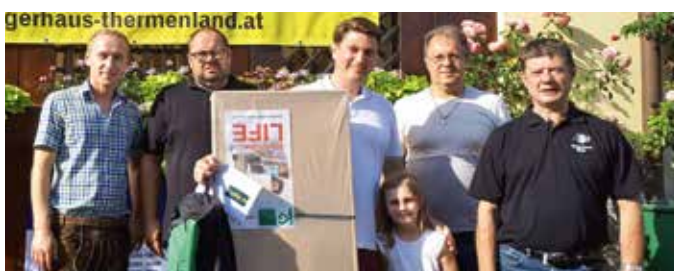
Gewinner des Hauptpreises im Wert von 800 Euro (Lagerhaus Thermenland)