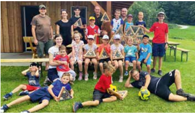
Viele Kinder beteiligten sich an der Ferienpassaktion der JG Stein.