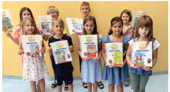
Die Kinder, die am Leseprojekt Antolin teilnahmen.

Für die Leseratten der Volksschule übernahm der Elternverein die Kosten für das Leseprogramm ANTOLIN. Dabei lesen Kinder Bücher und können im Anschluss daran online Fragen zum Inhalt beantworten. Für richtige Antworten gibt es dann Punkte, die die Schüler und Schülerinnen während des ganzen Schuljahres fleißig gesammelt haben. Am Ende des Schuljahres erhielten alle Schüler und Schülerinnen von der Schulleiterin eine Urkunde überreicht. Die Kinder mit den meisten Punkten erhielten als Belohnung und weiteren Leseansporn zu ihrer Urkunde auch noch ein Buch überreicht.