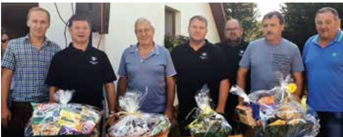
Herzliche Glückwünsche ergehen an die Gewinner des Schätzspiels.

Das Hoffest des Bauernbund Stein fand im heurigen Jahr bei Familie Fuchs in Greischl statt. Beim Schätzspiel musste das Gewicht eines Siloballens (497 Kilogramm) erraten werden. Hauptpreis waren 800 Euro, gesponsert vom Lagerhaus Thermenland .