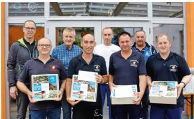
Die Drittplatzierten von der Betriebsfeuerwehr Therme Loipersdorf