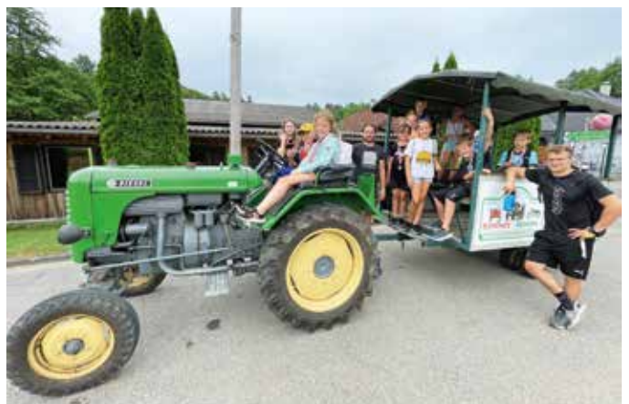
Traktorfahrt im Gaudi Park Zahling

In der letzten Schulwoche unternahmen die Schüler und Schülerinnen der vierten Klasse zahlreiche Tagesausflüge. Einer davon führte sie zum Gaudi Park nach Zahling, wo sie in verschiedenen sportlichen Disziplinen gegeneinander antraten. Bei den Spielen „Bogenschießen“, „Riesenschleuder“, „Heißer Draht“, „Gladiator“ und vielen anderen waren die Kinder mit großer Begeisterung und viel Spaß dabei. Zum Abschluss gab es ein Mittagessen und alle durften eine Runde mit dem Traktor mitfahren. Dank gebührt dem Elternverein , der die verschiedensten Tagesausflüge finanziell unterstützte.