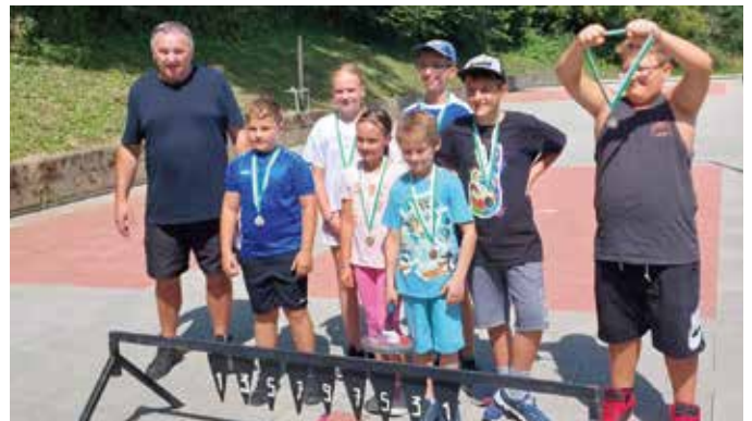
„Wer trifft das Spangler?“ Viel Spaß hatten die Kinder beim ESV Therme Loipersdorf.