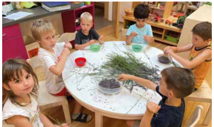
Den Kindern, die den Sommerkindergarten besuchten, wurde viel Spaß geboten.

„Auch besuchten uns ehemalige Kindergartenkinder, die ihre Gutscheine für einen Eintritt im Kindergarten einlösten. Es hat uns sehr gefreut!“