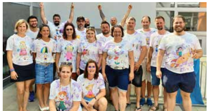
Durch die tatkräftige Mithilfe der Eltern war das Schulfest ein voller Erfolg.