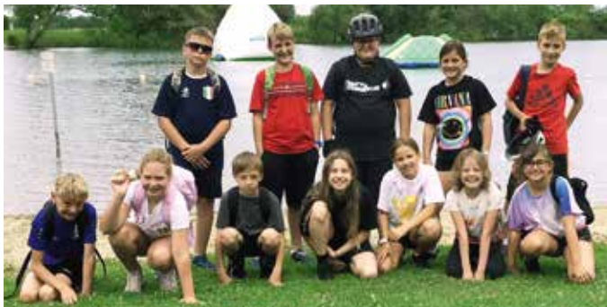
Die Kinder der vierten Schulstufe beim Königsdorfer Badesee

Nachdem alle Kinder der vierten Schulstufe die Radfahrprüfung erfolgreich abgelegt hatten, ging´s am vorletzten Schultag mit den „Drahtesel“ auf zum Königsdorfer Badesee. Am Ziel angekommen, gab´s für alle Toast oder eine Wurstsemmel als kleine Stärkung. Danach stand der Spaß im Vordergrund: Beachvolleyball, Fußball und Tennis machte den Kindern richtig viel Spaß. Vor der Heimreise schleckten alle noch ein Eis. Danke an die Begleitpersonen, die beim Ausflug dabei waren.