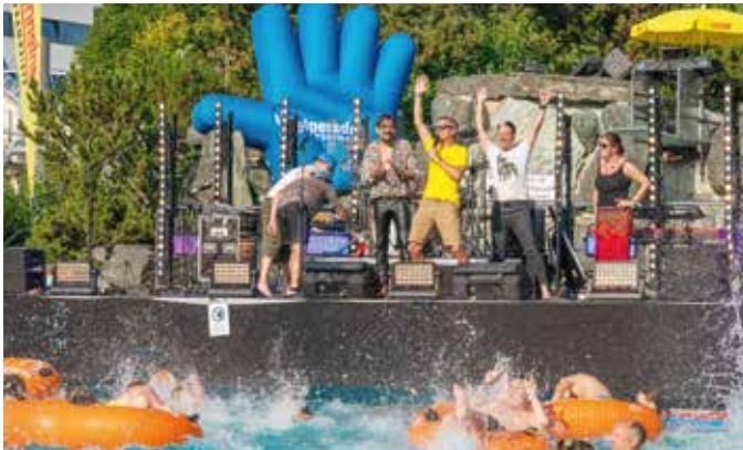
ALLE ACHTUNG begeisterte die Thermengäste mit einem Mega-Konzert.

Am 24. August 2023 verwandelte sich der Außenbereich des Thermenresorts Loipersdorf in ein Festivalgelände der besonderen Art. Beim ersten Thermenfestival Österreichs wurde den Gästen eine spektakuläre Bühnen-Show mit erstklassigen Bands und DJ geboten, während sie mit Cocktails zu ihren Lieblingshits im Wasser tanzen konnten. Unter anderem sorgte die Pop-Band ALLE ACHTUNG mit Songs wie „Marie“ für die heißeste Pool-Party des Jahres.