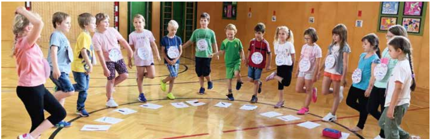
Stolz präsentierten die Erstklassler ihr Können beim ABC-Fest.

Mädchen stolz mit ihren „Medaillen“ in den Turnsaal, wo es sportlich weiterging. Die Kinder mussten passend zu jedem Buchstaben entweder verschiedene Übungen mit bzw. an den Turngeräten durchführen oder Buchstaben mit dem Körper darstellen. Mit großer Begeisterung absolvierten die Schüler:innen ihre „Buchstaben-Checkliste“ und kamen beim abschließenden gemeinsamen Wettlauf so richtig ins Schwitzen. Über das gelungene Buchstabenfest freuten sich alle Buben und Mädchen sehr.