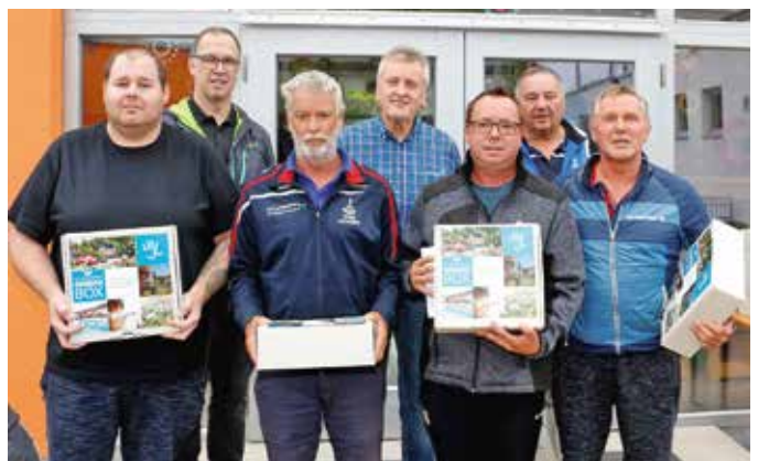
Die Zweitplatzierten vom Golfrestaurant „Puchi´s“