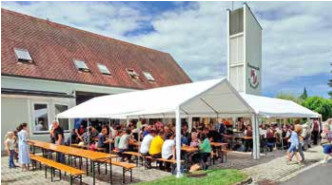
Die Kameraden:innen der FF Bad Loipersdorf bedanken sich bei allen Sponsoren, den zahlreichen Mehlspeisspenden sowie den Gästen für das zahlreiche Kommen.

Am Sonntag, dem 30. Juli 2023, fand der traditionelle Frühschoppen der Feuerwehr statt. Trotz des Regens in der Früh und am späteren Nachmittag konnten zur Mittagszeit unter strahlend blauem Himmel zahlreiche Gäste empfangen werden. Auch für Speis und Trank wurde bestens gesorgt.