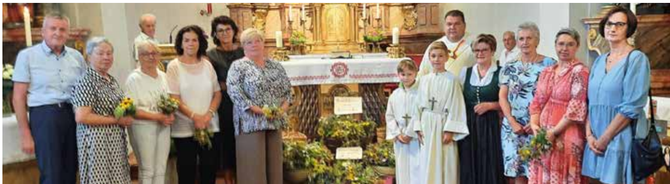
Die Bevölkerung freute sich über die Kräutersträußchen.

Für die freiwilligen Spenden bedankt sich der Pfarrgemeinderat.