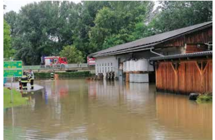
Hier ist das Ausmaß der Überflutungen sichtbar.

sondern auch Felder überschwemmt und deren Ernte fiel den Fluten zum Opfer. 19 Kameraden mit vier Fahrzeugen der Feuerwehren aus der Gemeinde Bad Loipersdorf waren im Rahmen des KHD-Einsatzes in Heimschuh im Einsatz.