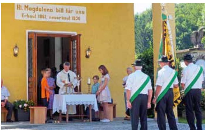
Messe bei der Magdalena-Kapelle in Stein