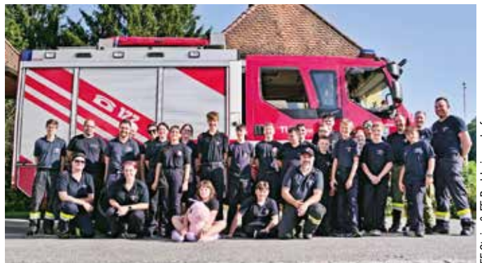
FF Stein & FF Bad Loipersdorf

Am Freitag, dem 25. August 2023, fand eine gemeinsame Jugendübung in Stein statt. Neben einer kleinen Auffrischung der Erste-Hilfe-Maßnahmen wurden auch Löschversuche mit dem Strahlrohr beübt. Aber auch der Spaß kam nicht zu kurz: In kürzester Zeit wurde ein ca. 2.000 Liter großes Auffangbecken mit Leiterteilen zusammengestellt und mit einem „Springbrunnen“ aus Stahlrohren für Abkühlung gesorgt. Ein Dank gilt der FF Stein für die Durchführung der Übung und der anschließenden Verpflegung.