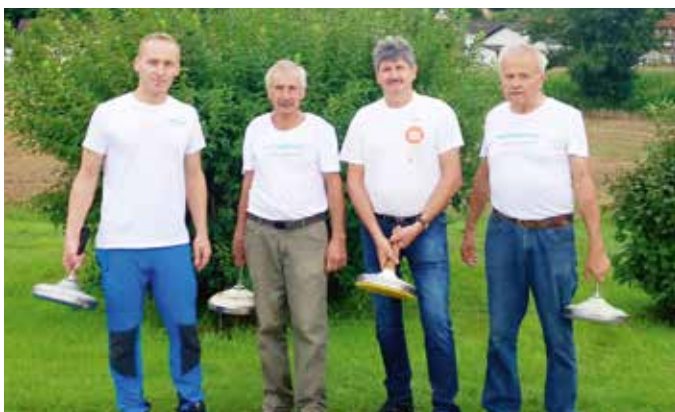
Eine der beiden Mannschaften der ÖVP Bad Loipersdorf