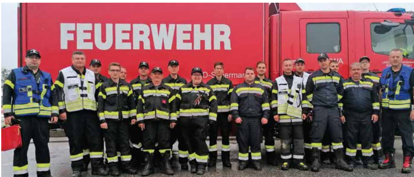
Die FF-Mannschaft aus der Gemeinde Bad Loipersdorf