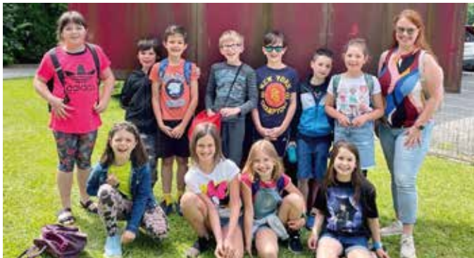
Beeindruckt waren die Kinder vom Besuch beim Roten Kreuz in Fürstenfeld.

Im Rahmen des Sachunterrichts befassten sich die Kinder der dritten Schulstufe ausgiebig mit dem Thema Unfallverhütung und Erste Hilfe. Mit dem Programm „Helfi hilft dir helfen“ setzten sich die Kinder mit dem Ablauf der Rettungskette auseinander und erfuhren, dass es wichtig ist, bei Notfällen Ruhe zu bewahren. Das korrekte Absetzen eines Notrufes wurde im Unterricht ebenso thematisiert wie das Durchführen einfacher Erste-Hilfe-Maßnahmen. Der Besuch der Bezirksstelle des Roten Kreuzes in Fürstenfeld bildete den Abschluss dieser Lernsequenz und war für die Kinder sehr lehrreich und interessant.