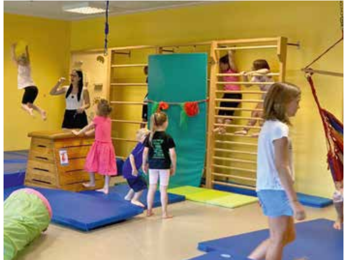
In einem Parcours, der nach den sieben Stufen der Evolutionspädagogik aufgebaut war, konnten die Kinder die einzelnen Entwicklungsstufen der Evolution motorisch durchlaufen.

Bei ganz viel Spaß und Bewegung waren viele Kinder beim Ferienpass dabei, um in die Evolutionspädagogik hineinzuschnuppern. Spielerisch konnten die Kinder anhand verschiedener Stationen Bewegungsabläufe der Evolutionspädagogik und der Kinesiologie erproben. Es war ein lustiger bewegter Nachmittag!