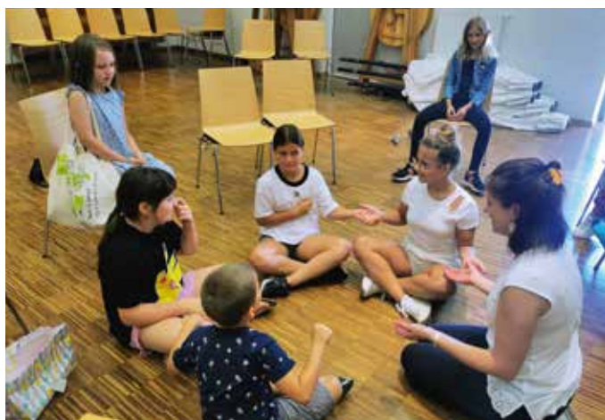
Ganz viel Spaß herrschte beim Simsala Sing.