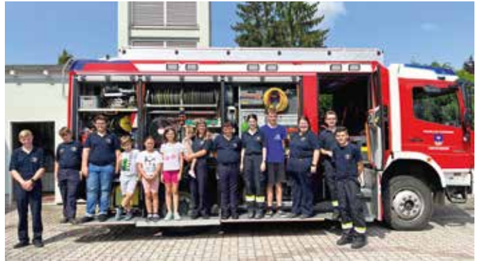
Die Kinder waren von der Ferienpassaktion der FF Bad Loipersdorf begeistert. Zum Abschluss gab es für alle Urkunden und eine Verpflegung.

Am Samstag, dem 19. August 2023, fand die Ferienpassaktion der Gemeinde bei der FF Bad Loipersdorf statt. Angefangen bei der Einsatzuniform, über die Beladung der Feuerwehrautos bis zur Anwendung vom Strahlrohr war für die Kids alles dabei.