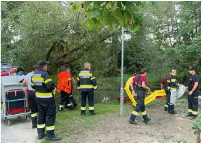
FF Fürstenfeld & Bad Loipersdorf

Am Montag, dem 21. August 2023, fand eine Monatsübung zum Thema Ölsperren gemeinsam mit den Feuerwehren Fürstenfeld, Übersbach und Großsteinbach statt. Beübt wurde der Einsatz der vom BFV Fürstenfeld neu angeschafften Ölsperren entlang der Feistritz in Fürstenfeld. Für weitere Informationen siehe: https://www.bvff.steiermark.at