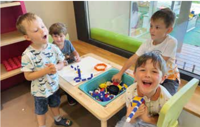
Die Schnupperkinder waren begeistert von Spiel und Spaß im Kindergarten Bad Loipersdorf.

Im Sommerkindergarten starteten auch die Tage der Schnupperkinder, die im Herbst in ihre Gruppen kamen. Voller Neugierde und mit etwas Aufregung besuchten sie die jeweiligen Gruppen und konnten ein wenig vom Tagesgeschehen und den Abläufen im Kindergarten wahrnehmen. „Wir freuen uns sehr, euch nun in unserem Kindergarten willkommen zu heißen und wünschen euch sowie allen anderen Kindern einen tollen, aufregenden, erlebnisreichen Start ins neue Kindergartenjahr.“