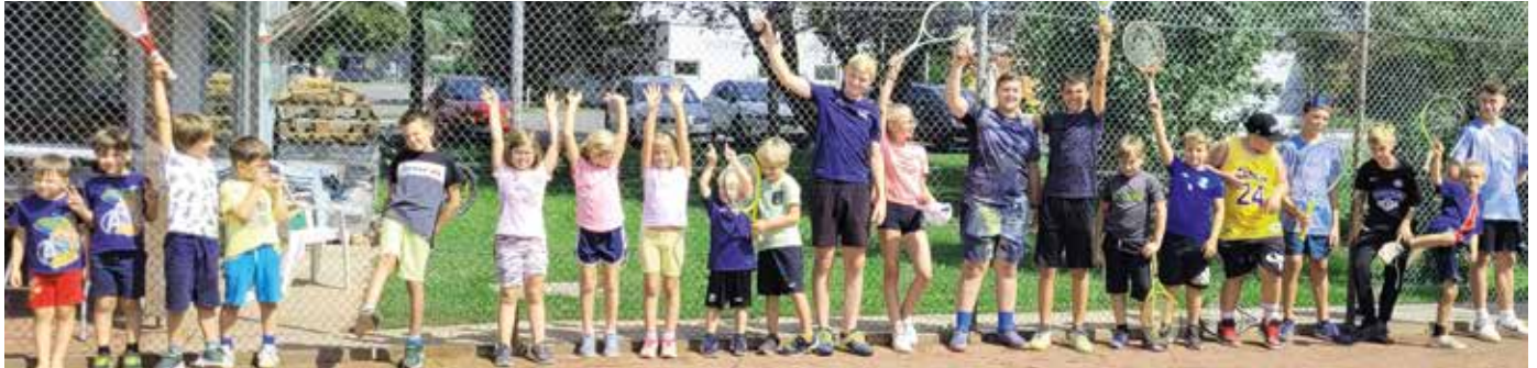
Viel Spaß hatten Groß und Klein beim Ferienpass.

Am 1. Juli 2023 fand das bereits traditionelle Softball-Tennisturnier auf dem Gelände des ATV Loipersdorf statt. Dabei konnten wieder zahlreiche Paare begrüßt werden, die im Rasentennis um die Plätze kämpften. Diesmal konnte sogar eine Polterpartie für das Turnier gewonnen werden, was für einen zusätzlichen Spaßfaktor gesorgt hat. Beinahe hätte ein Regenguss das Finale verhindert, aber glücklicherweise konnten die Sieger ermittelt und zahlreiche Preise übergeben werden.