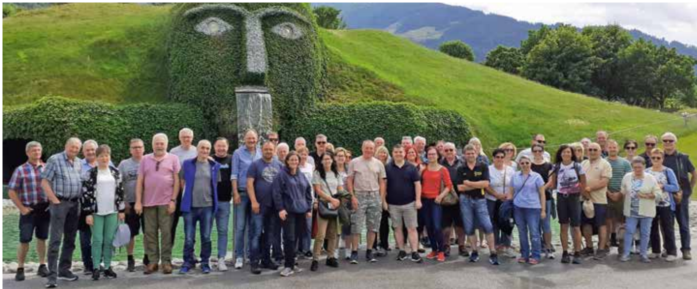
Viele Teilnehmer:innen beim Ausflug des SFV Stein

der Bundesmusikkapelle Neustift“ im Stubaital mit Herz-Jesu-Feuer zur Sonnwend, Königssee mit der Wallfahrtskirche St. Bartholomä. Die musikalische Begleitung: Joschy Huber und seine Hügelländer – gut wie eh und je!