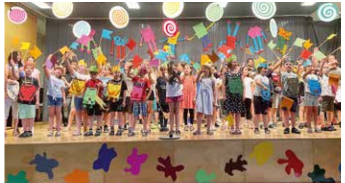
Die Kinder hatten viel Spaß beim Schulfest.