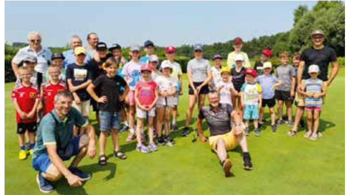
Golfen ist bei der Thermengolfanlage Loipersdorf cool.