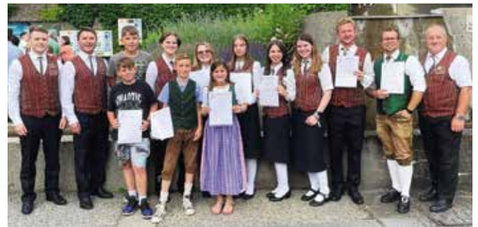
Die Teilnehmer mit ihren Urkunden nach der Leistungsabzeichenprüfung mit MV-Funktionären