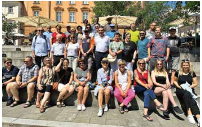
Endlich konnte wieder ein Ausflug des Gemischten Chor durchgeführt werden.

lichem Wetter und guter Laune wurde eine Bootsfahrt auf der Ljublanica unternommen. Danach war noch Zeit für einen Aperitif in den zahlreichen Lokalen am Flussufer. Das Mittagessen in einem tollen, landestypischen Gasthof war sozusagen der Abschluss der Reise. Auf der Heimfahrt wurde noch fleißig Karten gespielt und das eine oder andere Verdauungsschnapsel getrunken. Die Chormitglieder, inklusive den „treuen“ Helfern, freuen sich schon auf den nächsten Ausflug.