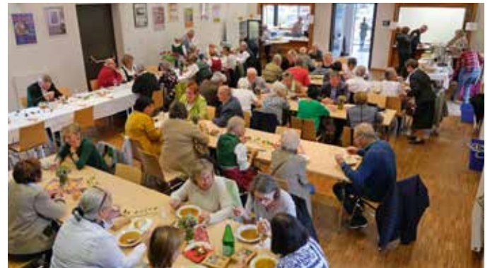
Viele Besucher beim Kürbisbrunch im Pfarrheim