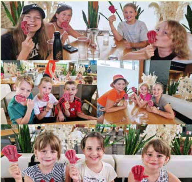
Ferienpass 2023: Schatzsuche quer durch das Thermenresort