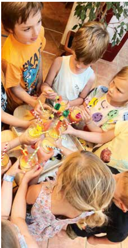
Der Cocktail wurden von den Kindern sehr genossen.