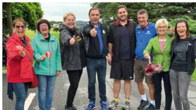
Der Gemischte Chor ist stolz auf den erreichten achten Platz.

Auch dieses Jahr fehlte die Abordnung vom Gemischten Chor Bad Loipersdorf nicht beim Stockturnier. Bei gerade noch trockenem Wetter schlug sich die 4er Partie sehr gut und erreichte den achten Platz von 16 Gruppen. Natürlich haben die Cheerleader-Damen wieder alles dazu beigetragen, die Chorgruppe lautstark zu unterstützen. Dies funktionierte sehr gut, und es wurde schon von den anderen Teilnehmern etwas neidisch auf den Fanclub geschaut. Die Stocksützen und die Cheerleader werden jedenfalls nächstes Jahr wieder antreten.