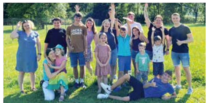
Die lustige Musikolympiade machte den Kindern sichtlich Spaß.

Am 13. August 2023 hatten Kinder aus der Gemeinde die Möglichkeit, die Welt der Musikinstrumente spielerisch zu entdecken. Im Rahmen einer Musikolympiade konnten sie verschiedene Stationen ausprobieren, darunter Trompete und Flügelhorn spielen sowie Dosenwerfen. Zum Abschluss gab es ein spannendes Seilziehen für alle Teilnehmer. Der Abend klang schließlich gemütlich bei einem Lagerfeuer und Würstchenbraten aus. Herzlichen Dank an alle, die dabei waren!