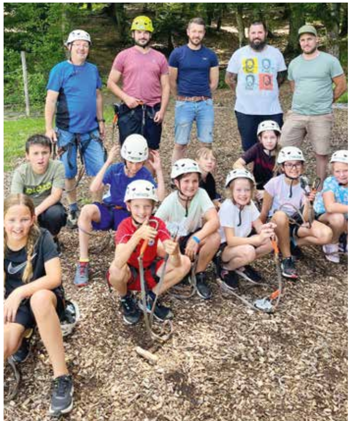
Die mutigen Kinder im Hochseilgarten Stegersbach mit den Begleitpersonen.

Anfangs waren einige Kinder noch ein bisschen ängstlich, aber mit zunehmender Dauer wurden sie immer sicherer und hatten vor allem beim „Flying Fox“ richtig Spaß. Dank gebührt den zahlreichen Eltern , die als Begleitpersonen und zur Unterstützung mit dabei waren.