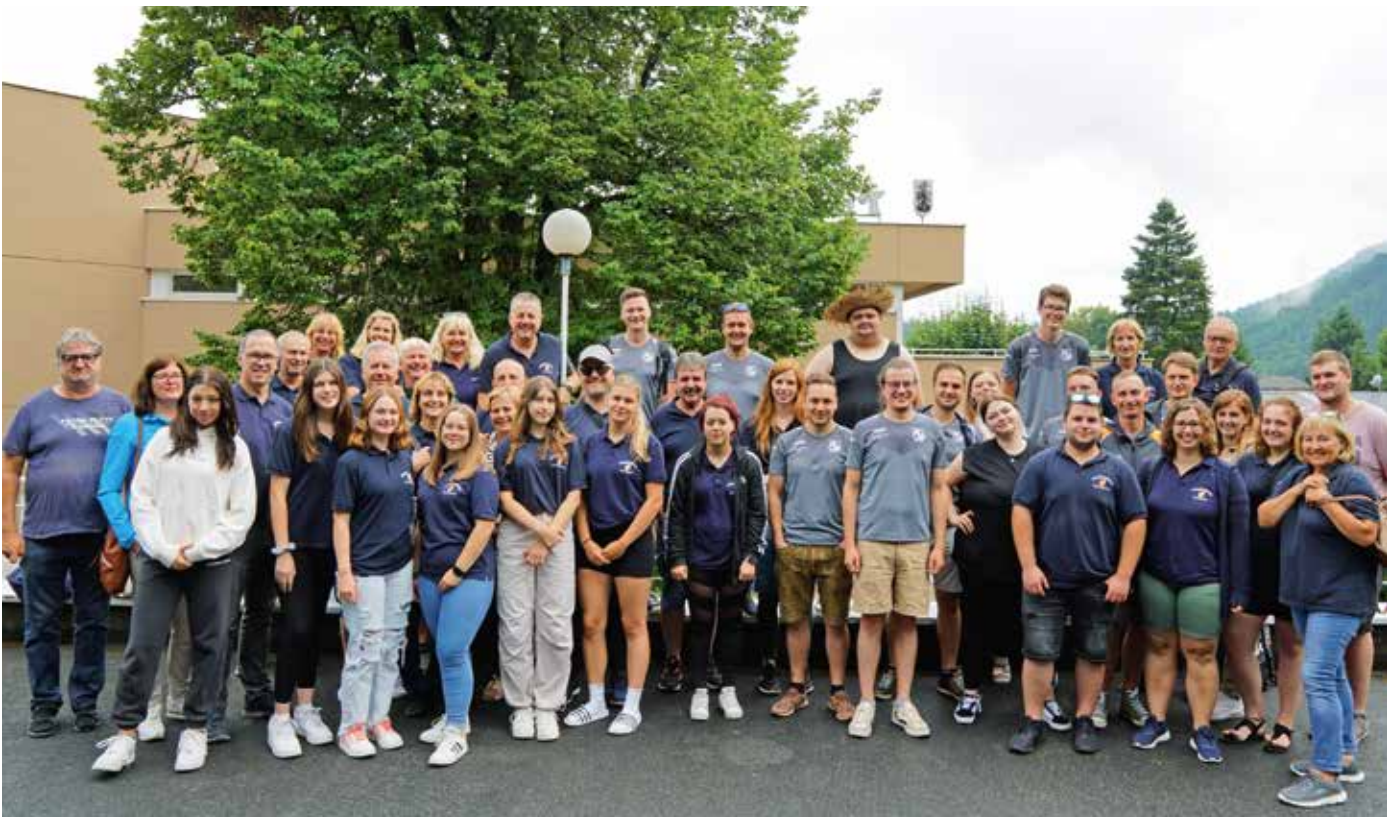
Eine große Anzahl an Kameraden:innen nahmen am Ausflug teil.

Nach dieser doch etwas außergewöhnlichen, aber absolut sehenswerten Besichtigung ging es zum Klopeiner See, wo im Strandhotel Marolt genächtigt wurde. Der Sonntag wurde zum Schwimmen und Sonnenbaden am herrlichen hauseigenen Strand des Hotels genutzt. Danach ging es mit dem Bus zum Buschenschank Kohl nach Oberlamm, wo noch einige schöne Stunden bei einer guten Jause und einem Achtel Wein verbracht wurden. Im Anschluss brachte der Bus alle wieder zurück nach Dietersdorf, und zwei kameradschaftliche lustige Tage lagen hinter den Teilnehmern.