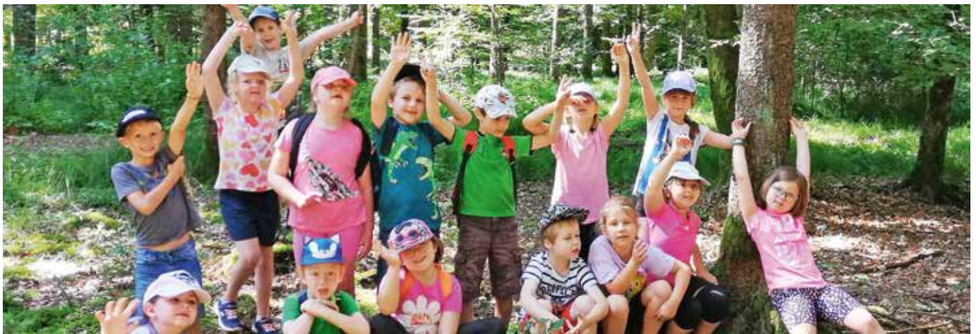
Die Schüler:innen der ersten Klasse beim Wandertag im Stadtwald

Ölkreiden rubbelten sie die unterschiedlichen Baumrinden durch und staunten über die verschiedenen Strukturen. Besonders engagiert waren die Kinder beim Gestalten eines „Klassenzimmers“. Eifrig trugen sie Äste, Zweige und einige Ziegelsteine zusammen und bauten mit Begeisterung tolle „Klassenräume“. Natürlich durfte die Wald-Jause nicht fehlen und dabei verging die Zeit viel zu schnell. Zum Schluss waren sich alle Schüler:innen einig: „Das war ein besonderer Wandertag im „Klassenzimmer Wald“.