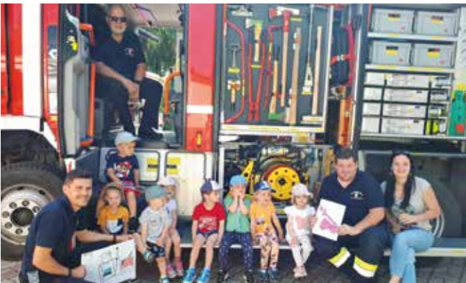
Interessanter Besuch bei der Feuerwehr Bad Loipersdorf

Die Kinder bekamen einen Einblick ins Feuerwehrhaus und durften auch Schutzhelme und Atemschutzmasken anprobieren. Zu guter Letzt durfte man noch einen Blick in das Feuerwehrauto werfen und auch eine Runde damit durch den Ort fahren. Das Wasserspritzen zum Schluss war das Highlight und hat den Kindern besonders gut gefallen. „Danke, dass wir euch besuchen durften.“