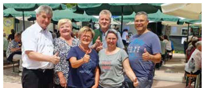
Fleißige Helfer trugen zum Gelingen des Pfarrfestes bei.