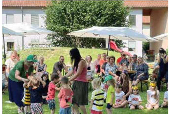
Viele Eltern, Großeltern, Verwandte und Freunde nahmen am Sommerfest teil.

„Nun sind sie bereits ein Haus weitergezogen und wir wünschen ihnen alles Gute für das kommende Schuljahr und sagen danke, dass wir euch ein Stück eures Lebens begleiten durften.“