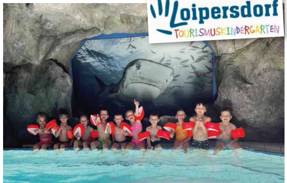
Der Tourismuskindergarten freut sich schon auf das neue Kindergartenjahr!