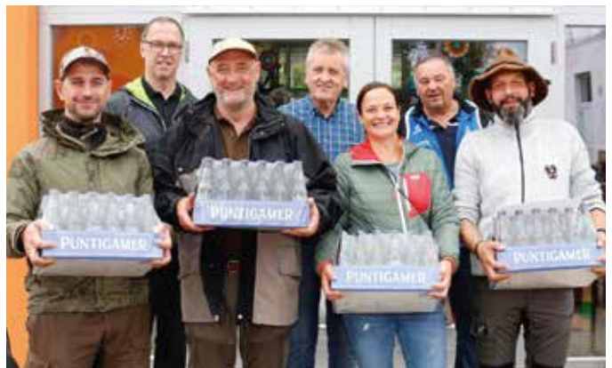
Die Viertplatzierten von der Jagdgemeinschaft Loipersdorf+Dietersdorf