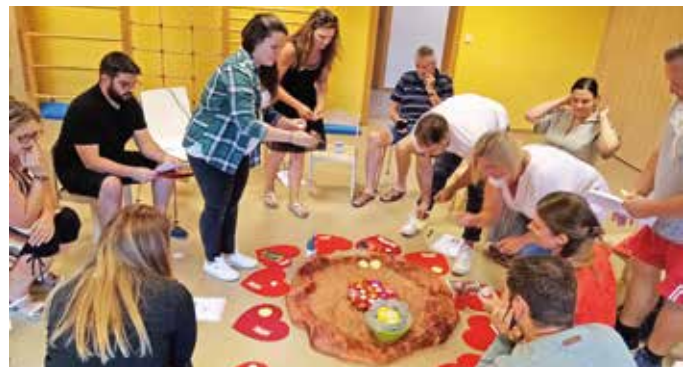
Beim Elternabend der Kinderkrippe wurden Informationen an die Eltern übermittelt und ein erstes Kennenlernen zelebriert.

Zu einem ersten Kennenlernen und gemeinsamen schönen Einstieg in das Kinderkrippenjahr 2023/2024 lud das Team der Kinderkrippe ein. Auch Bürgermeister Herbert Spirk war dabei. Zu Beginn hörten alle eine Geschichte über Glück und konnten auch einen schönen Glücksmoment schriftlich verfassen. „Was bedeutet Glück eigentlich für mich?“ Die Eltern durften sich und ihre Kinder anhand von Fotos vorstellen und ein Kerzlerl mit schönen Wünschen für ihre Kinder für das Jahr anzünden.