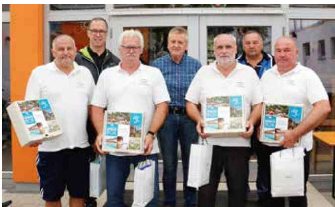
Die Siegermannschaft vom Gasthaus Jandl

Aufgrund der Wetterlage musste das diesjährige Gemeinde-Straßenturnier vom ursprünglichen Samstagstermin auf Sonntag, 6. August 2023, verschoben werden. Durch diese Terminverschiebung war es leider nicht allen angemeldeten Vereinen und Firmen möglich, am Turnier teilzunehmen. Trotzdem trafen sich 16 Mannschaften zum sportlichen Wettbewerb und zeigten ihr Können auf der Asphaltstraße von der Volksschule bis annähernd zum Wasserwerk. Vom Hobbyteilnehmer bis zum Profi war alles vertreten, für alle stand der Spaß im Vordergrund, aber auch der nötige Ehrgeiz war vorhanden.