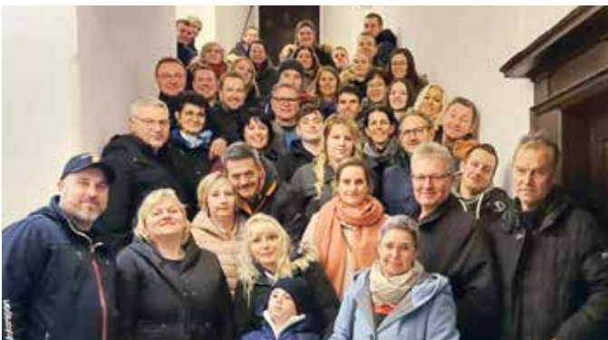
Mitglieder vom SFV und der FF Stein auf der Burg Forchtenstein

Begonnen wurde mit vorzüglichem Bauernschmaus bei der Mostschenke Kremser in Forchtenstein. Nach der gemeinsamen Burgführung stand noch reichlich Zeit zum Gustieren durch die Handwerkskunst in den alten Gewölben sowie für den einen oder anderen Glühwein im Innenhof der Burg zur Verfügung. Eine wiederum sehr gelungene Kooperation in Stein!