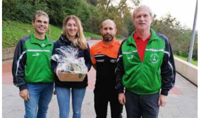
Die Siegermannschaft des ESV Leitersdorf

auch bei allen Mannschaften für ihr verlässliches Erscheinen und faires sportliche Verhalten bedankten.