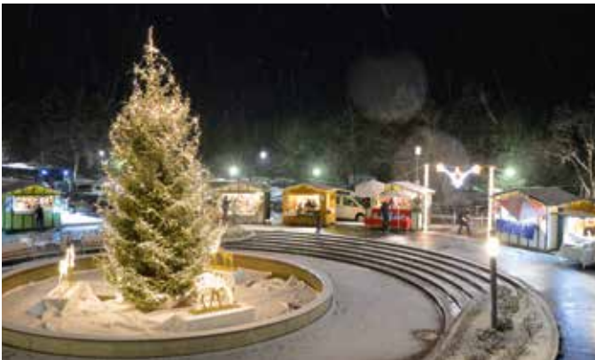
Weihnachtliche Stimmung vor dem Thermenresort

Schau vorbei: Beim traditionellen Adventmarkt am Vorplatz des Thermenresorts Loipersdorf. Hell erleuchtet zeigt sich wie alljährlich der große Weihnachtsbaum, festlich geschmückt die Adventhütten. Handwerker zeigen ihre liebevoll gefertigten Unikate, die vor Ort erworben werden können. Am Punsch- und Glühweinstand gibt es neben wärmenden Getränken auch selbst gebackene Kekse, die den Besuch des Adventmarkts herrlich versüßen. Die Erlöse der Thermen-Adventhütte kommen hilfsbedürftigen Familien in der Region zugute. Der Adventmarkt des Thermenresorts Loipersdorf hat jeden Freitag und Samstag vom 25. November bis 17. Dezember 2022 von 17 bis 21 Uhr geöffnet.