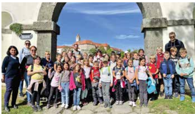
Besuch auf der Riegersburg als Gewinn bei der Aktion „50 Jahre Grünes Herz Steiermark“

Die Schüler und Schülerinnen sowie das Team der VS Bad Loipersdorf bedanken sich sehr herzlich für diesen großartigen Preis!