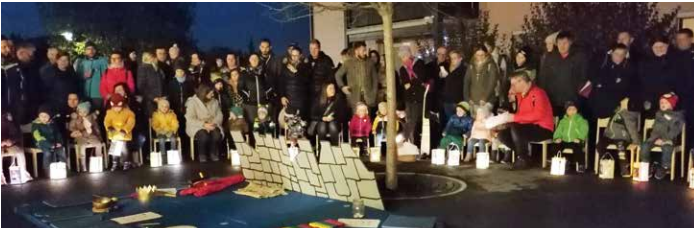
Festliche Stimmung herrschte beim Laternenfest.

Nach der Darbietung wurden die Familien eingeladen noch ein wenig auf der Gartenterrasse zu verweilen, wo mit St. Martinsglühwein, Laternenpunch und St. Martins-Lunchpaketen harmonische Gespräche stattfinden konnten.