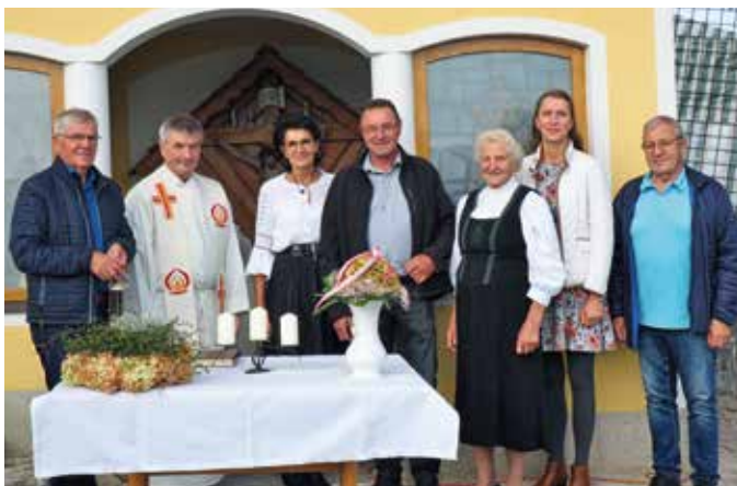
Einweihung der Konrath-Kapelle in Stein