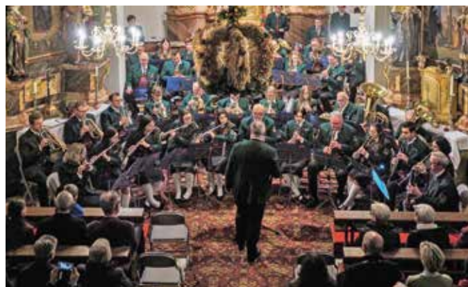
Feierliche Stimmung herrschte in der Pfarrkirche beim Cäcilia-Konzert