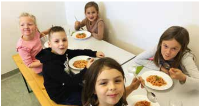
Mit dem Inhalt der gewonnenen Geschenkkörbe wurde in der VS eine Pasta-Party abgehalten.