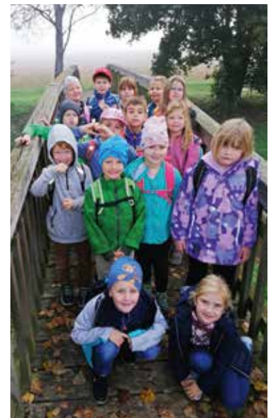
Die Schulanfänger bei der Rittscheinbrücke

Am 6. Okt. 2022 starteten die Schulanfänger der VS Bad Loipersdorf mit ihrer Klassenlehrerin und den Schulasistentinnen zum ersten Wandertag. Die Route führte von der Schule weg zur Rittscheinbrücke und weiter Richtung Golfplatz. Anschließend marschierten die tüchtigen Wanderer durch die Allee zum Sportplatz nach Dietersdorf. Dort stärkte sich die inzwischen müde und hungrig gewordene Truppe mit ihrer Jause. Nach einer kurzen Erholungsphase freuten sich die Erstklässler auf das gemeinsame Spiel am Sportplatz. Nach viel Spaß machten sich alle gut gelaunt auf den Rückweg zur Schule.