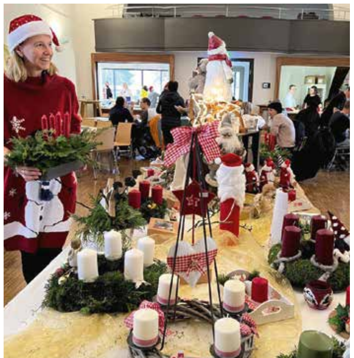
Der Adventmarkt im Pfarrheim war sehr gut besucht.