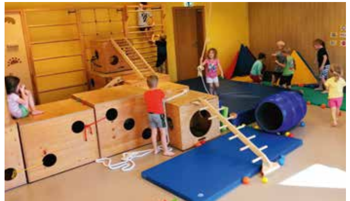
Die Bewegungsbaustelle ist immer wieder ein Highlight im Kindergarten.

Im November hatte der Kindergarten im Turnraum die Bewegungsbaustelle aufgebaut. Viele Materialien wie Decken, Matten, ein großes Bällebad, große Holzkisten usw. wurden zum Bewegen, Erfahren und Erforschen angeboten. Es ist jedes Jahr ein tolles Projekt, indem die Kinder viele Erfahrungen sammeln können und jede Menge Spaß haben.