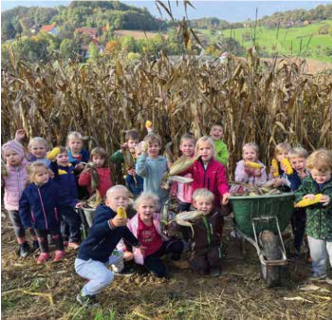
Stolz präsentierten die Kinder die geernteten Maiskolben.

Ein Besuch auf dem Bauernhof durfte selbstverständlich nicht fehlen. Diesmal stand die Maisernte an, bei der die Kinder ihren Spaß hatten. Das Highlight war natürlich das Durchlaufen des großen Maisfeldes.