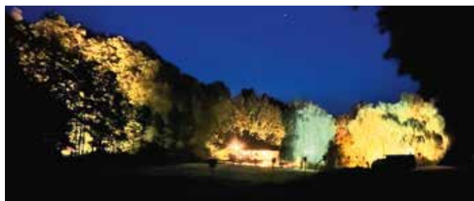
Lagerfeuer beim Fischteich in Stein

Schließlich, und mit Gottes Segen, kehrten alle Biker zurück. Ab jetzt standen Benzingespräche, Drinks und Food sowie viel Gelächter am Programm. Bis spät in die Nacht wurde ausgelassen am Lagerfeuer beim Teich in Stein gefeiert.