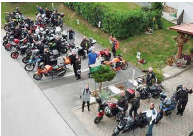
Season End Feier im Gästehaus Nora in Stein

Schließlich, und mit Gottes Segen, kehrten alle Biker zurück. Ab jetzt standen Benzingespräche, Drinks und Food sowie viel Gelächter am Programm. Bis spät in die Nacht wurde ausgelassen am Lagerfeuer beim Teich in Stein gefeiert.