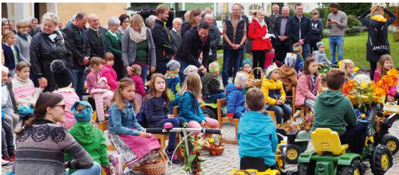
Stolz fahren die Kinder mit ihren Gerätschaften zum Erntedankfest am Kirchplatz vor.