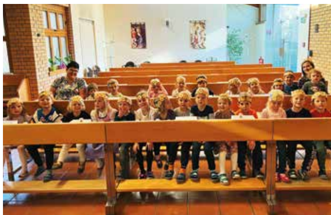
Feierlich wurde in der Thermenkapelle das Erntedankfest begangen.

Traditionell feierte der Tourismuskindergarten das alljährliche Erntedankfest. Mit einem bunt gefüllten Erntedankwagen zogen die Kinder durch die Therme, bis hin zur Thermenkapelle, wo sie eine schöne Feier mit vielen Liedern und Erntedankgaben erlebten.