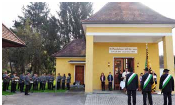
Heldenehrung vor der Magdalena-Kapelle in Stein