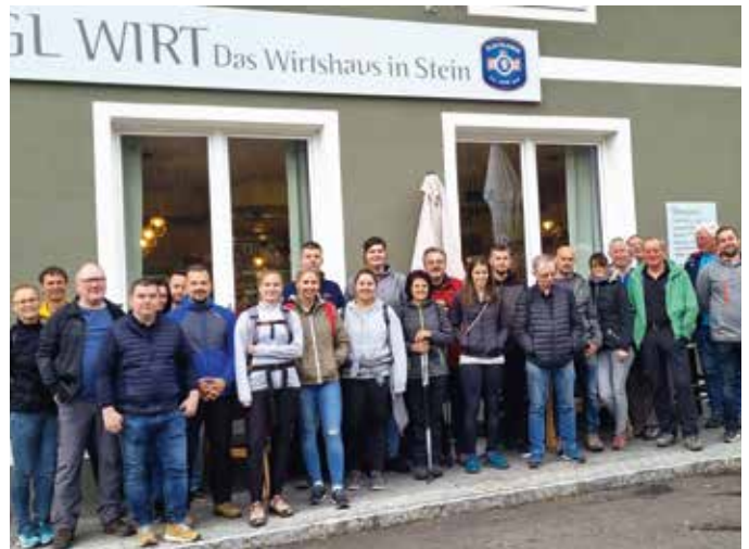
Viele Teilnehmer beim Wandertag rund um Stein

Der Wandertag rund um Stein fand am Nationalfeiertag bei Sportbegeisterten aller Generationen reichlich Anklang. Mit traditionellem Start beim Stangl-Wirt ging die Route heuer bis zum Buschenschank Hutterer nach Rittschein und fand beim Buschenschank Sorger seinen wohlverdienten Ausklang.