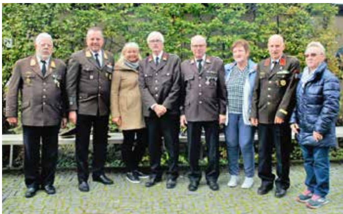
Die Teilnehmer an der Wallfahrt aus Dietersdorf und Gillersdorf