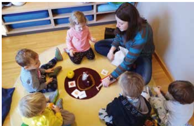
Vorbereitung auf den Nikolausbesuch

Mit Freude und Begeisterung haben sich die Jüngsten, die Krabbelkäferkinder, auf den Besuch vom Nikolaus vorbereitet. Beim Bedrucken der Nikolaussackerl hatten die Kinder großen Spaß. Auch das Singen des Liedes: „Öffnet doch dem Nikolaus die Tür“ haben die Kinder intensiv erlebt und konnten mit Gesang und dem tollen Mitmachlied dem Nikolaus eine Freude machen.