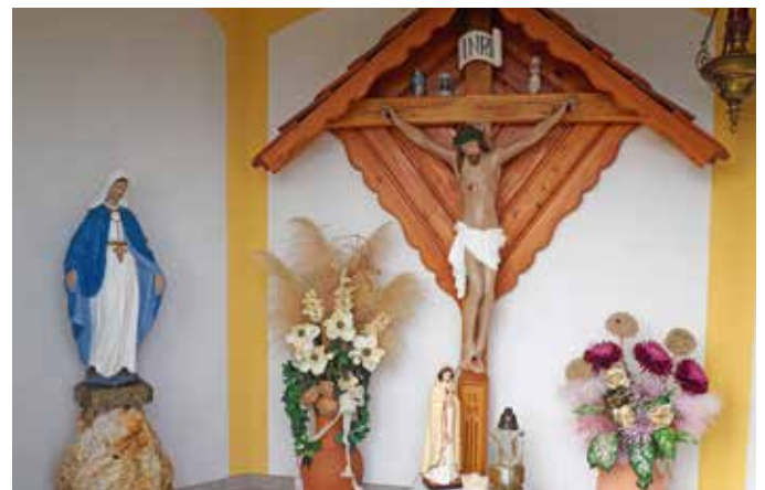
Das Innere der Konrath-Kapelle ziert das restaurierte Kreuz aus dem Jahr 1988