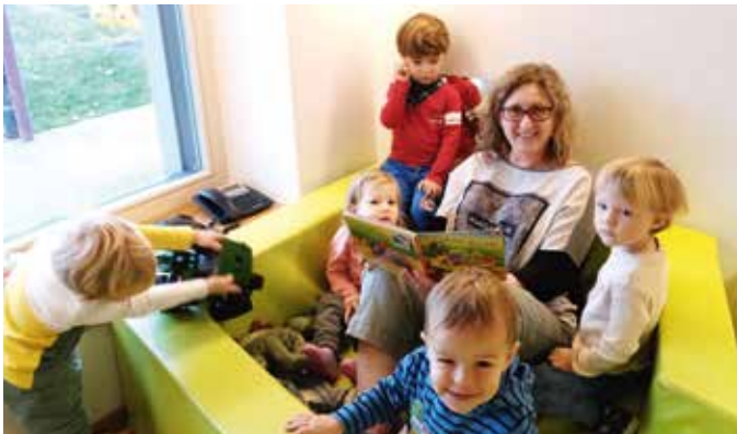
Im KG Bad Loipersdorf wird großer Wert auf die Bedürfnisse der Kids gelegt.

Das Kindergartenteam nimmt die Interessen und Bedürfnisse der Schützlinge wahr und plant danach die Bildungsschwerpunkte.