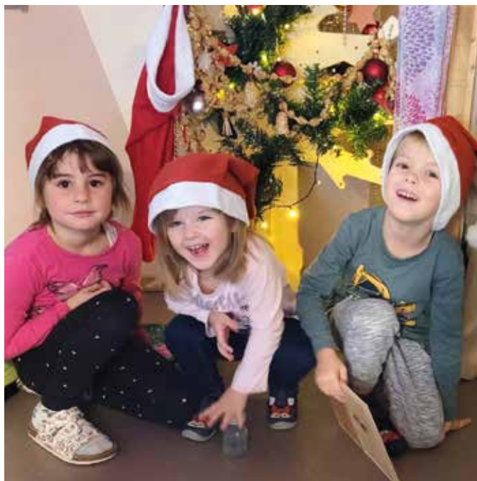
Kinder mit dem geschmückten Baum in der Weihnachtswerkstatt

Alle im Kindergarten freuen sich auf diese geheimnisvolle und wunderbare Zeit und wünschen allen, ob Groß ob Klein eine besinnliche Advent- und Weihnachtszeit!