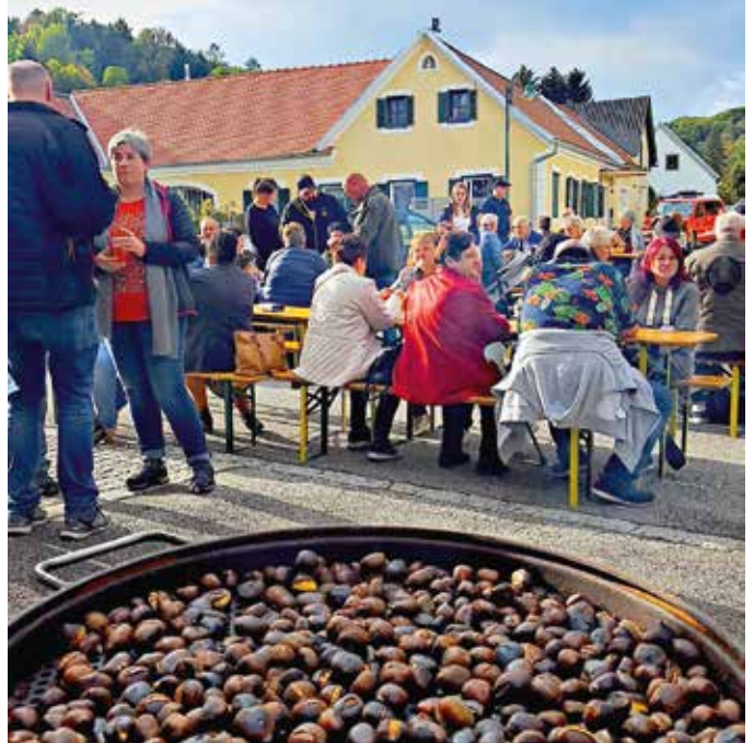
Gute Laune herrschte bei „Kastanien & Sturm“ beim Rüsthaus der FF Stein

Am 2. Oktober 2022 veranstaltete die Feuerwehr Stein wieder „Kastanien & Sturm“ beim Rüsthaus und konnte zahlreiche Gäste begrüßen.