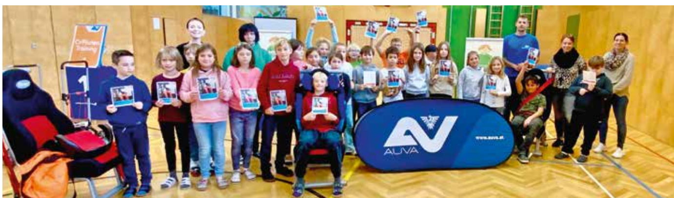
Co-Piloten-Training in der VS Bad Loipersdorf

Im heurigen Herbst durften die Schülerinnen und Schüler der 2. bis 4. Schulstufe am kostenlosen Co-Piloten-Training der AUVA teilnehmen.