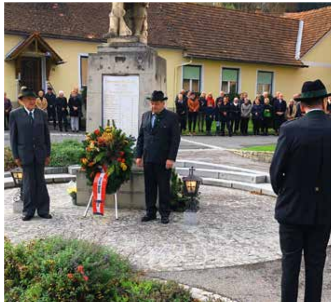
Kranzniederlegung beim Kriegerdenkmal in Loipersdorf