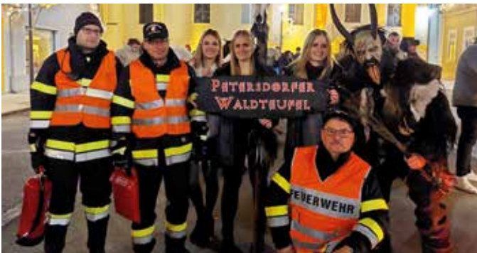
Die FF Gillersdorf sorgte für die Sicherheit der Petersdorfer Waldteufel.

Am 26. November 2022 waren mehr als 300 Perchten aus verschiedenen Bundesländern in der Fürstenfelder Innenstadt im Einsatz. Für diese Großveranstaltung waren viele freiwillige Helfer für die Sicherheit notwendig. Jede der ca. 30 Perchtengruppen musste aus brandschutztechnischen Gründen begleitet werden. Einige Kameraden der FF Gillersdorf waren im Einsatz und für den Brandschutz für eine Gruppe aus der Südoststeiermark verantwortlich.