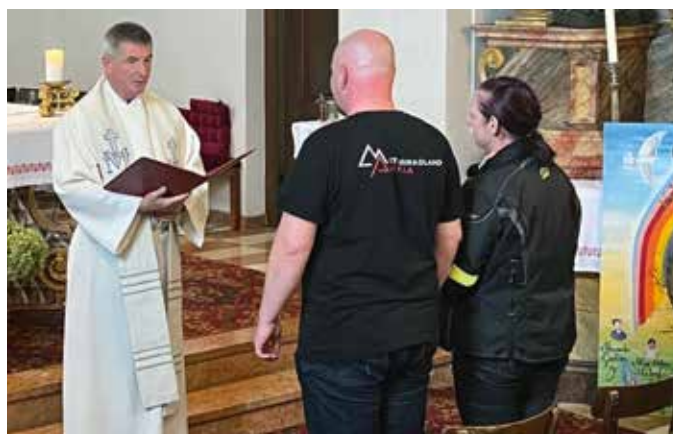
Nach 20-jähriger Ehe erneuerte ein Biker-Pärchen in der Pfarrkirche Bad Loipersdorf ihr Eheversprechen.

An diesem Tag zeigte sich der Herbst in bester Manier. Eine gemeinsame Ausfahrt wurde von strahlendem Sonnenschein begleitet. Die Route führte durch die südliche Steiermark bis zur Kirche in Loipersdorf. Hier gab es zur Überraschung aller eine besondere Aktion. Ein Biker-Pärchen beging sein 20-jähriges Ehejubiläum und gab sich erneut das JA-Wort.