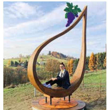
Weintropfen – gestaltet von Schülern der LBS Fürstenfeld