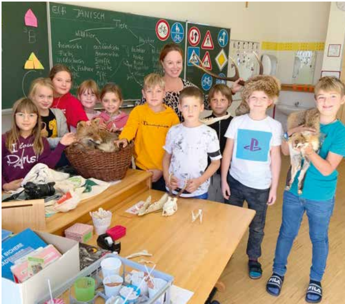
Begeisterung bei den Kindern über die Jagdtrophäen

große Vorwissen und das rege Interesse der Kinder für das Thema Wild und Wald und zeigte den jungen Naturschützern nicht nur verschiedene Jagdtrophäen, sondern spielte ihnen unter großem Beifall auch unterschiedliche Jagdsignale auf ihrem Jagdhorn vor. Als besondere Überraschung bekamen die Kinder noch ihren eigenen Wildtierkalender geschenkt, wofür die Freude natürlich sehr groß war.