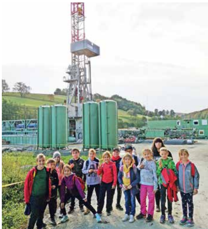
Große Aufregung bei der Bohrturmbesichtigung