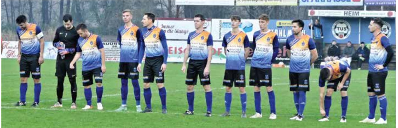
Die Kampfmannschaft mit einigen Nachwuchsspielern aus der U17

Ende der Herbstmeisterschaft auf den neunten Platz mit 14 Punkten ab. Durch diese Ausfälle hatten aber die Jugendspieler aus der U17, die Chance in der Kampfmannschaft auszuhelfen und sie zeigten, dass sie langsam bereit sind, in der Kampfmannschaft Fuß zu fassen.