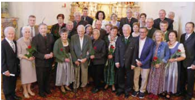
Die Hochzeitspaare anlässlich der Feierlichkeiten