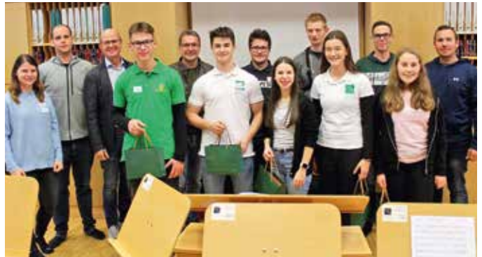
Teilnehmer beim Tag der Blasmusikjugend

„Mit dem Wissen, welches großes Potenzial und welche Talente in unserer Blasmusikjugend steckt, freuen wir uns auf viele weitere Auftritte unseres Jugendblasorchesters.“