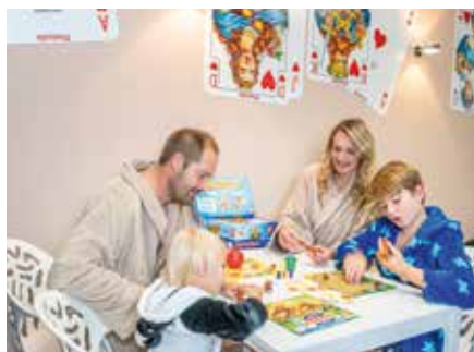
Spiel und Spaß im Thermenresort Loipersdorf

Familiensuite sind für einen ganzen Tag buchbar, auf Anfrage und nach Verfügbarkeit. Der Eintritt in das Thermen- und Erlebnisbad ist inkludiert. Die Buchung ist entweder telefonisch 03382/8204-50 oder per E-Mail unter wellness@therme.at möglich. Geschenktipp für die ganze Familie: Wert- und Geschenkgutscheine vom Thermenresort Loipersdorf. Diese kannst du ganz einfach Online www.therme.at/gutscheine oder per E-Mail info@therme.at bestellen. Viel Freude beim Verschenken. Loift bei uns!