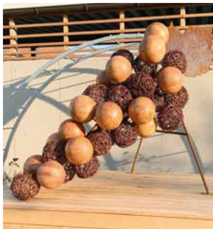
Riesen-Holz-Weintraube – gestaltet vom Team der Fa. Edelmann