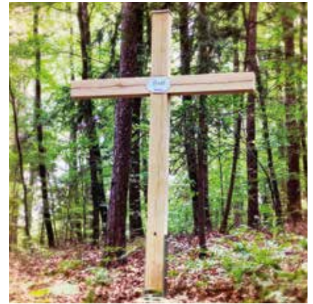
Das neue Steßl-Kreuz an der Schaffelbadstraße