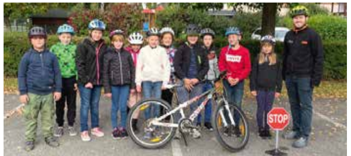
Großes Interesse herrschte beim Besuch der Radfahrschule Easy Drivers.

Im heurigen Herbst wurde in der Volksschule wieder ein ausgebildeter Radfahrlehrer der Radfahrschule Easy Drivers begrüßt. Im zweistündigen klimaaktiv mobilen Radfahrkurs wurden die Schülerinnen und Schüler der dritten und vierten Schulstufe dazu animiert, das Fahrrad als umweltfreundliche und gesundheitsfördernde Mobilitätsform wahrzunehmen und ihre Fahrpraxis im geschützten Bereich zu trainieren. Der Radfahrkurs wird vom Bund finanziell unterstützt und ist für Volksschulen kostenfrei.