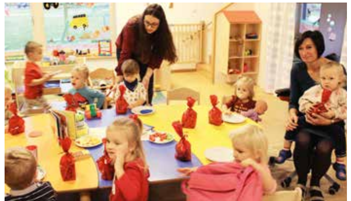
Die „Krabbelkäfer“ beim Jausnen