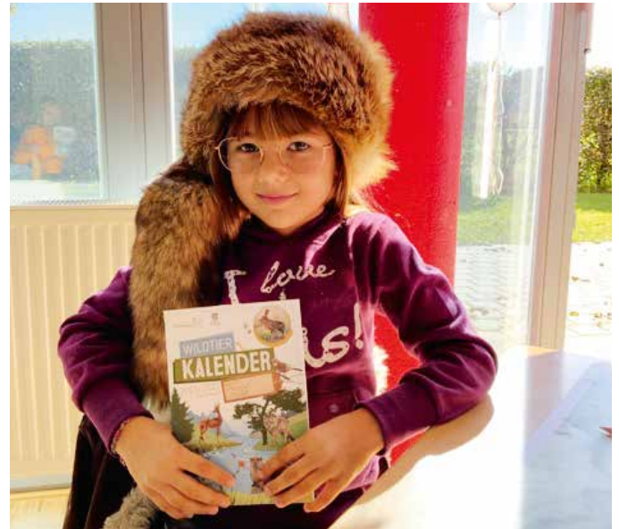
Der Wildtierkalender ist toll.