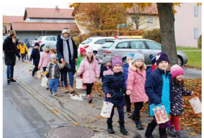
Laternenzug durch das Dorf