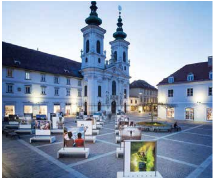
So zeigte sich die Ausstellung am Mariahilfer-Platz in Graz

Weitere Infos unter: menschenbilder.photo