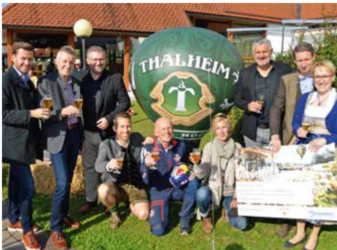
Viel Prominenz beim Bierfassanstich

Ab sofort genießen die Gäste des Schaffelbades ein ganz besonderes Bier: Das Thalheim Bier, gewonnen aus erlesenen Zutaten und Heilwasser, entsprungen aus dem ältesten Gesundbrunnen der Steiermark.