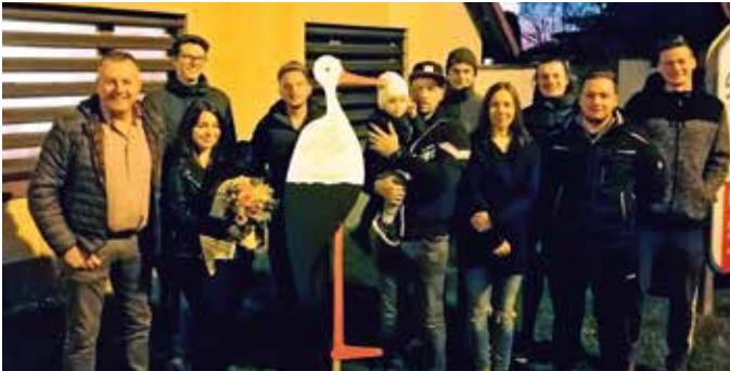
Erfreut zeigten sich die jungen Eltern über den Besuch der FF Dietersdorf