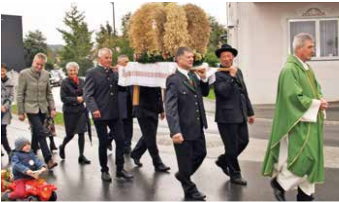
Die Erntekrone wird zur Pfarrkirche gebracht.