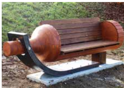
Schwebeflasche – gestaltet von Schülern der LBS Fürstenfeld