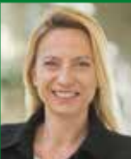
Dr. in Juliane Bogner-Strauß