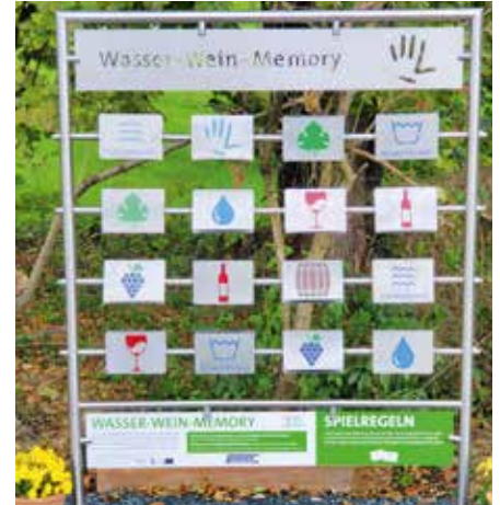
Memory – gestaltet vom Team der Schlosserei Sorger