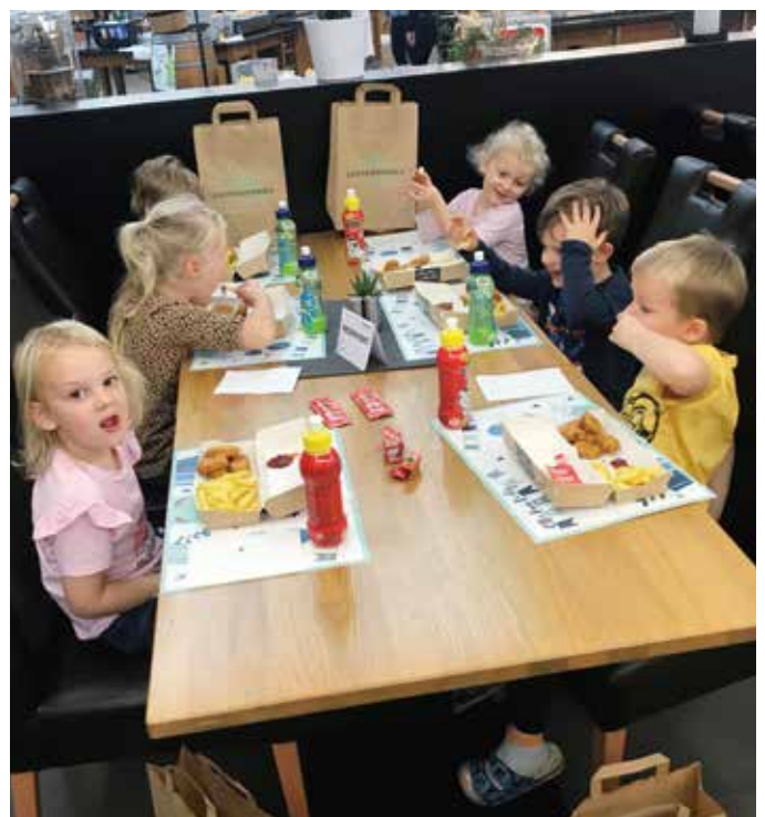
Die Kinder freuen sich über das Otto-Menü.