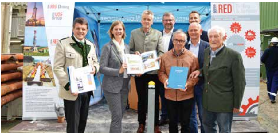
Stolz wird die Thermenchronik präsentiert.

In der Chronik lesen Sie von den spannenden Anfängen, einer Brandkatastrophe als Wendepunkt, über die Entwicklung einer atemberaubenden Region bis hin zu innovativen Projekten der Jetztzeit. Tauchen Sie sprichwörtlich ein in die Geschichte einer eindrucksvollen Unternehmensentwicklung, die sich so niemand hätte vorstellen können. Ein Dank gilt den Autoren Franz Timischl und Franz Gether .