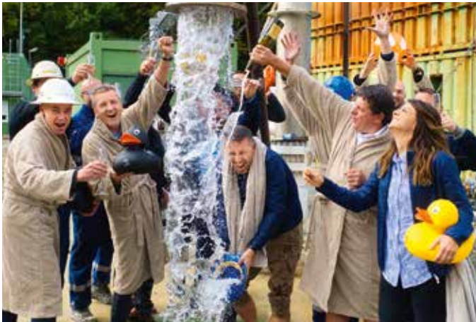
Große Freude bei der erfolgreichen Bohrung im Rehgraben

Endlich ist es soweit, mit Freude verkünden wir: Das Wasser aus der vierten Thermalwasserquelle sprudelt! Aus 1.100 Metern wird das qualitativ hochwertige „Heilwasser“ an die Oberfläche befördert. Anfang 2022 werden die Gäste des Thermenresorts Loipersdorf plangerecht im Wasser aus dem Rehgraben baden können.