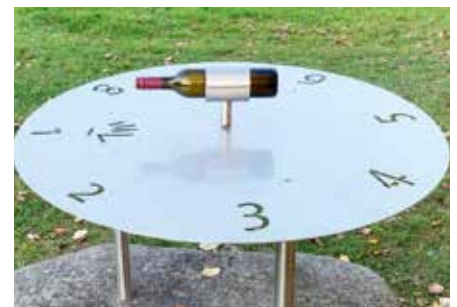
Flaschendreher – gestaltet vom Team der Schlosserei Sorger