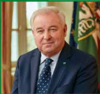
Hermann Schützenhöfer Landeshauptmann