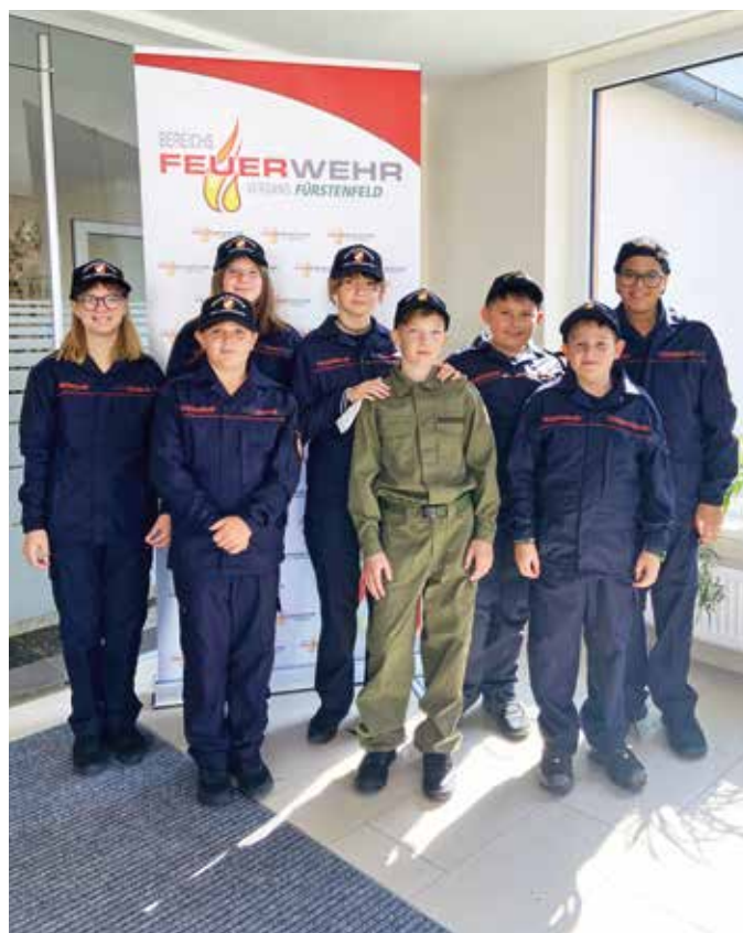
Die Teilnehmer beim Wissenstest