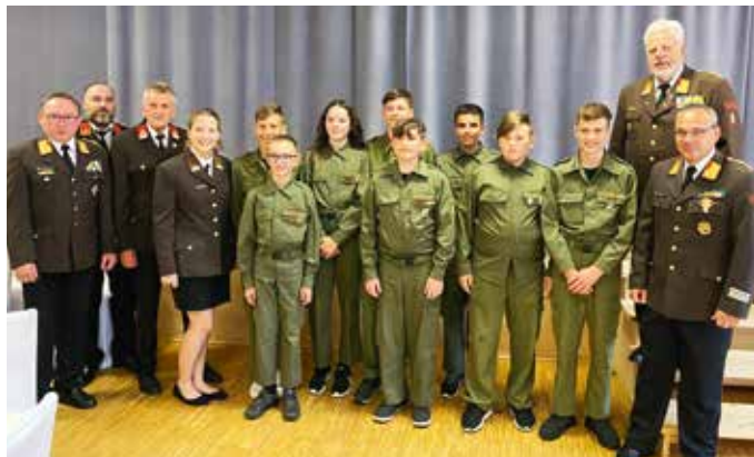
Die Feuerwehrjugend mit Ehrengästen