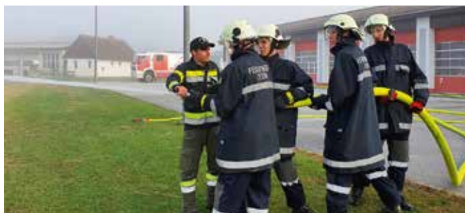
Großes Interesse zeigten die Teilnehmer der FF Stein bei der Grundausbildung.

Am 25. September 2021 fand in Fürstenfeld der technische Teil der Grundausbildung statt. Der zweite Teil, betreffend der Brandausbildung, fand am 23. Oktober 2021 in Ilz statt. Sechs Mann der Feuerwehr Stein nahmen an der Grundausbildung teil und absolvierten diese positiv.