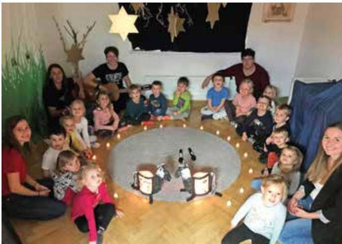
Laternenfest einmal anders

„Ich gehe mit meiner Laterne, und meine Laterne mit mir...“ Das Laternenfest ist wohl eine der schönsten Traditionen im Verlauf des Kindergartenjahres. Auch wenn das Fest dieses Jahr etwas anders ablaufen musste, war es für die Kinder etwas Besonderes. Ganz unter sich zogen sie mit ihren selbstgebastelten Laternen durch die Therme und erhellten den Tag.