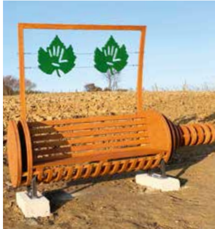
Fliegende Weinblätter – gestaltet von Schülern der LBS Fürstenfeld

Details unter www.loipersdorf.at/weinerlebnisweg