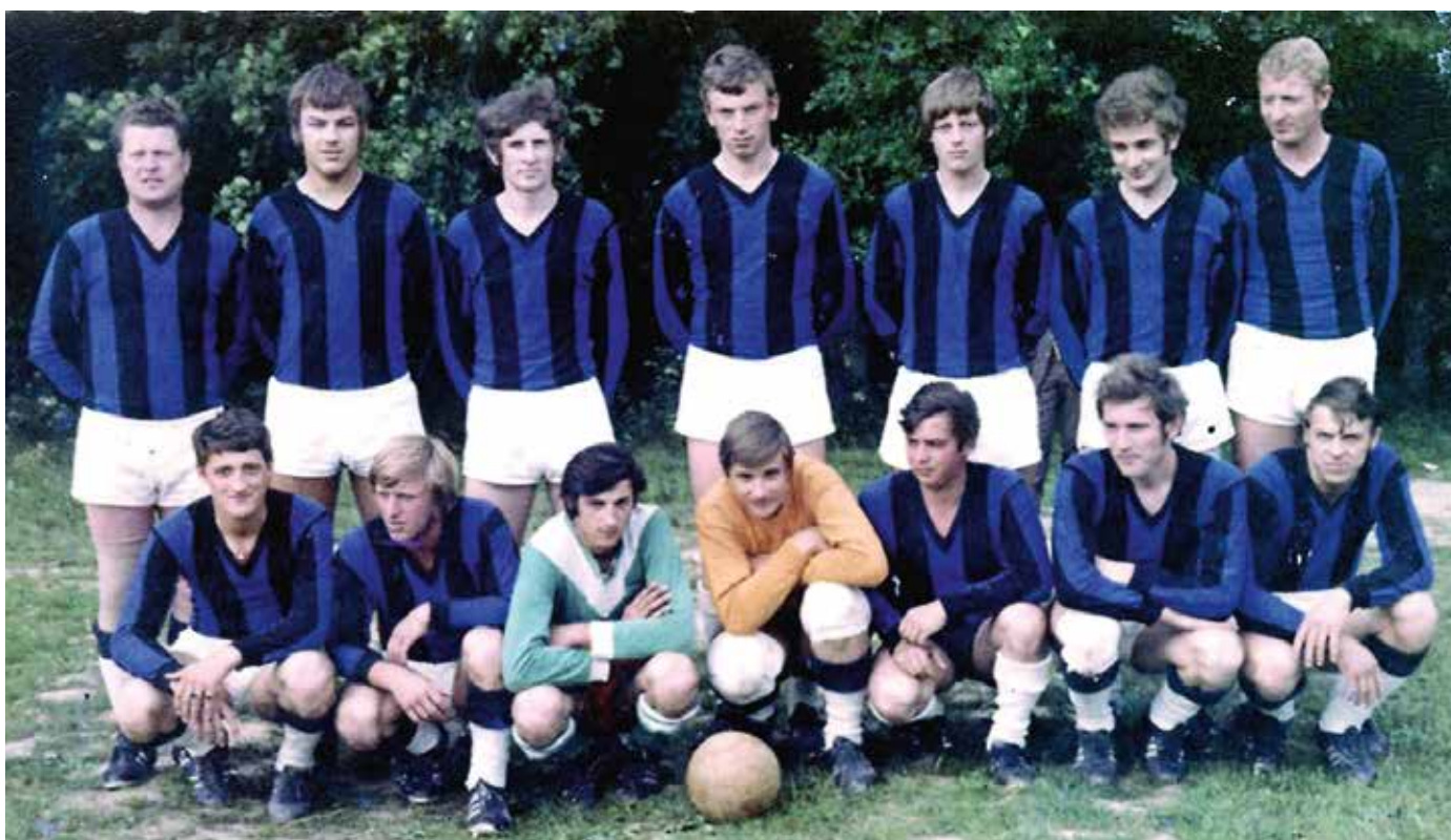
Meistermannschaft 1970/71 - 2. Klasse Ost B

und Fototermin am Sportplatz in Dietersdorf ging es zu einem gemütlichen Beisammensein zum Buschenschank Thurner . Dort wurden bis spät in die Nacht alte Fußball-Erinnerungen geweckt, lustige Anekdoten erzählt - aber es gab auch einiges aus dem Leben nach der „Fußballer-Zeit“ zu berichten - schließlich hatten sich einige Spieler ein paar Jahrzehnte lang nicht mehr gesehen. Am Ende waren Freude und Begeisterung über dieses Treffen bei allen groß - einer Wiederholung dürfte damit nichts im Wege stehen.