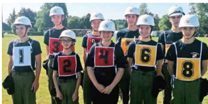
Jugendbewerb 1 & 2

Auf der Bewerbsbahn und im Staffellauf wurden tolle Leistungen erbracht und das Abzeichen in Bronze konnte von allen erworben werden. Eine Gruppe konnte sogar den ausgezeichneten zweiten Platz in der Gesamtwertung erreichen.