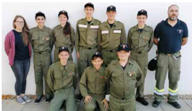
Die Teilnehmer der FF Stein beim Wissensquiz

Der Wissenstest der Feuerwehrjugend fand am 9. Oktober in Söchau statt. Die Feuerwehr Stein war mit acht Jugendlichen in den Kategorien Bronze, Silber und Gold vertreten. Auf sechs Stationen mussten sie ihr Wissen über Knotenkunde, Gerätekunde, Dienstgrade usw. unter Beweis stellen. Alle Jugendlichen konnten die Aufgaben mit Bravour meistern und ihre Abzeichen in der jeweiligen Kategorie erwerben.