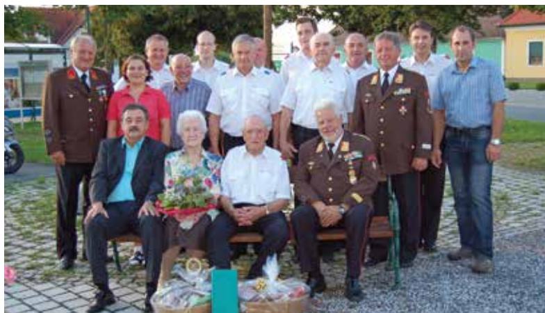
Der Jubilar mit Gratulanten

Wir feierten mit dem Jubilar und seiner Gattin bis spät in den Abend, genossen Speis' und Trank sowie die eine oder andere lustige Feuerwehrgeschichte von „anno dazumal“.