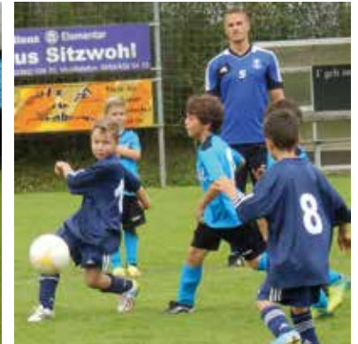
Unsere Damenmannschaft sowie unsere jüngsten Nachwuchskünstler