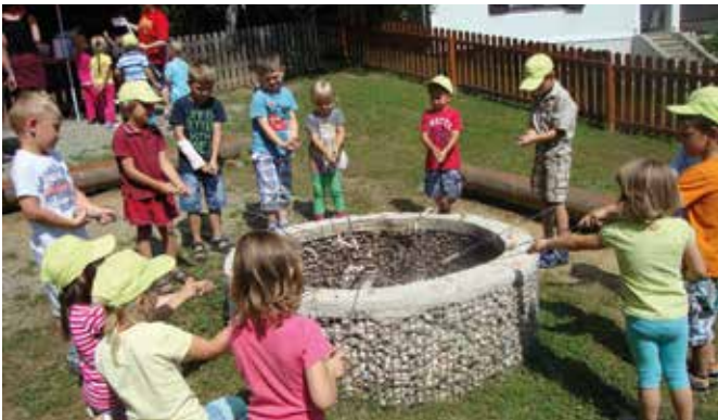
Unsere Kids beim Würstl grillen

Am 2. Juli fand unser Abschlussausflug zum Märchenwald in Mühlgraben statt. Dort angekommen wurde der Wald mit seinen Märchen und Spielmöglichkeiten erkundet und entdeckt. Danach konnten die Kinder bei einem gemütlichen Lagerfeuer ihre Würstl selber grillen. Der gesamte Märchenwald mit seinen Attraktionen hat den Kindern große Freude bereitet. Mit dem Bus fuhren wir müde aber fröhlich wieder zurück in den Kindergarten.