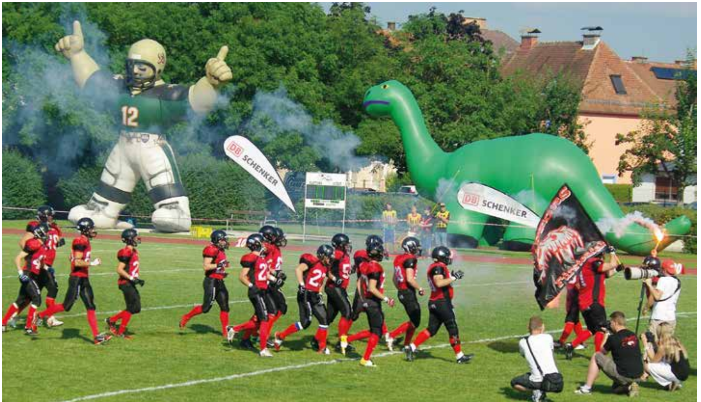
Den über 400 Zusehern wurde beim Finale in Fürstenfeld eine große Show geboten

Hatten die Atlas Raptors Fürstenfeld den Aufstieg im letzten Jahr noch knapp verpasst, so wurde dieser im zweiten Meisterschaftsjahr verwirklicht. Im Halbfinale mussten die Raptors am 5. Juli in Wien gegen die Vienna Knights antreten.