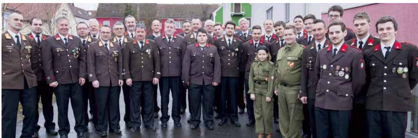
Auf dem Foto sind die Ausgezeichneten bzw. Beförderten sowie Ehrengäste zu sehen.

Die Ehrengäste würdigten in ihren Grußworten die Leistungen der Feuerwehr im abgelaufenen Jahr.