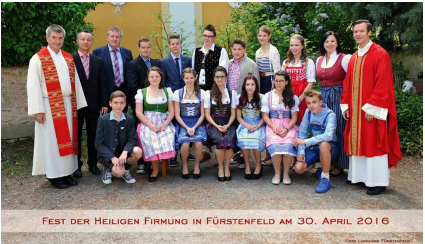
FEST DER HEILIGEN FIRMIUNG IN FÜRSTENFELD AM 30. APRIL 2016