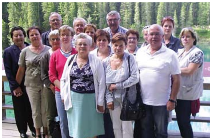
Teilnehmer beim Südtirol-Ausflug

Eine kleine aber feine Gruppe von 16 Personen machte sich am 1. Juli auf den Weg nach Südtirol. Wir besuchten die Latschenölbrennerei, sowie das