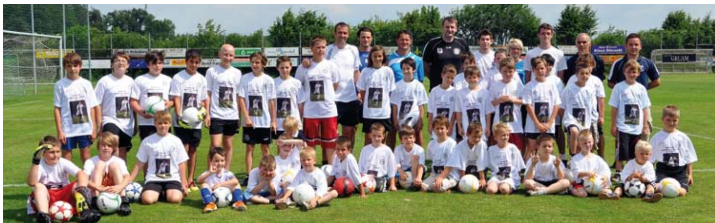
Mario Haas mit Nachwuchskickern des DUSV

Großer Tag für die Nachwuchskicker des DUSV : am 3. Juni gab es auf unserer Sportanlage ein Training unter der Leitung von „ Sturm-Legende “ Mario Haas . Die Burschen und Mädchen waren