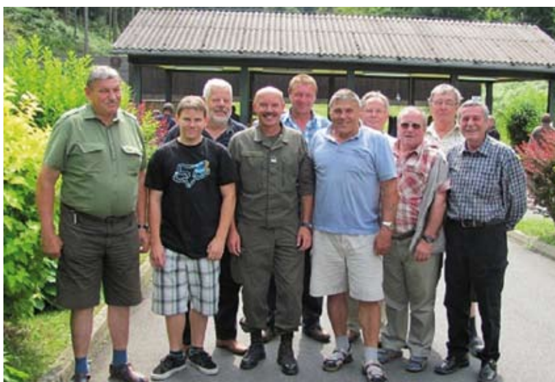
ÖKB Teilnehmer beim Bezirksschießen

Der ÖKB möchte sich auf diesem Wege recht herzlich bei den teilnehmenden Schützen bedanken und daran erinnern, dass im nächsten Jahr der Wanderpokal zu verteidigen ist.