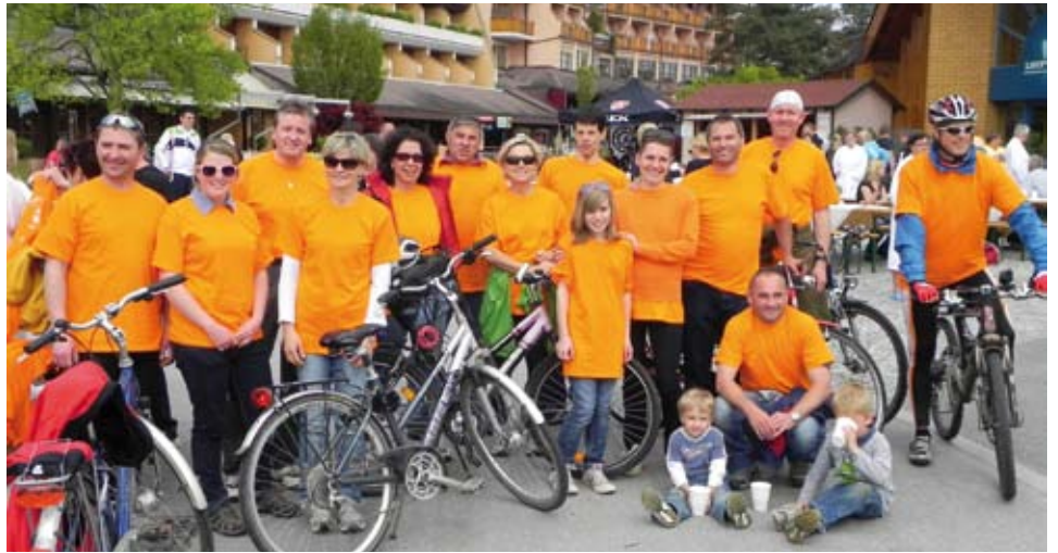
Teilnehmer der Radsternfahrt 2011

Am Abend – nach einem Gottesdienst - nahmen dann zu Ehren des heiligen Florian die Mitglieder aller 4 Feuerwehren unserer Gemeinde, sowie die Feuerwehrkameraden von der FF Stein Aufstellung und marschierten mit dem MV Therme Loipersdorf an der Spitze eine Ehrenrunde.