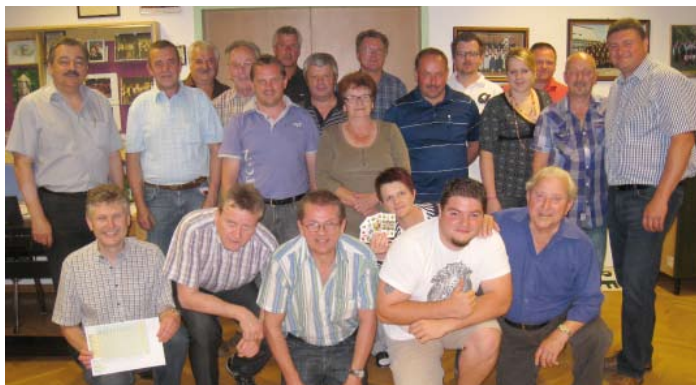
Teilnehmer beim Vergleichs-Schnapsen

Am 13. Mai 2011 trafen sich die Mitglieder der Freiwilligen Feuerwehr Loipersdorf und die Gemeinderäte zum traditionellen Schnapsvergleichskampf . Im Schulungsraum der Freiwilligen Feuerwehr ging es wieder heiß her, denn die von besonderen Eifer und Ehrgeiz getriebenen Teilneh-