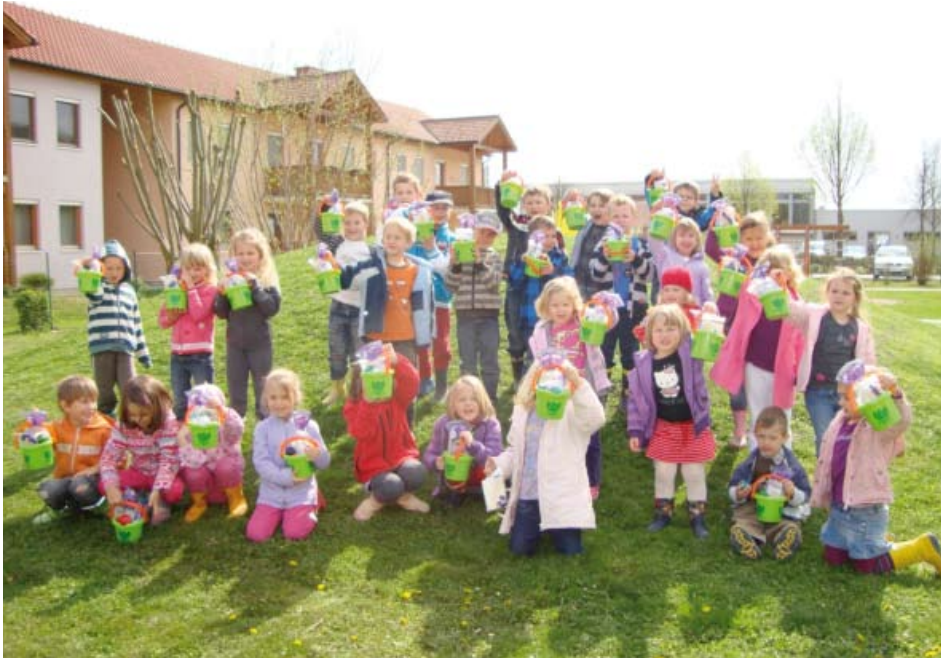
Kindergartenkinder anlässlich der Muttertagsfeier

Am 15. April versteckte der „Osterhase“ im Kindergarten seine Körbchen. Zur Jause gab es selbstgebackene Osterpinsen mit Butter, Wurst, Eier und selbst angesäte Kresse.