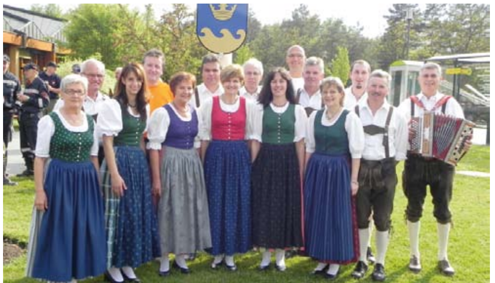
Tanzeinlagen der Volkstanzgruppe beim Maibaumaufstellen in der Therme