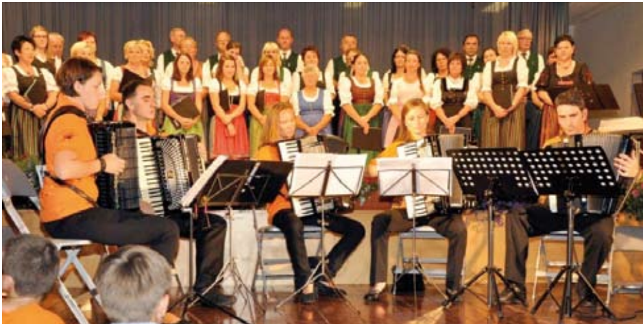
Gemischter Chor Loipersdorf mit dem Akkordeonissimo Fürstenfeld