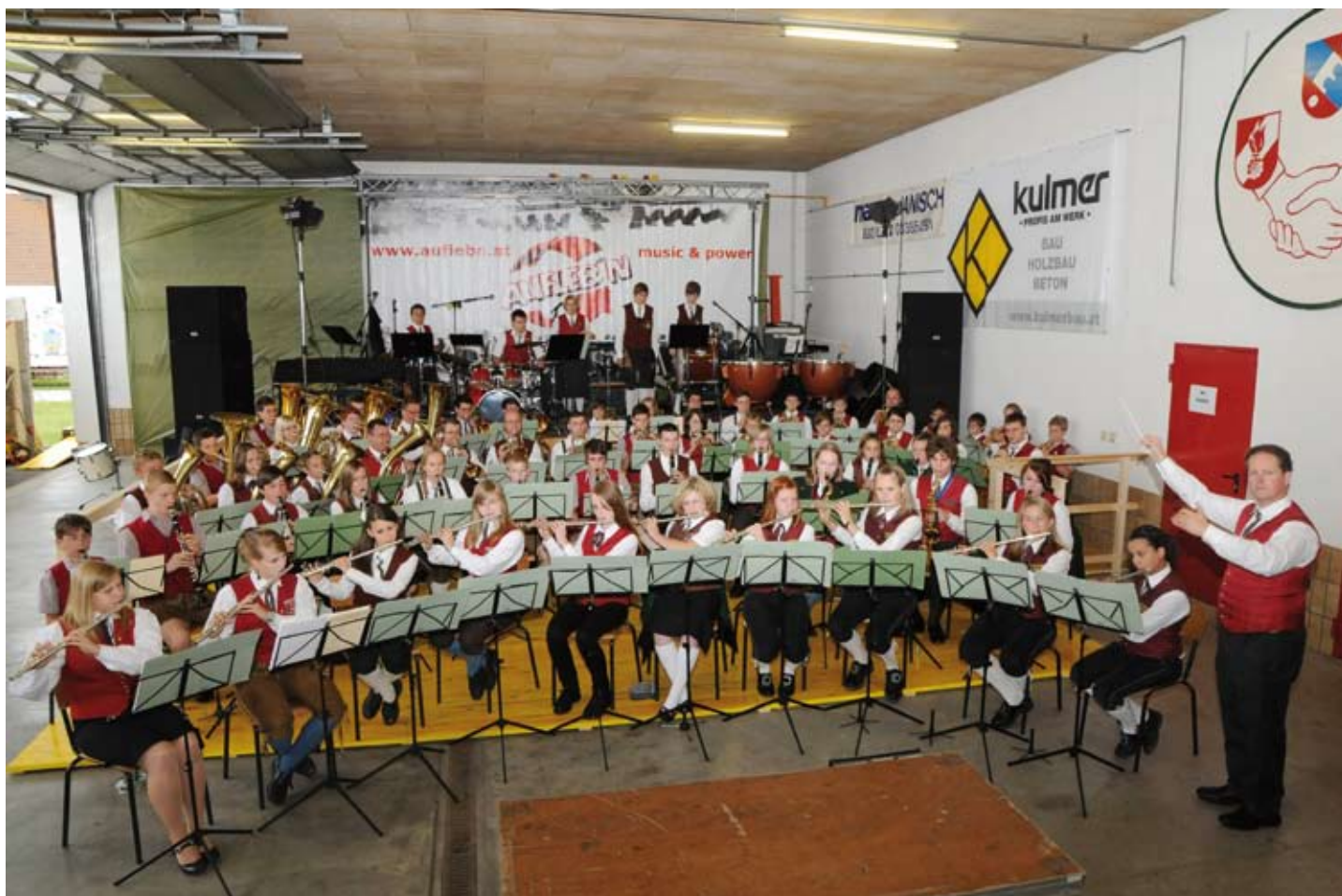
Mitglieder des Bezirksjugendblasorchesters