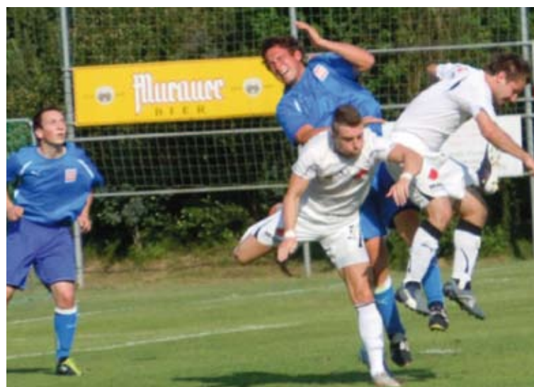
Voller Einsatz auch im letzten Spiel (Sindler/Kummer)