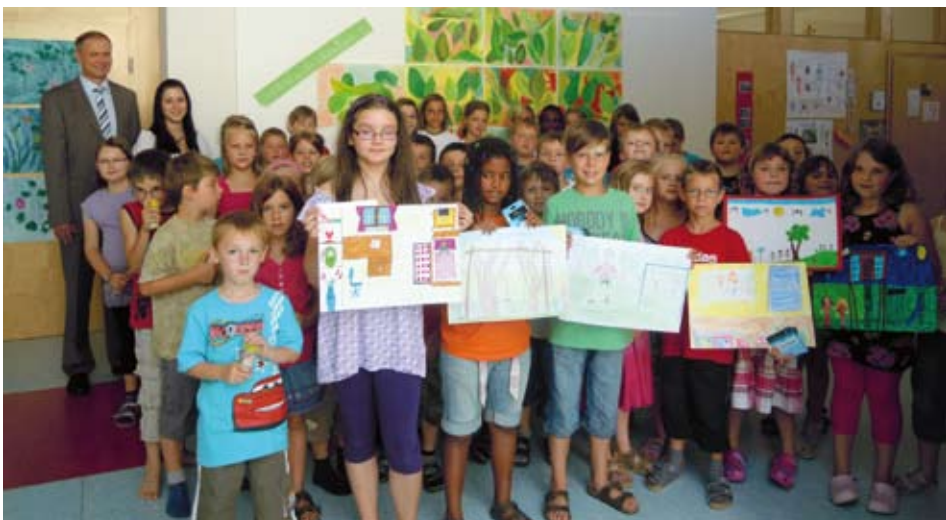
Teilnehmer beim Zeichenwettbewerb

Wie jedes Jahr gab es auch heuer wieder tolle Preise beim Raiba Zeichenwettbewerb zu gewinnen. Voraussetzung war, eine Zeichnung zum Thema: