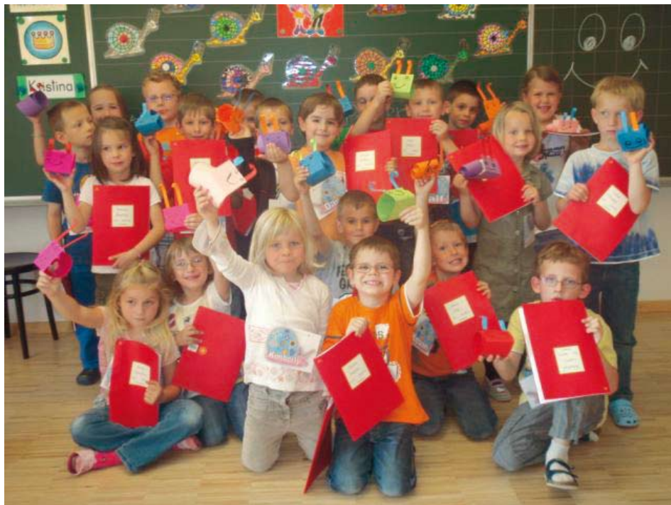
unsere Schulanfänger für das Schuljahr 2011/2012