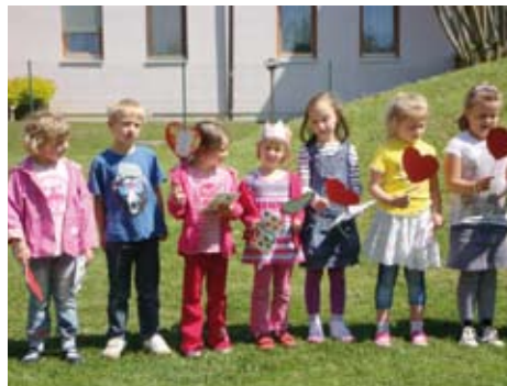
Gedichte werden aufgesagt

Am 6. Mai hatten wir im Kindergarten unsere Muttertagsfeier . Bereits einige Zeit zuvor wurde fleißig gebastelt, gebacken, gesungen und geprobt. Voller Vorfreude konnten es die Kinder kaum erwarten ihre Muttis im Kindergarten zu begrüßen. Dann war der Tag endlich gekommen. Jetzt galt es die Muttis mit Gedichten zu ehren. Man konnte den Kindern die Konzentration und die Freude über ihr eifriges Mittun und Können ansehen. Nach Überreichung der Geschenke wurden die Mamas zum Tanz aufgefordert.