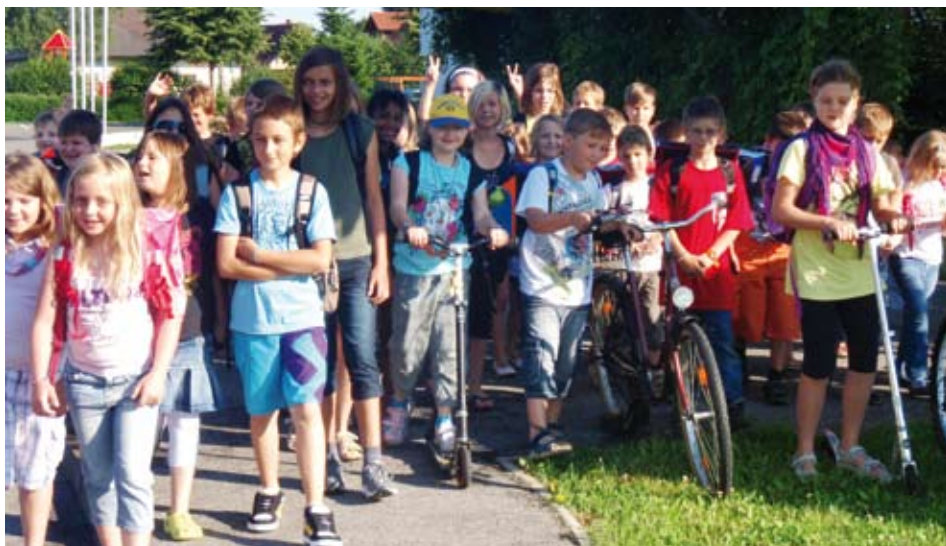
unsere Klimaschützer von der Volksschule

Die Schüler klebten ihre gesammelten „Meilen“ (5400) sehr gewissenhaft in einen eigenen Pass.