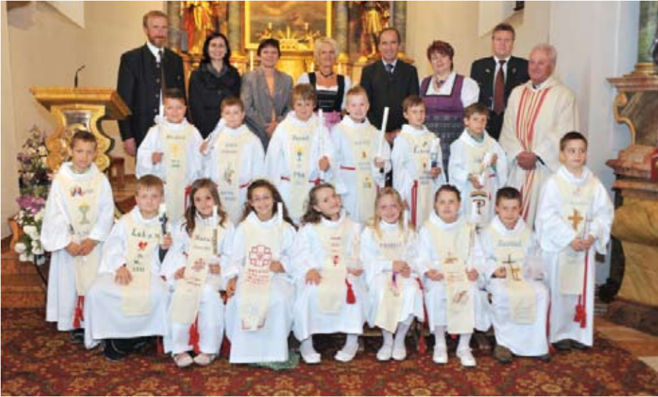
Erstkommunionkinder von der Pfarre Loipersdorf