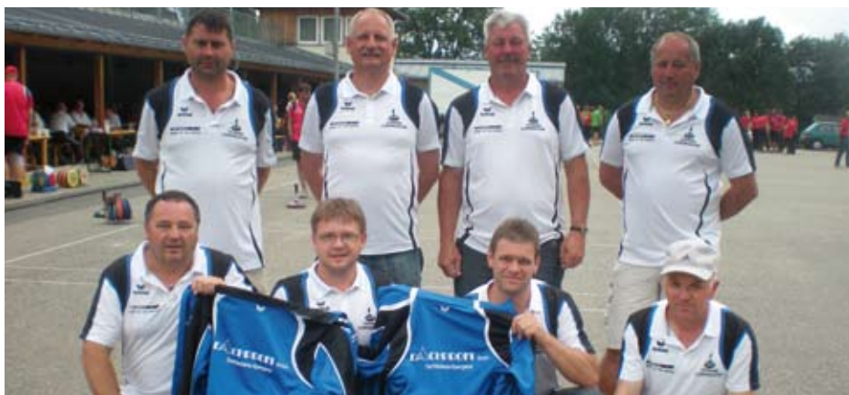
Mitglieder des ESV Therme Loipersdorf beim Internationalen Stocksportturniers

Zum ersten Mal in der Vereinsgeschichte des ESV Therme Loipersdorf wurde das Internationale Stocksportturnier in Seeboden (Region Millstätter See in Kärnten) besucht. Weit über 100 Mannschaften messen sich alljährlich bei diesem Turnier, welches in seiner Art das größte Stocksportturnier Europas ist.