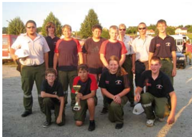
Jugendgruppe der Feuerwehren unserer Gemeinde