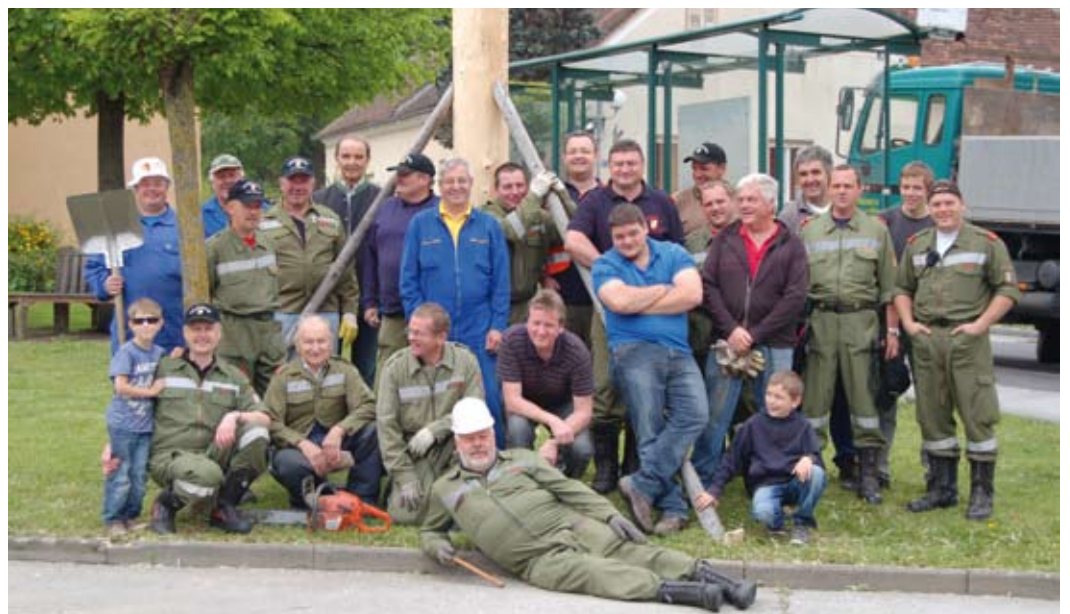
fleißige Feuerwehrkameraden beim Maibaumaufstellen in Loipersdorf

Traditionell wurde im Bereich des Kirchplatzes wieder ein Maibaum, welcher mit Tafeln der einzelnen Berufsstände geschmückt ist, aufgestellt. Geschmückt und aufgestellt wurde der Maibaum wiederum von den Mitgliedern der einzelnen Feuerwehren in unserer Gemeinde. Namens der Gemeinde ein herzliches Danke an all jene, die zum Gelingen beigetragen haben.