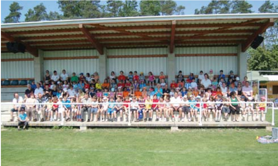
sämtliche Teilnehmer beim diesjährigen Schnuppertraining

Am Mittwoch dem 25. Mai fand am Sportplatz in Dietersdorf wieder das alljährliche Schnuppertraining für die Kinder der Volksschulen Loipersdorf, Stein und Übersbach statt. Die erste sportliche Betätigung musste jedoch die Volksschule Loipersdorf auf sich nehmen, die wie jedes Jahr zu Fuß zum Sportplatz marschierte. Die Schüler aus Stein und Übersbach hatten es da etwas bequemer und wurden