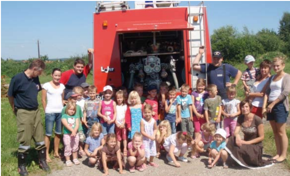
künftige „Florianijünger“ in Aktion

Am 28. Juni besuchten wir unsere Feuerwehr . Den Kindern wurde das Feuerwehrhaus gezeigt sowie die Fahrzeuge ausführlich und genau erklärt. Die Freude wurde RIESENGROSS als die Kinder dann mit dem „echten“ Feuerwehrauto mitfahren, und am Ende auch noch mit dem Wasserschlauch spritzen durften.