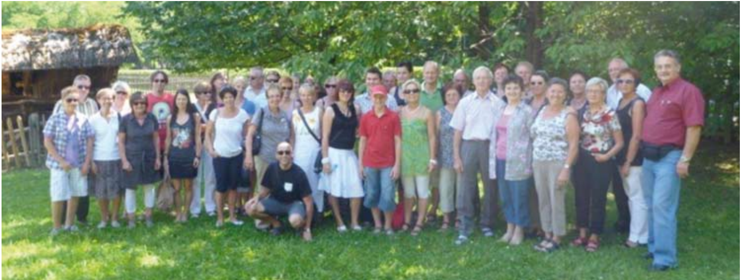
Teilnehmer des „Bühne“ Ausfluges

Der heurige Ausflug führte die Mitglieder der „Bühne“ Loipersdorf am 9. Juli ins mittlere Burgenland.