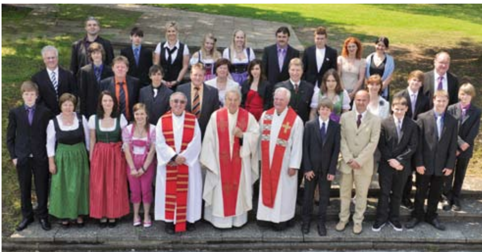
Loipersdorfer Firmlinge mit Paten, Firmspender, Firmbegleiter und Bgm.

Ein motiviertes Team von ehrenamtlichen FirmbegleiterInnen aus unserer Pfarre, unter der Leitung