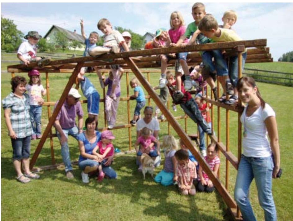
Kindergartenkinder beim Spielen

Ende Mai hatten wir unsere Schnuppertage wo die neuen Kindergartenkinder für Herbst unsere Einrichtung besuchen, und sich am Tagesgeschehen beteiligen konnten. Wir hoffen es hat ihnen gefallen und freuen uns sie im Herbst in unserer Gruppe begrüßen zu dürfen.