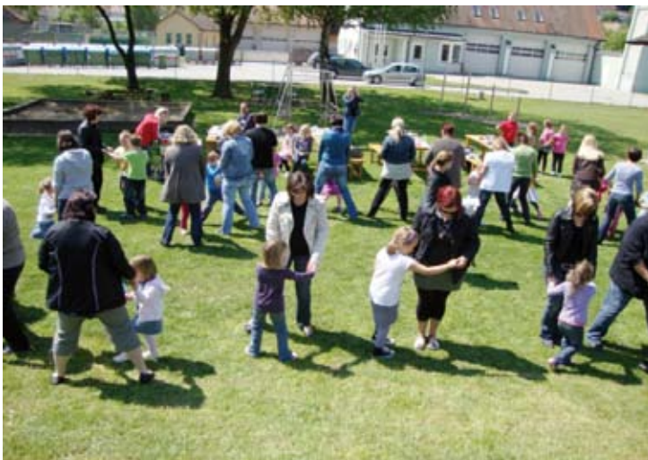
Muttis beim Tanzen

Anschließend war bei Kaffee und Kuchen auch noch genügend Zeit für ein gemütliches Beisammensein und Plaudern. Eine schöne Feier ging zu Ende.