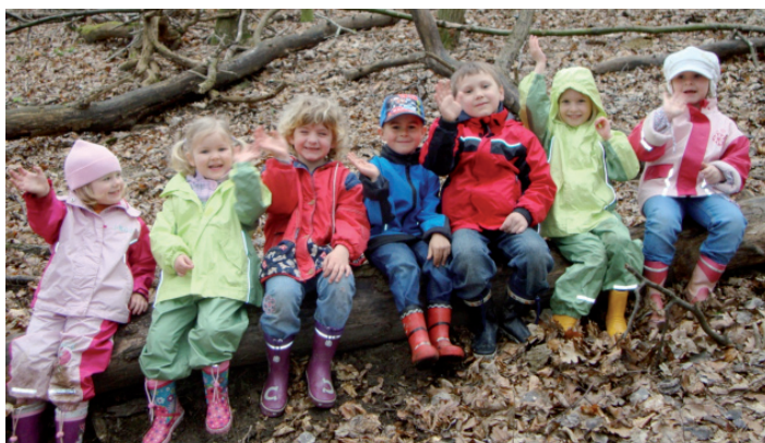
Rasten im Wald