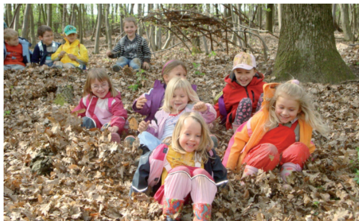
Rutschen im Wald