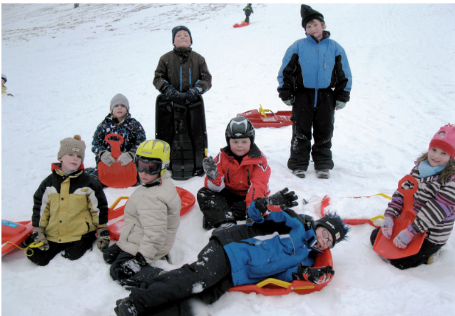
Kinder beim Bobfahren

Auch heuer verbrachten wieder alle SchülerInnen, Lehrerinnen und einige Eltern auf der Teichalm einen schönen Tag im Schnee. Viele Kinder sausten auf ihrem Bob den Berg hinunter, andere wedelten gekonnt über die Piste und einige zogen auf dem zugefrorenen See ihre Runden. Unfallfrei und erschöpft ging es am Nachmittag wieder zurück nach Hause. Der Elternverein übernahm die Hälfte der Buskosten. Herzlichen Dank dafür.