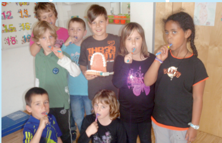
Schulkinder beim Zähneputzen

Am 8. Februar besuchte Frau Plessl, Kariesprophylaxeberaterin, alle 4 Schulstufen der VS Loipersdorf.