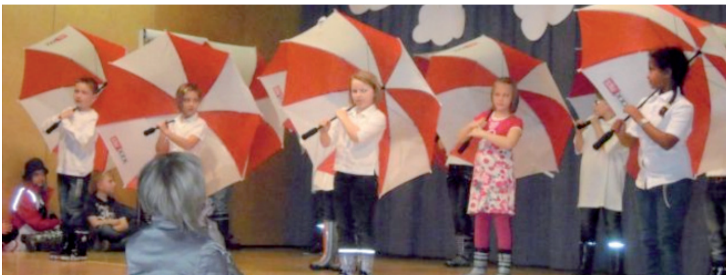
Kinder als tanzende Regenschirme

Der Abend war großartig besucht. Der Elternverein unter der Obfrau Niki Bachner sorgte mit vielen kreativen Ideen für das leibliche Wohl. Herzlichen Dank!