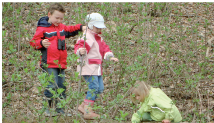
Balancieren im Wald

Am 1. April starteten wir unser Waldprojekt. In Gruppen eingeteilt werden wir in den nächsten Wochen immer wieder in den Wald gehen und schauen was es zu Entdecken, Erforschen und Erkunden gibt und hoffen somit, dass die Kinder und wir viele neue Erfahrungen und Eindrücke sammeln werden.