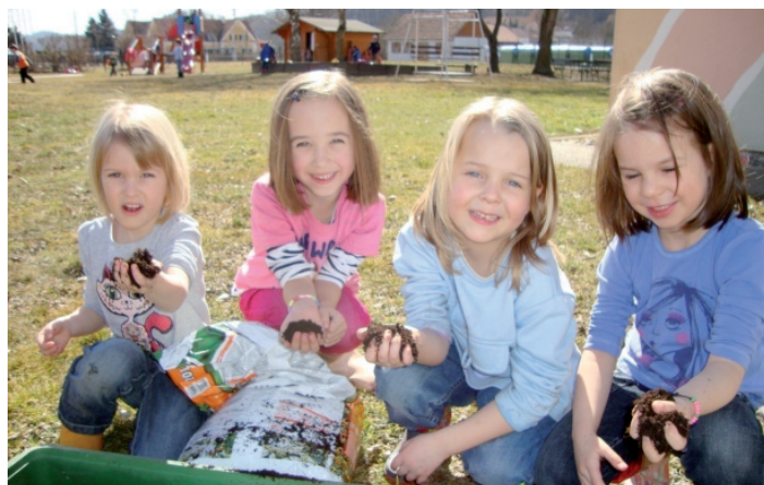
Fleißige Helferinnen beim Sähen

Der Frühling kehrt endlich ein und somit haben wir mit den Kindern Blumen angesät. Aber auch Karotten, Radieschen und Petersilie wurden in Töpfen und Kisten von den Kindern angebaut, in großer Hoffnung, dass wir vielleicht unser eigenes Gemüse irgendwann ernten und essen können.