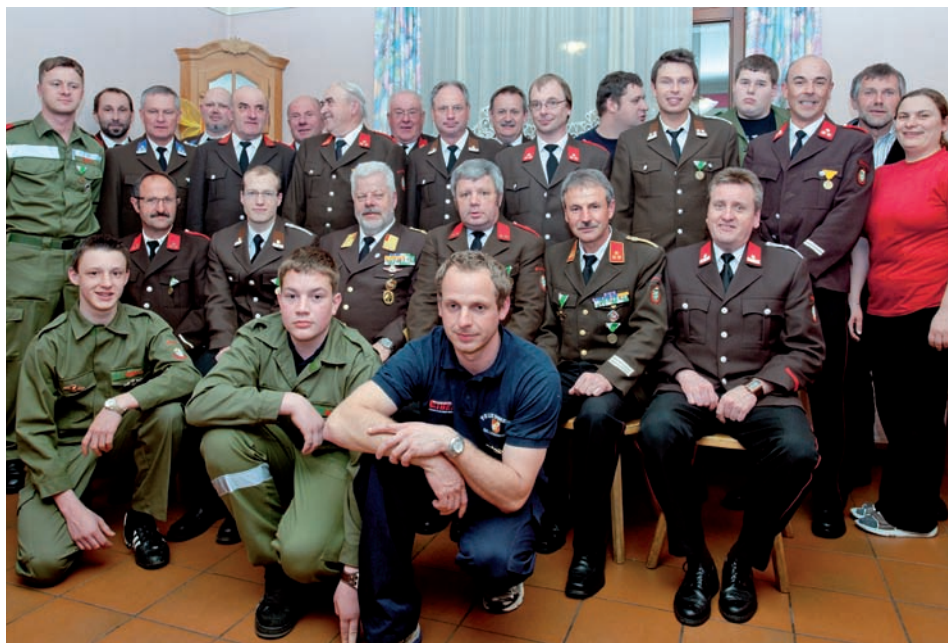
Gillersdorfer Feuerwehrkameraden mit Ehrengästen