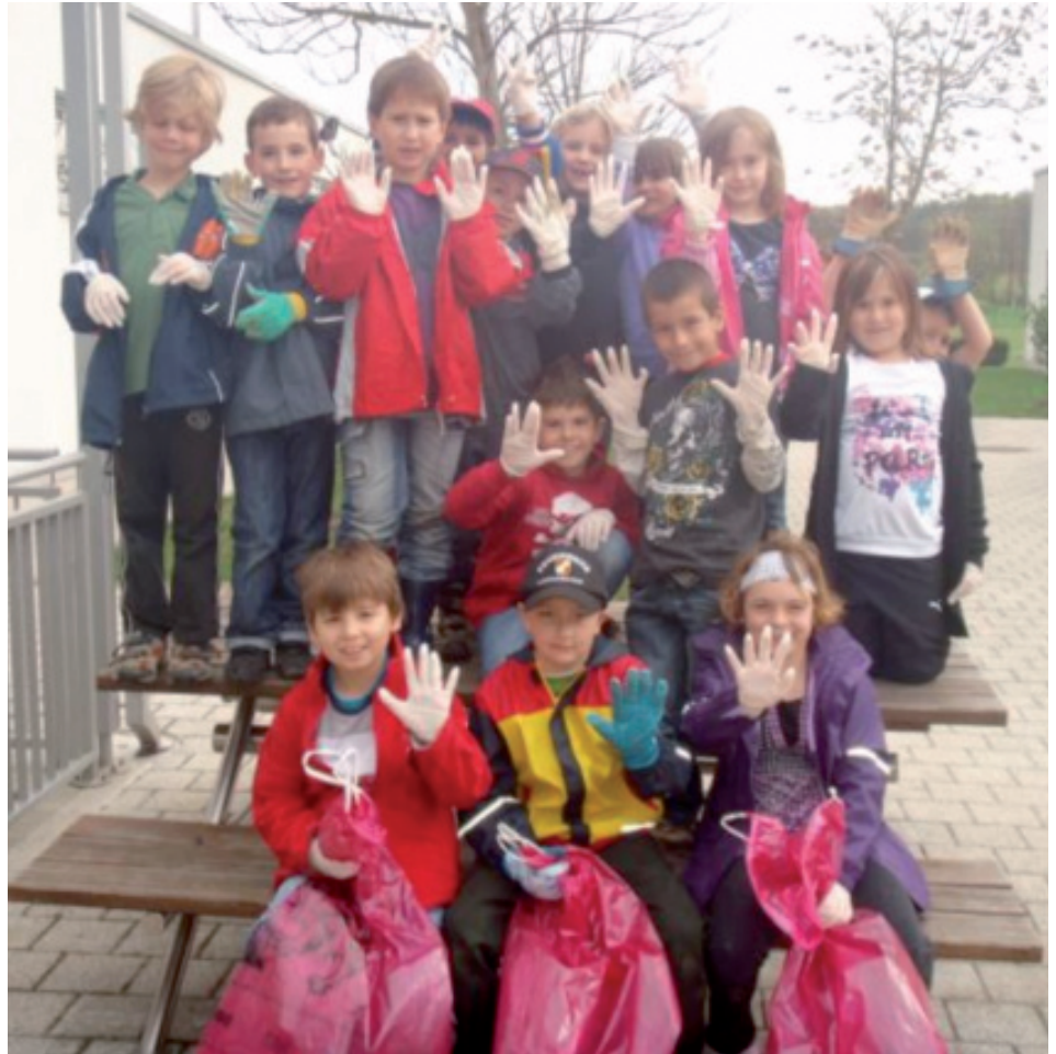
Brave Schulkinder nach der Müllsammlung