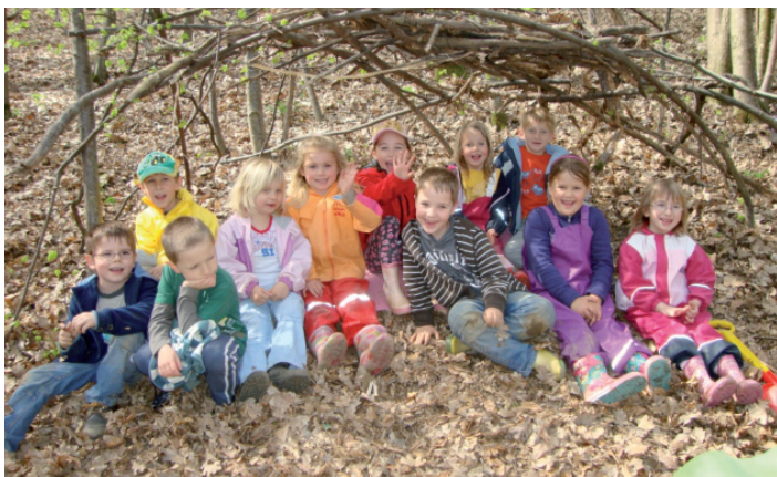
Eine selbst gemachte Höhle im Wald