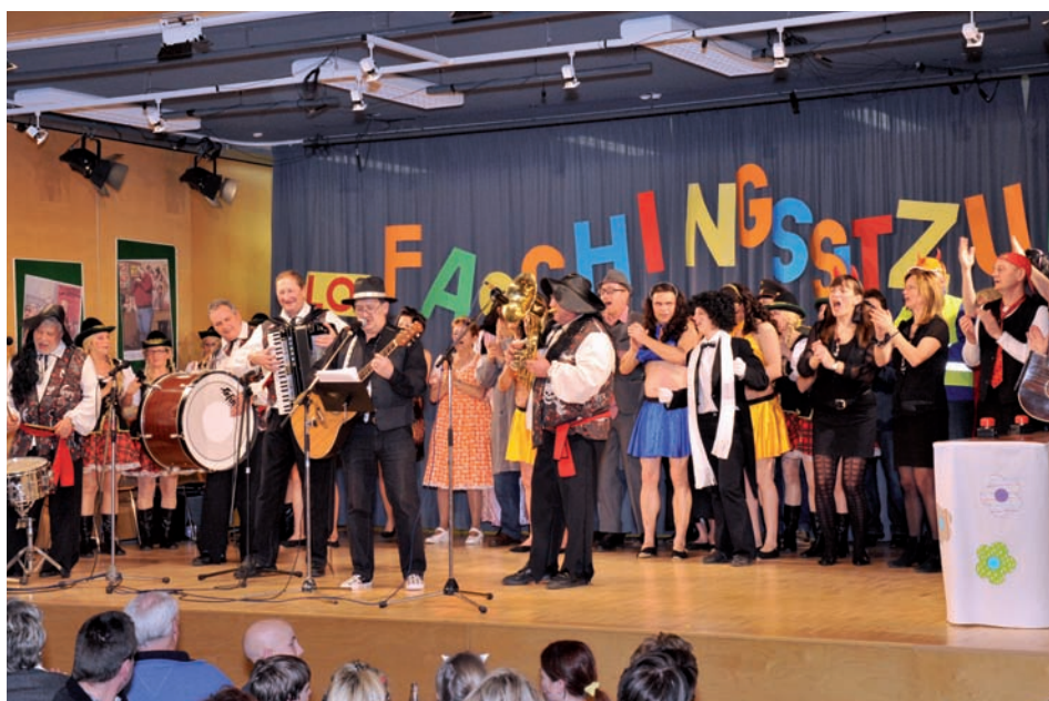
Hügelland Quintett mit Mitwirkenden