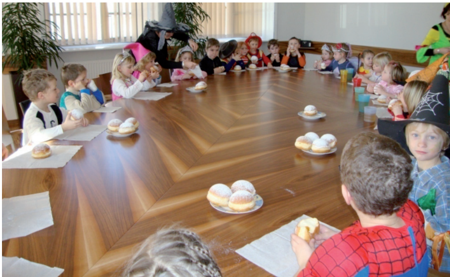
Kindergartenkinder im Gemeindeamt beim Bürgermeister