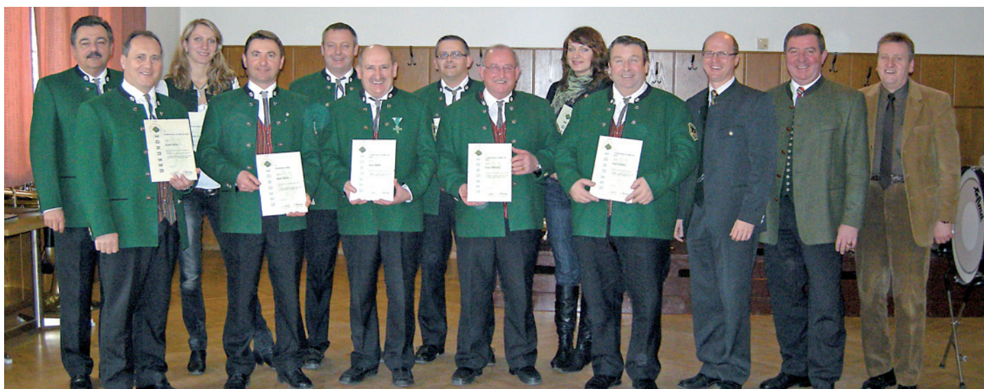
Ehrengäste mit den Ausgezeichneten Musikerinnen und Musiker