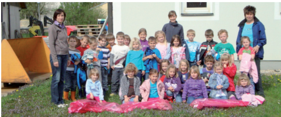
Kindergartenverantwortliche mit den fleißigen Kindern nach der Müllsammlung

Am 11. April haben auch wir fleißig beim Frühjahrsputz mitgeholfen und Müll gesammelt.