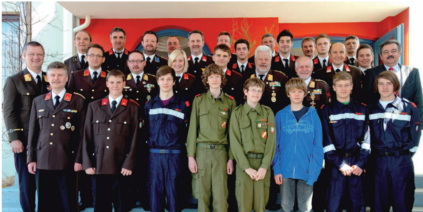
Gruppenfoto mit den Ehrengästen und den Ausgezeichneten