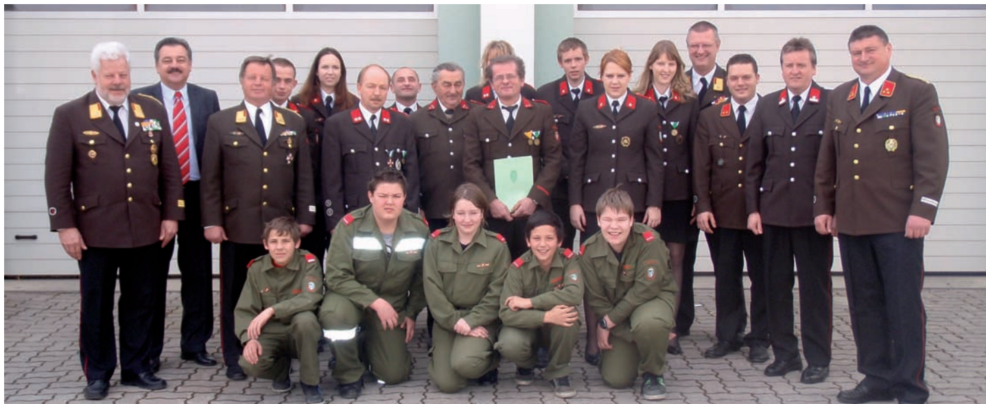
Gruppenfoto mit den Ausgezeichneten und Ehrengästen

Die FF Loipersdorf hielt kürzlich im Rüsthaus ihre diesjährige Wehrversammlung ab.