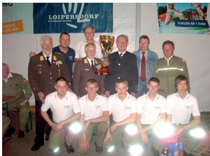
Ehrgäste mit den Gewinnern FF-Schützing