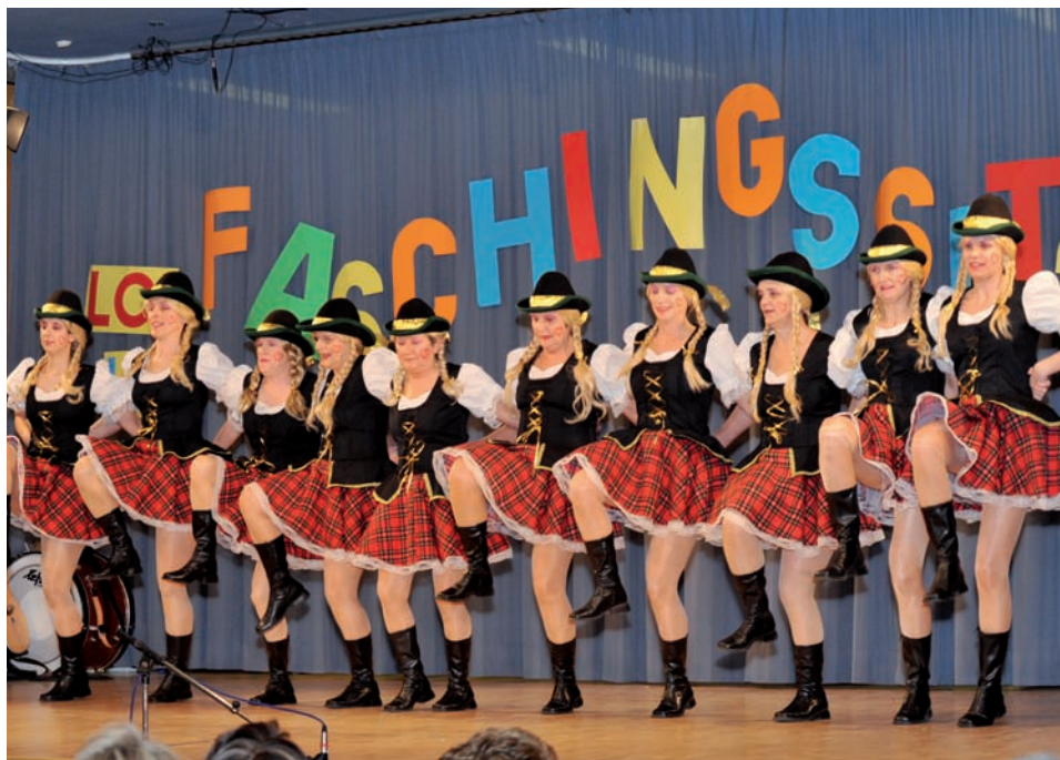
Damen der Volkstanzgruppe Loipersdorf