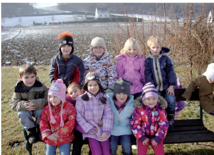
Spaziergänge auch zur kalten Jahreszeit

Am Faschingsdienstag durften die Kinder beliebig verkleidet in den Kindergarten kommen. Wir besuchten unser Gemeindeamt und unseren Herrn Bürgermeister. Wir bedanken uns nochmal recht herzlich für die dort bekommenen Krapfen und Getränke.