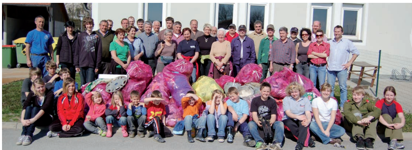
Viele fleißige Hände beim diesjährigen Frühjahrsputz

Die steiermärkische Landesregierung (FA 19 D) hat in sehr enger Zusammenarbeit mit den Gemeinden, den Abfallwirtschaftsverbänden,