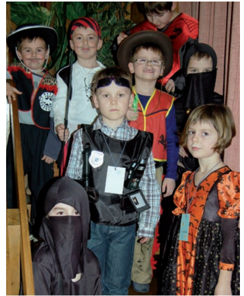
Kinder mit ihren Masken

gung Loipersdorf, bedankt sich auf diesem Wege bei all jenen Mitgliedern, die zum Gelingen dieser Veranstaltung beigetragen haben. Für die zur Verfügungstellung der Räumlichkeiten gebührt dem Gasthaus Jandl ein besonderer Dank.