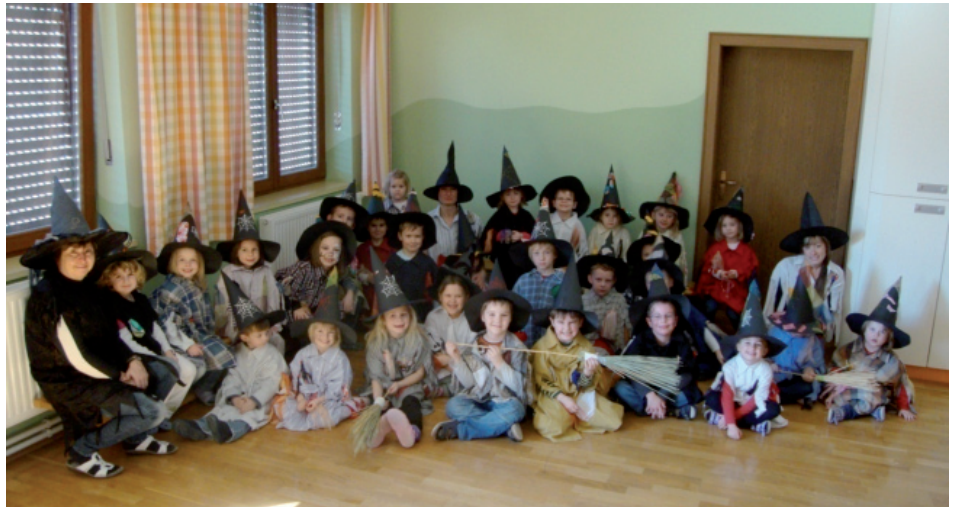
Kindergartenkinder als Hexen verkleidet

So feierten wir am Rosenmontag ein Hexenfest , mit unseren selbstgemachten Kostümen. Zur Jause gab es Krötensaft aus dem Hexenkessel, Hexensalat und danach gab es noch eine verzauberte Nachspeise. Neben Hexenliedern, Spielen und Tänzen verbrachten wir somit einen lustigen Tag im Reich der Hexen.