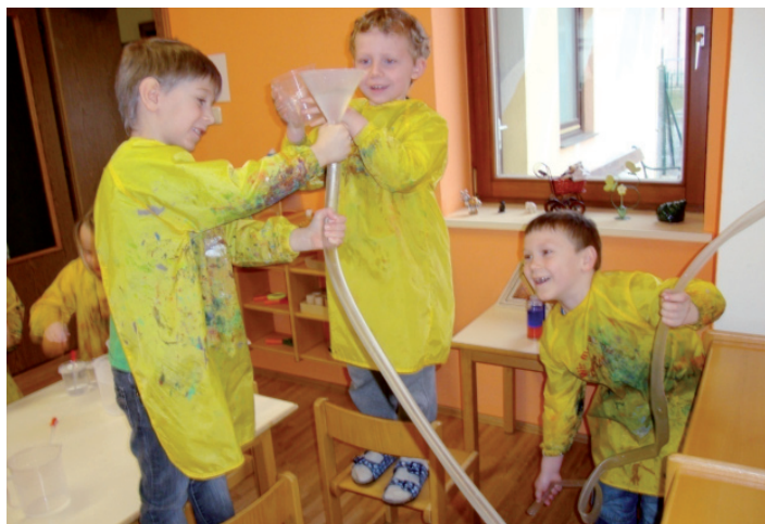
Fröhliche Kinder beim Experimentieren

Experimentieren mit Rasierschaum... das macht Spaß! In unserer neuen Forscherecke wird untersucht was man mit Wasser alles machen kann!