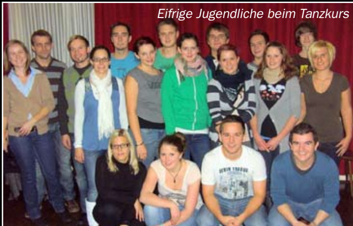
Eifrige Jugendliche beim Tanzkurs

mer aus Graz nahmen zahlreiche Paare daran teil. Die verschiedenen Tänze wurden mit großer Begeisterung von den teilnehmenden Paaren erlernt.