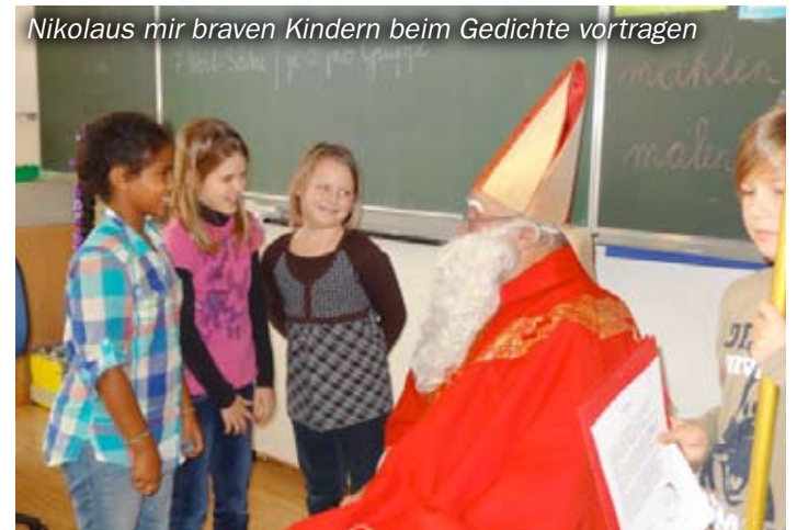
Nikolaus mir braven Kindern beim Gedichte vortragen

Mit großen Augen und etwas Herzklopfen wurde der Nikolaus mit seinem Krampus empfangen. Nachdem der Nikolaus die Kinder belehrte, ermahnte und reichlich lobte, verteilte er leckere Geschenke. Mit Gedichten, Liedern und Flötenklängen bedankten sich die Mädchen und Buben!