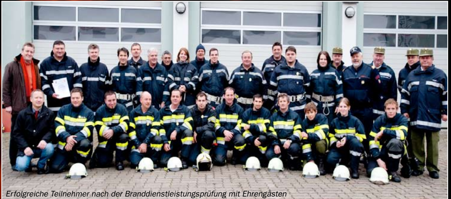
Erfolgreiche Teilnehmer nach der Branddienstleistungsprüfung mit Ehrengästen