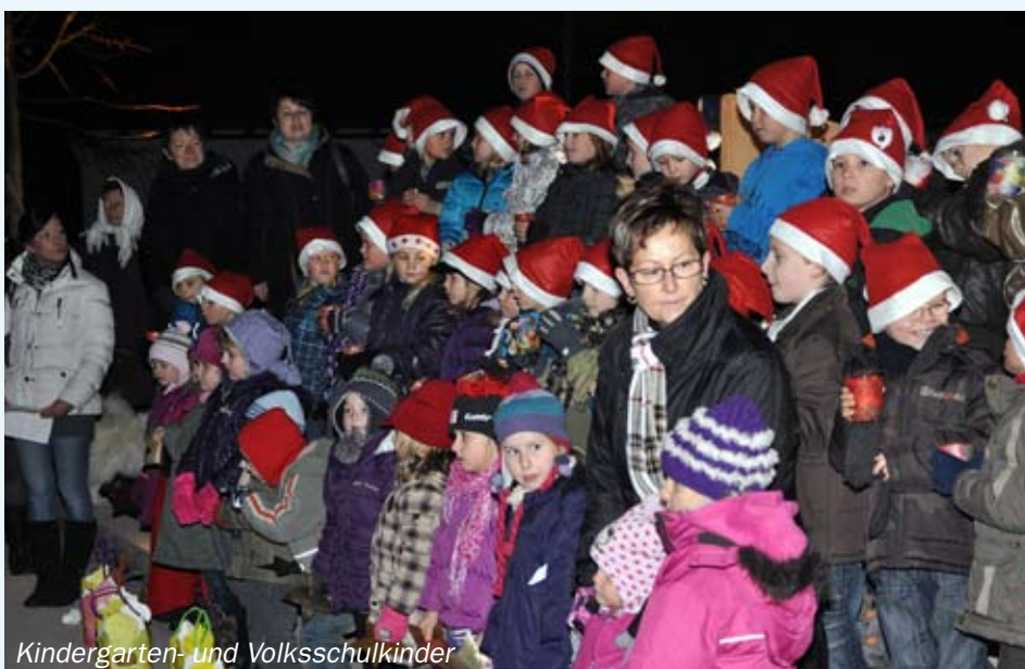
Kindergarten- und Volksschulkinder