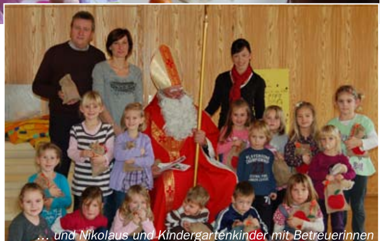
... und Nikolaus und Kindergartenkinder mit Betreuerinnen