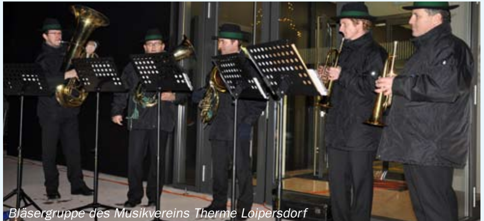
Bläsergruppe des Musikvereins Therme Loipersdorf

Wirtschaftshof, die den Weihnachtsbaum sehr liebevoll und gekonnt geschmückt haben. Wir, die ÖVP Loipersdorf möchte sich auf diesem Wege sehr herzlich bei all Jenen, die zum Gelingen dieser Veranstaltung beigetragen haben, bedanken.