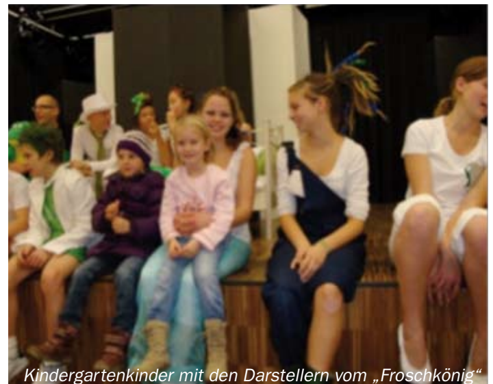
Kindergartenkinder mit den Darstellern vom „Froschkönig“

Am 25. November besuchten wir das Märchen „Froschkönig“