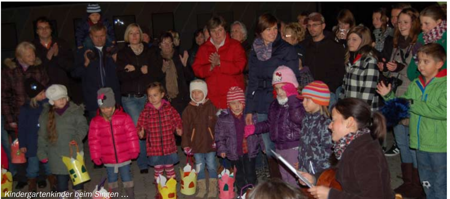
Kindergartenkinder beim Singen ...