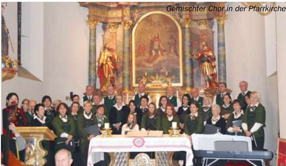
Gemischter Chor in der Pfarrkirche