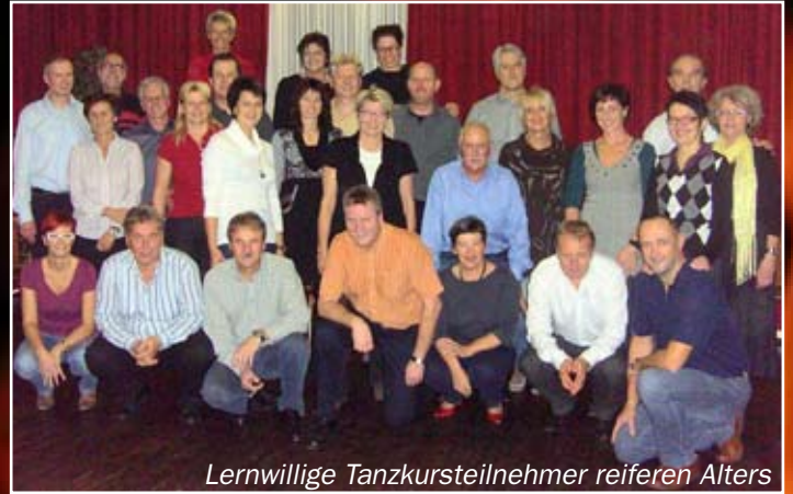
Lernwillige Tanzkursteilnehmer reiferen Alters