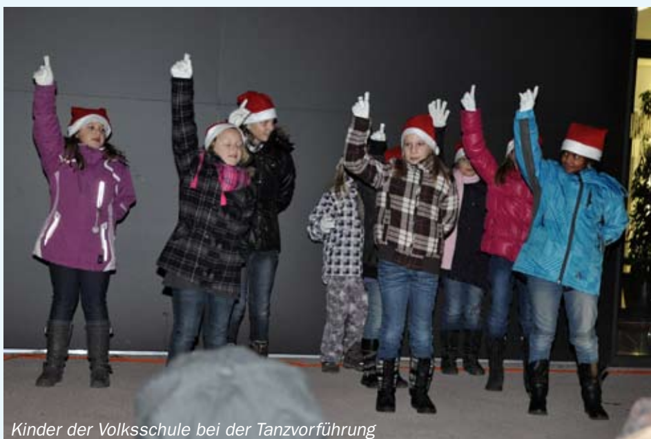
Kinder der Volksschule bei der Tanzvorführung