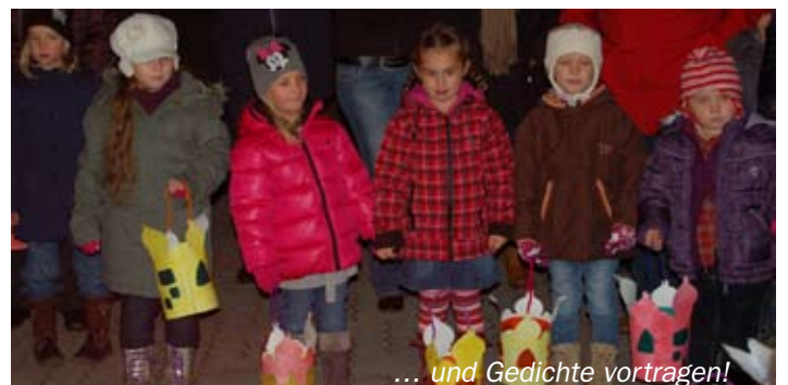
... und Gedichte vortragen!