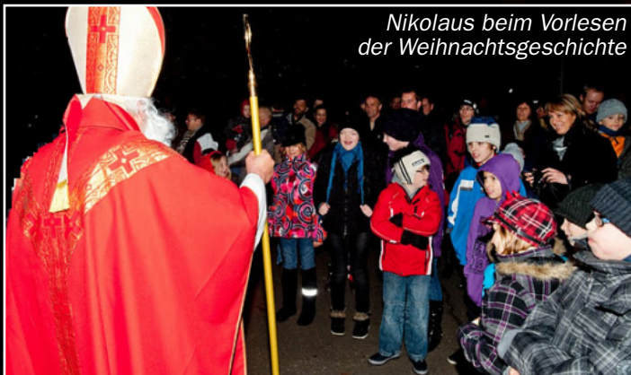
Nikolaus beim Vorlesen der Weihnachtsgeschichte

laus. Nach vorlesen einer Weihnachtsgeschichte verteilte der Nikolaus die Nikolosackerl.