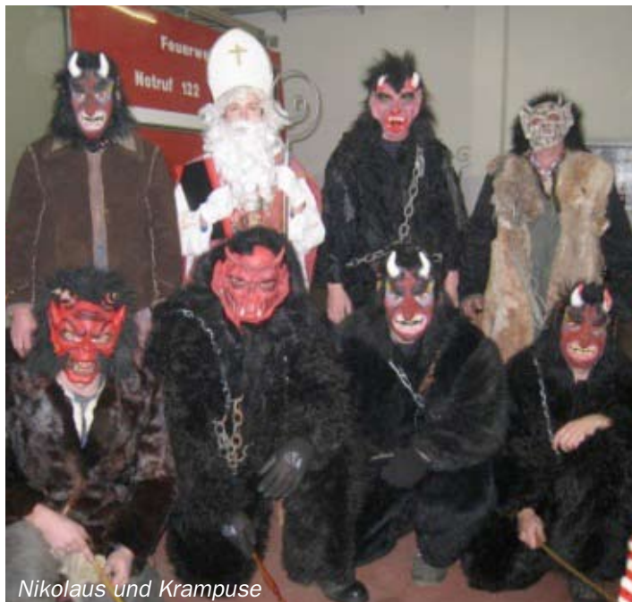
Nikolaus und Krampus