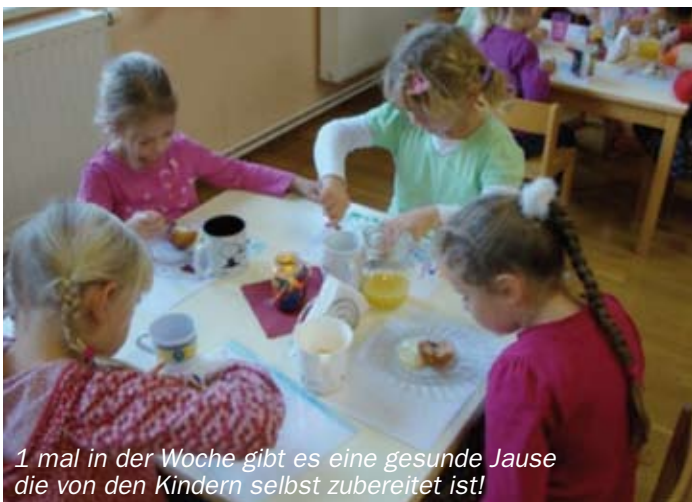
1 mal in der Woche gibt es eine gesunde Jause die von den Kindern selbst zubereitet ist!