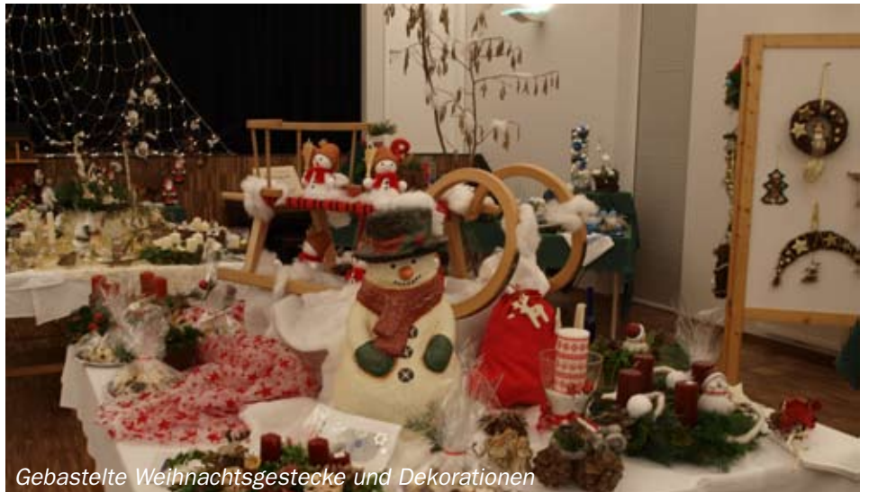
Gebastelte Weihnachtsgestecke und Dekorationen

Die zahlreich erschienenen Besucher konnten sich mit vorweihnachtlichen Dekorationen – die von den Mitgliedern der Frauenbewegung in ihrer Freizeit gebastelt bzw. angefertigt wurden – wie Adventkränze, Gestecke, verschiedene Basteleien und Handarbeiten , sowie mit Kaffee und Mehlspeisen , auf die Adventzeit einstimmen.