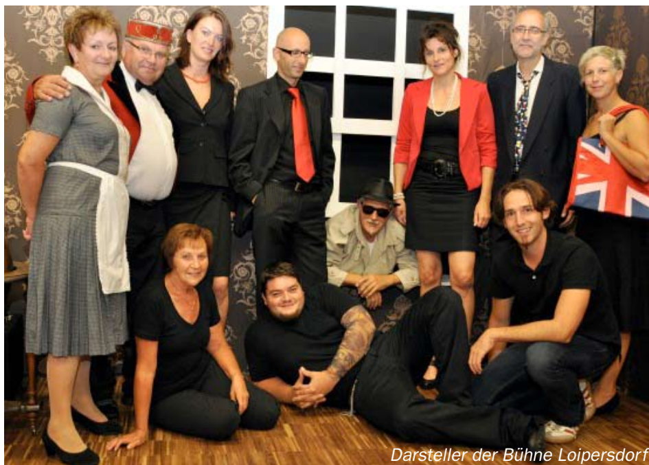
Darsteller der Bühne Loipersdorf