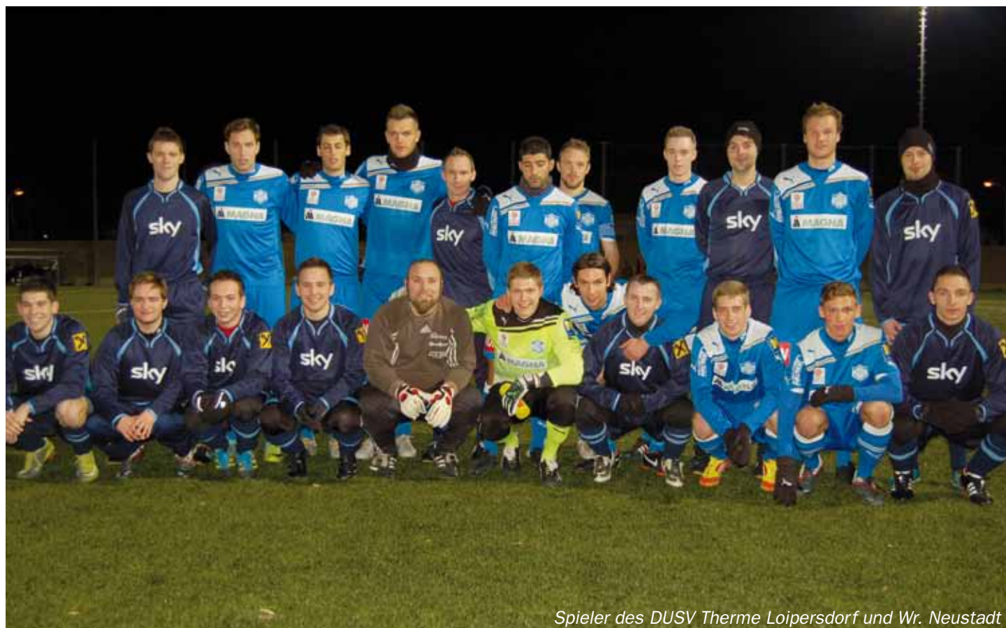
Spieler des DUSV Therme Loipersdorf und Wr. Neustadt