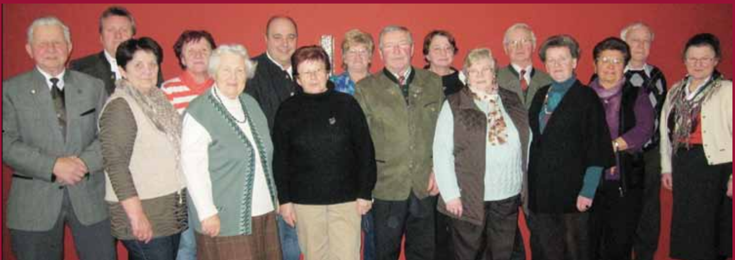
Ausschussmitglieder des Seniorenbundes Loipersdorf/Stein mit Ehrengästen