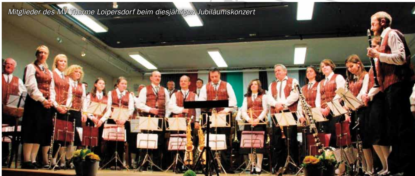
Mitglieder des MV Therme Loipersdorf beim diesjährigen Jubiläumskonzert