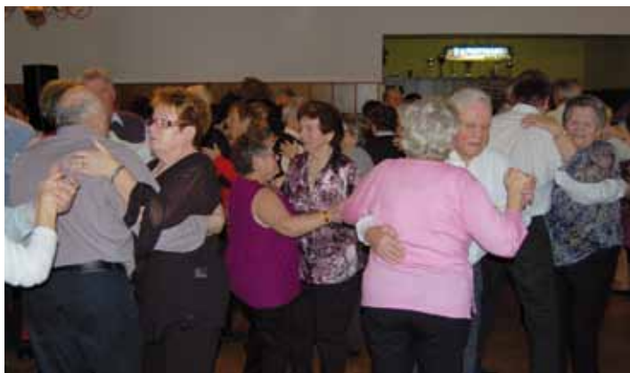
Begeisterte Senioren schwingen das Tanzbein

Die ÖVP Loipersdorf bedankt sich bei den Verantwortlichen des Seniorenbundes für die Organisation und Durchführung dieser Veranstaltung, welche für unsere Gemeinde alljährlich eine Bereicherung ist.