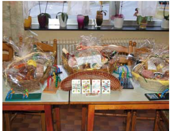
Die wertvollen Warenpreise