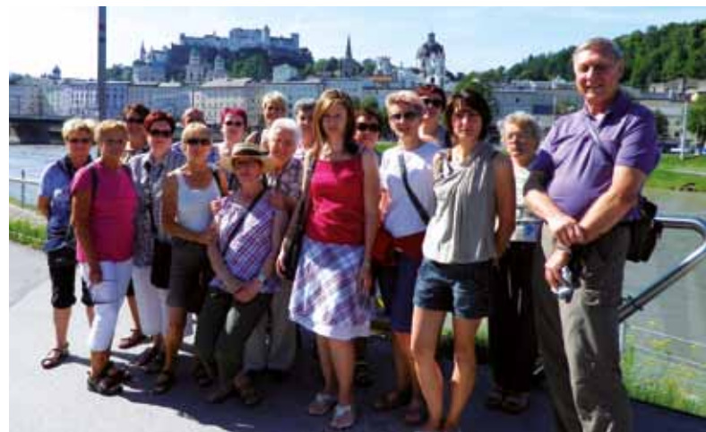
TeilnehmerInnen beim diesjährigen Ausflug