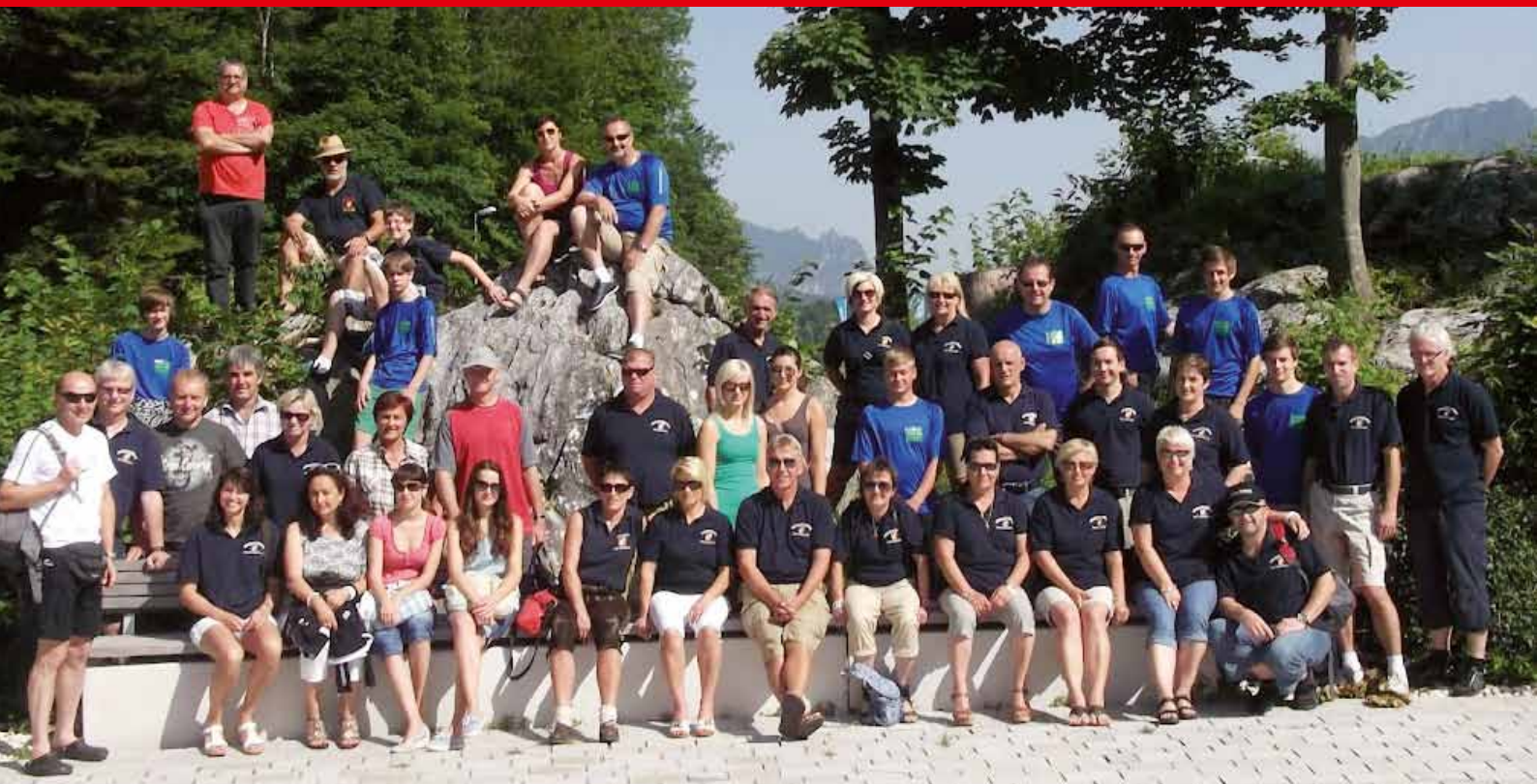
HBI Stürzer und ABI Pfingstl sowie Teilnehmer des diesjährigen Feuerwehrausfluges

Nach drei Jahren Pause führte die FF-Dietersdorf wieder einen Feuerwehrausflug mit 43 Teilnehmern durch. Vom Samstag den 30. Juni bis Sonntag den 1. Juli fuhren wir zum Königssee nach Bayern. Mit den geräuschlosen Elektrobooten ging es zur Halbinsel St. Bartholomä, wo wir das Jagdschloss und die Kirche St. Bartholomä besichtigten. Nach einem deftigen Mittagessen im Brauhaus Berchtesgaden ging es weiter zum