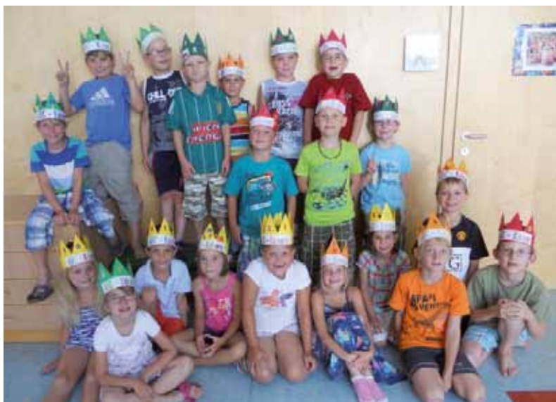
Schüler der Volksschule Loipersdorf