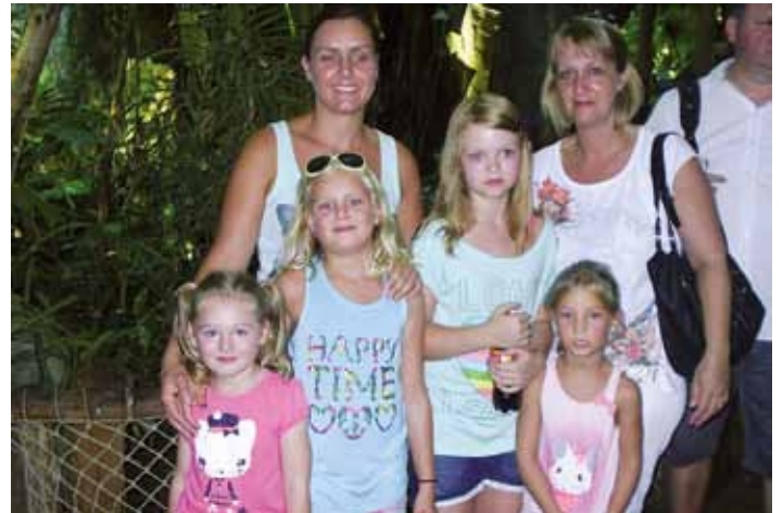
Begeisterte Kinder mit Muttis.

Auch 2013 wird es wieder eine Kinderfahrt geben.