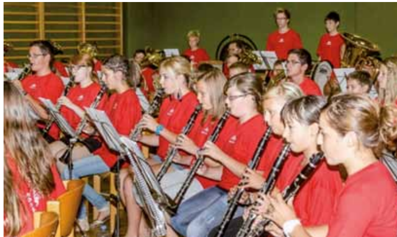
MusikerInnen beim Musizieren

Wir erspielten uns nach hartem Kampf die sensationellen Plätze 1 und 3. Es war wie immer a „vulle gaude“! Danke an alle, die mitmachten!