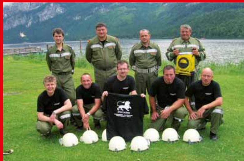
Bewerbsteilnehmer von der FF Loipersdorf

Bedanken möchten wir uns auch bei der Fa. Spritkönig, die uns Bewerbungsbleichen gesponsert hat.