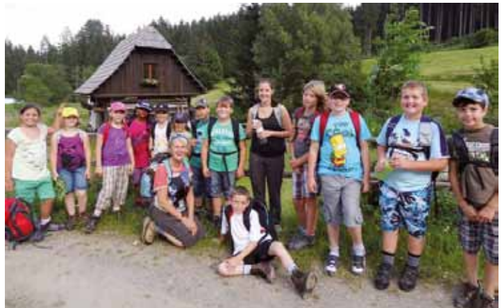
SchülerInnen der 4. Klasse