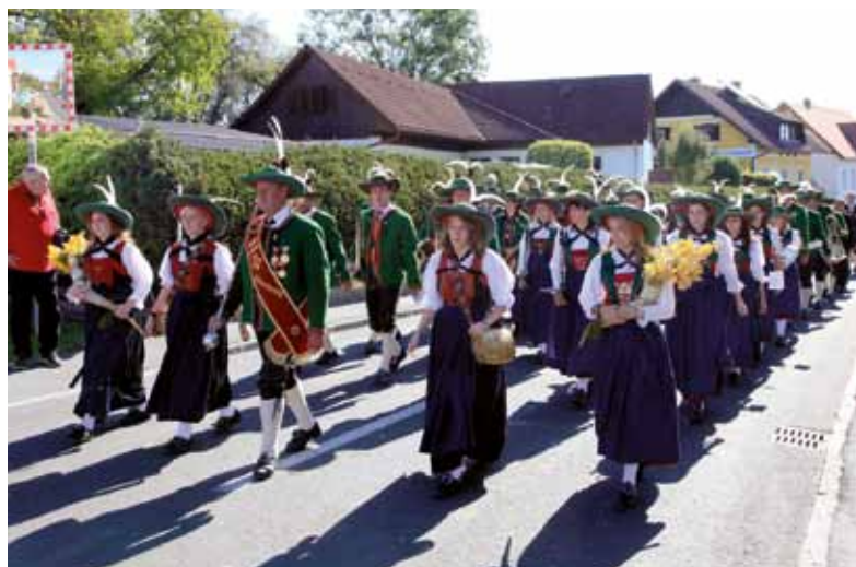
Musikkapelle Wildermieming (Tirol)