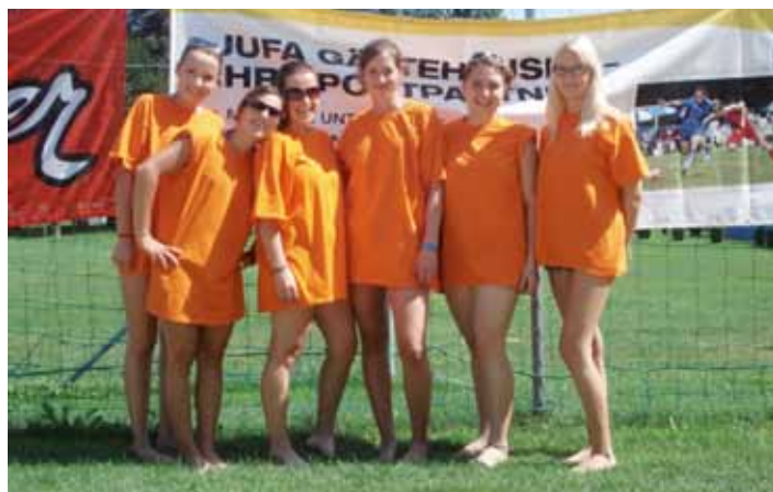
Das siegreichen Loipersdorferinnen