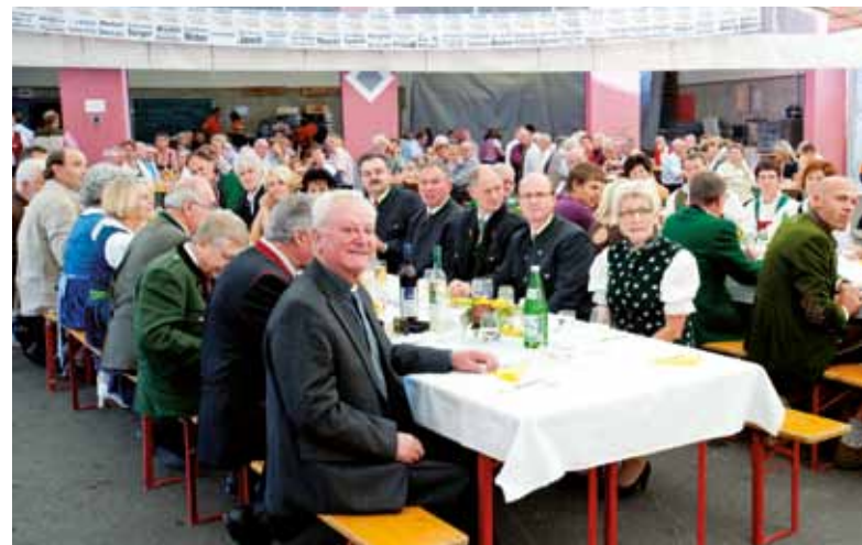
Ehrengäste und BesucherInnen

Der Musikverein möchte sich auf diesem Wege nochmals bei allen Sponsoren, Helfern und den Gemeindebewohnern für die tolle Unterstützung bedanken!