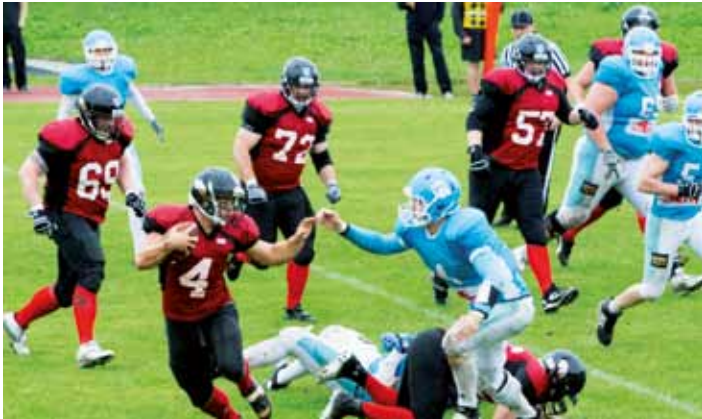
Die Footballer in Aktion