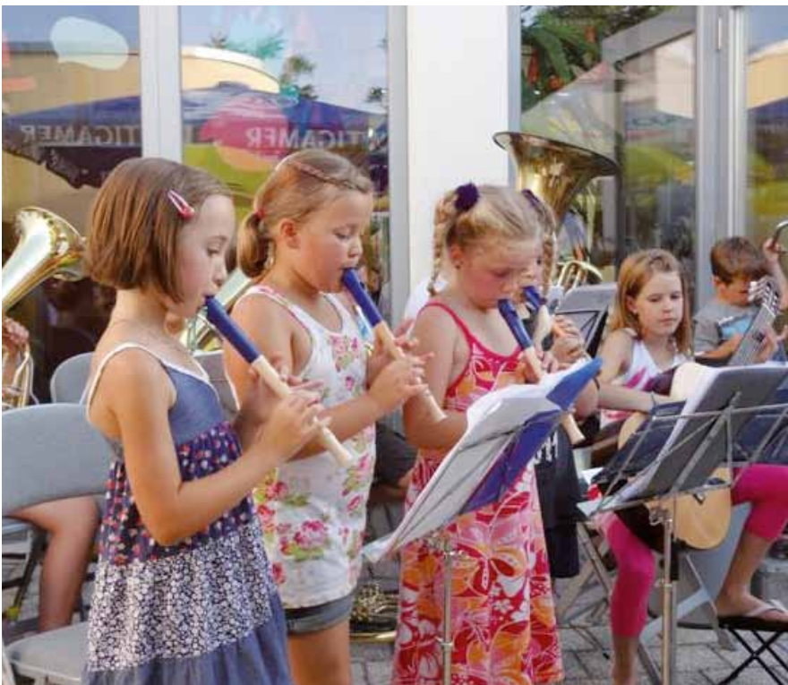
Die Kinder der Big-Band beim Musizieren