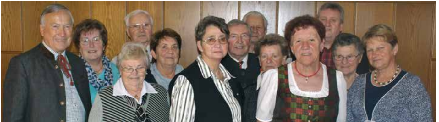
Neuer und alter Vorstand des Seniorenbundes mit Ehrengästen