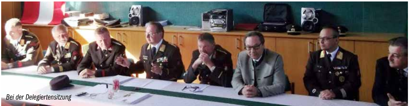
Bei der Delegiertensitzung

Nach dem Festakt sorgte der Musikverein Thermo Loipersdorf für ausgezeichnete Stimmung. Das Kommando der FF Dietersdorf bedankt sich auf diesem Weg für den zahlreichen Besuch bei der Ortsbevölkerung.