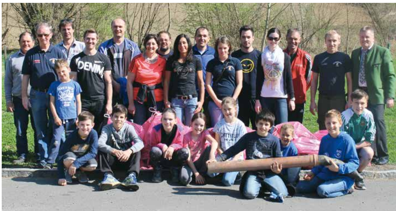
Die Frühjahrsputzteilnehmer aus Stein