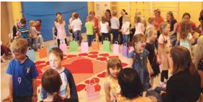
Kinder beim Gedicht aufsagen und Lied singen

Nachdem Gedicht und Lied dargeboten und die Geschenke verteilt wurden, konnten die Kids mit ihren Mamas verschiedene Stationen besuchen. Währenddessen konnte immer eine kleine Pause am Kaffee- und Kuchenbuffet eingelegt werden. Es war ein ganz toller Vormittag, den die Kinder und vor allem auch die Mamas in unserem Haus genossen hatten.