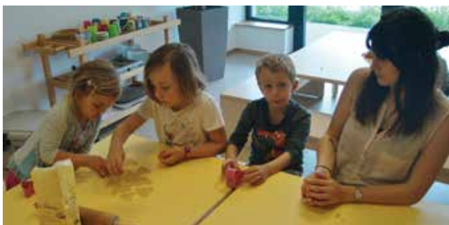
Ganztageskinder beim Kekse backen

Auch bei den Ganztageskindern gibt es immer wieder tolle Aktivitäten zu beobachten. Es wird gekocht und gebacken, gebastelt und gemalt, sowie die Natur mit allen Sinnen wahrgenommen und erforscht.