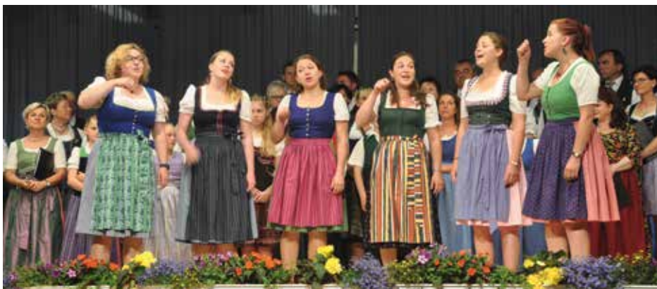
Chornissen im Einsatz