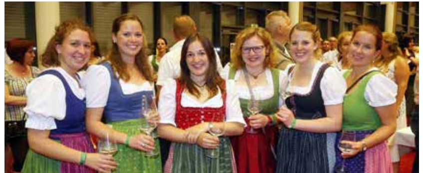
Auch die Chornissen ließen sich nach ihrem Auftritt ein Gläschen Wein schmecken.