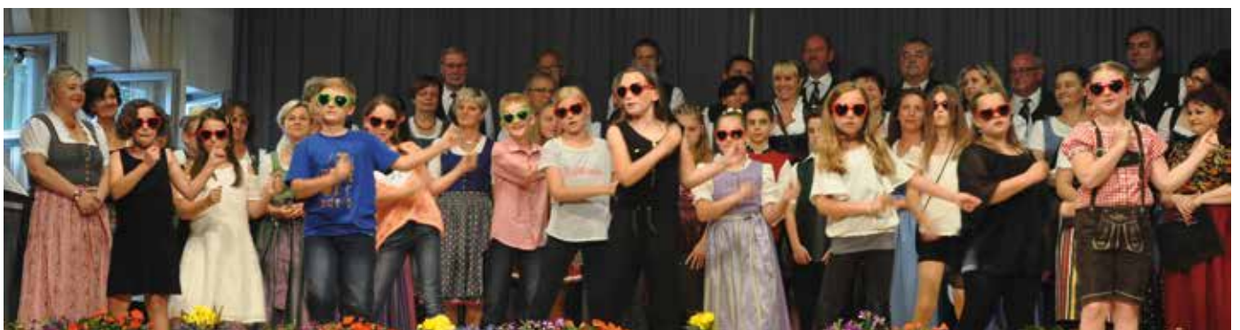
Die Kinder der Volksschule Loipersdorf