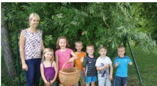
Holunderblüten sammeln - es wurde ein leckerer Holundersirup gemacht.