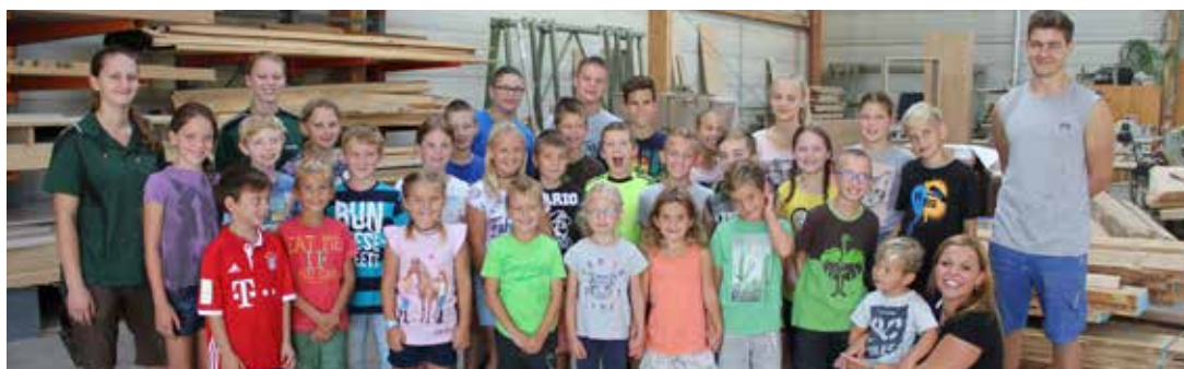
29 Kinder waren in der Tischlerei Edelmann im Einsatz und durften eine Willkommenstafel für die Haustür mit Familiennamen gestalten.