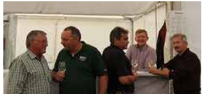
ÖKB-Mitglieder beim Fachsimpeln