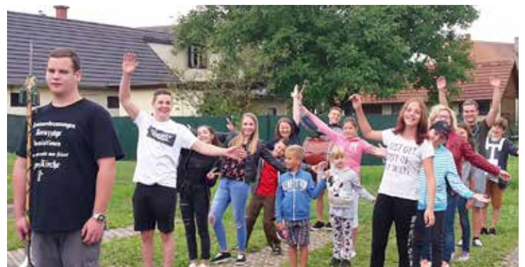
Die Mitglieder des Musikvereines Loipersdorf versuchten den Kindern das „richtige marschieren“ beizubringen.