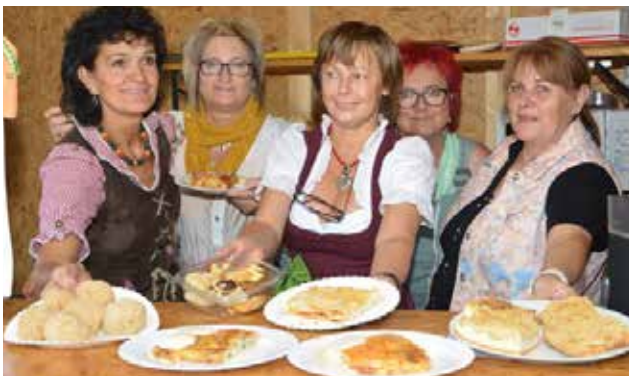
Die Frauenbewegung Stein servierte süße Köstlichkeiten.