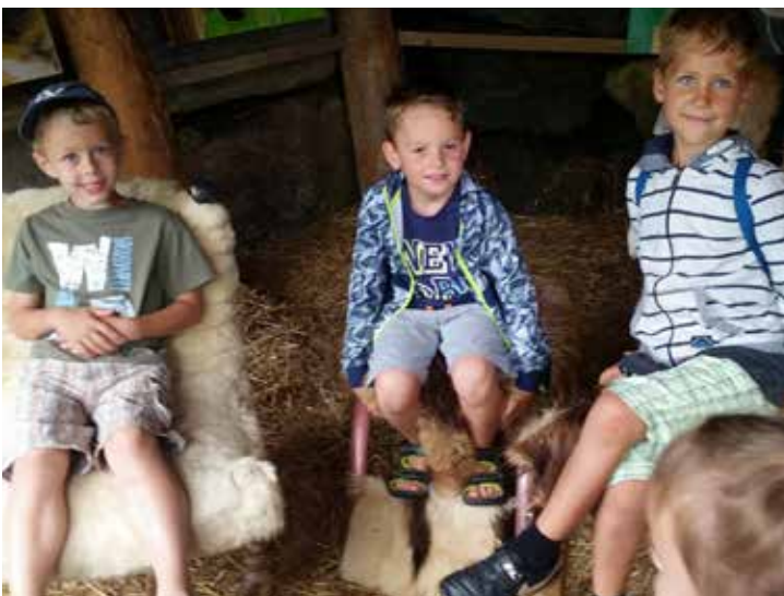
Bei einer kurzen Rast

wohnen auf dem Gelände und man kann sie aus nächster Nähe beobachten. Wasserspiele und ein Motorikpark befinden sich ebenso auf dem Areal. Nach einer gemütlichen Mittagspause und einem Rundgang durch das gesamte Gelände, machten wir uns - müde und erschöpft - mit dem Bus wieder auf den Heimweg. Wir hoffen, dass alle Familien einen schönen Tag dort verbringen konnten.