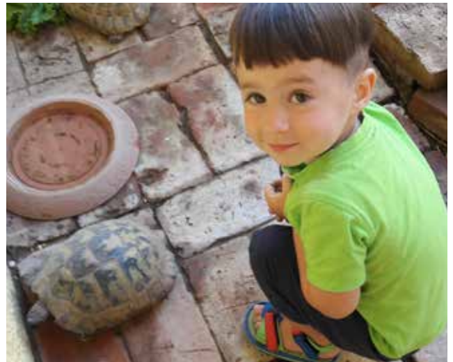
Zu Besuch bei den Schildkröten

Im Anschluss gab es noch Pizza und Eis für die Kinder und ein Spieleparadies mit Dosen schießen und vielem mehr im Garten. Danke für den tollen Ausflug und die Einladung!