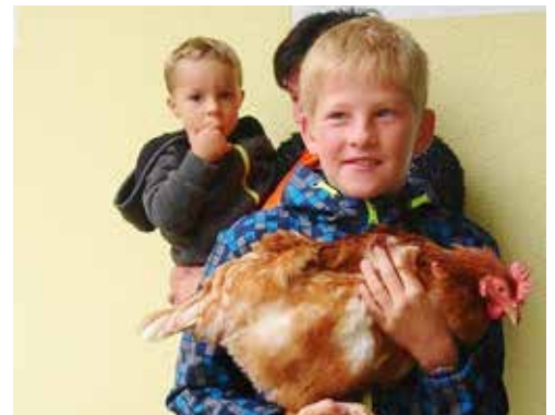
Beim Betrieb „Höllerl's Freilandeier“ konnten die Kinder die Eierproduktion hautnah erleben.