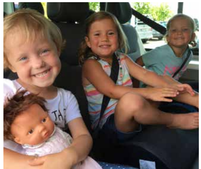
Auf der Heimfahrt