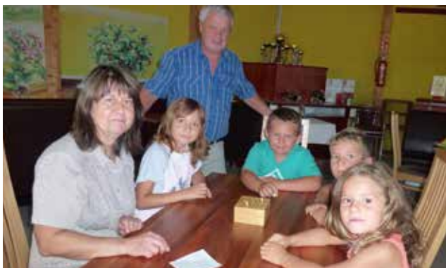
Bei traditionellen Spielen hatten die Kinder beim Freizeit-, Kultur- und Traditionsverein Loipersdorf viel Spaß.