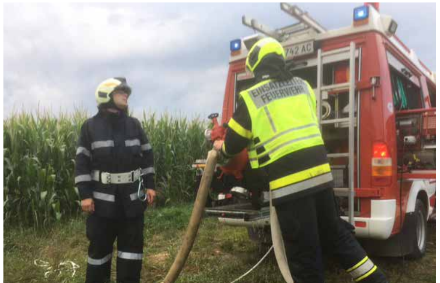
Wasserversorgung zur TS 12