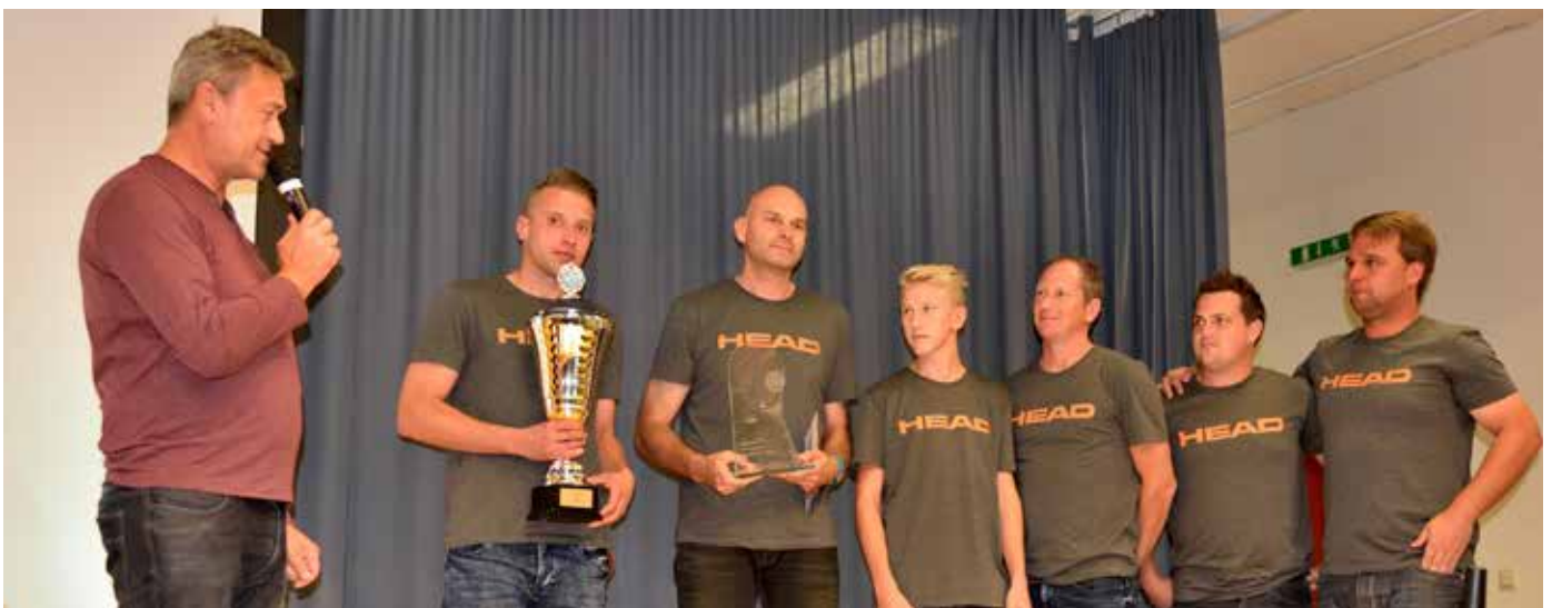
Die Siegermannschaft des TC Union Schwabau

Beim abschließenden Festakt im Mehrzwecksaal, bei dem die Siegerteams geehrt wurden, waren schließlich 62 Mannschaften dabei.