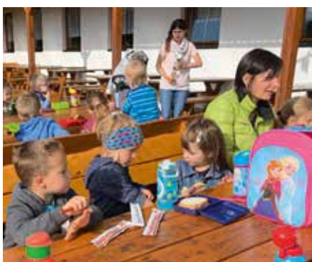
Wohlverdiente Jause bei herrlichem Wetter.