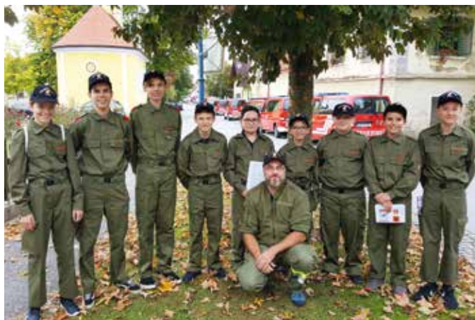
Die Teilnehmer der FF Stein beim Wissensquiz.

Am 5. Oktober 2019 fand der Wissenstest der Feuerwehrjugend in Großhartmannsdorf statt. Die Feuerwehr Stein nahm mit neun Jugendlichen erfolgreich daran teil.