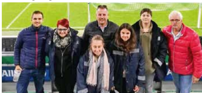
Die Fußballfans der FF Dietersdorf waren begeistert vom Bundesligaspiel.

Der Bundesligaklub Rapid Wien lud die steirischen Feuerwehren zu einem Heimspiel in das Allianz Stadion in Wien Hütteldorf ein. Eine Gruppe der FF Dietersdorf folgte der Einladung zum Spitzenspiel der Runde gegen den Wolfsberger AC. Natürlich durfte ein Besuch im Wiener Prater für die Jungen und Junggebliebenen nicht fehlen. Insgesamt waren 3.000 Feuerwehrmänner/frauen der Einladung ins Stadion gefolgt.