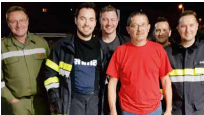
Die Teilnehmer der FF Stein bei der Großübung

Die Abschnittsübung der Abschnitte 1 und 4 fand am 25. Oktober 2019 bei der Firma Secop in Fürstenfeld statt. Insgesamt nahmen 15 Feuerwehren mit 34 Fahrzeugen und 154 Mann daran teil. Die Feuerwehr Stein war mit acht Mann dabei.