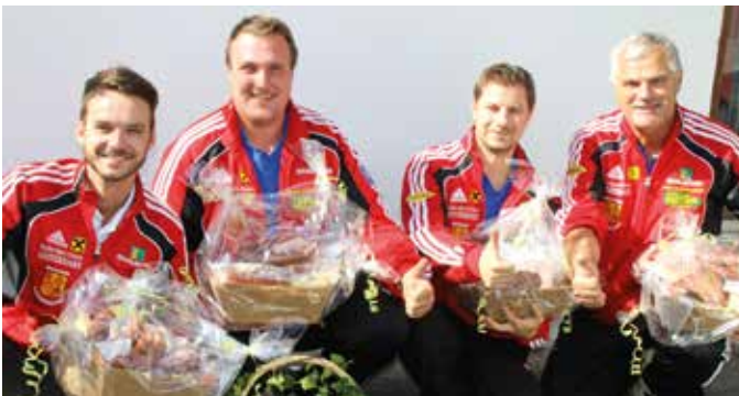
Die Sieger am Vormittag kamen aus Leitersdorf.

Der ESV Therme Loipersdorf bedankt sich bei allen Sportlern, Preisspendern, dem ESV Neumarkt/Raab für die Benützung der Sportanlage und hofft für das nächste Jahr wieder so viele Mannschaften und Fans begrüßen zu dürfen.