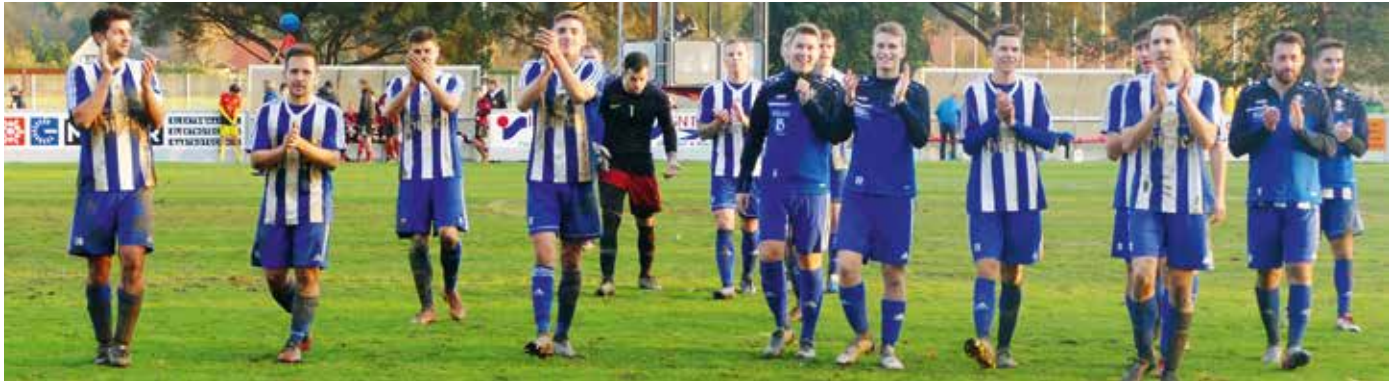
Großer Jubel bei den Spielern und den vielen Zuseher nach dem Sieg gegen Fürstenfeld II.

gewonnen wurde, liegt die Mannschaft auf dem siebenten Platz, nur drei Punkte hinter dem Zweitplatzierten Straden und nur vier Punkte hinter Tabellenführer Klöch.