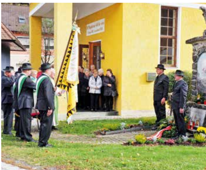
Kranzniederlegung vor dem Kriegerdenkmal in Stein.