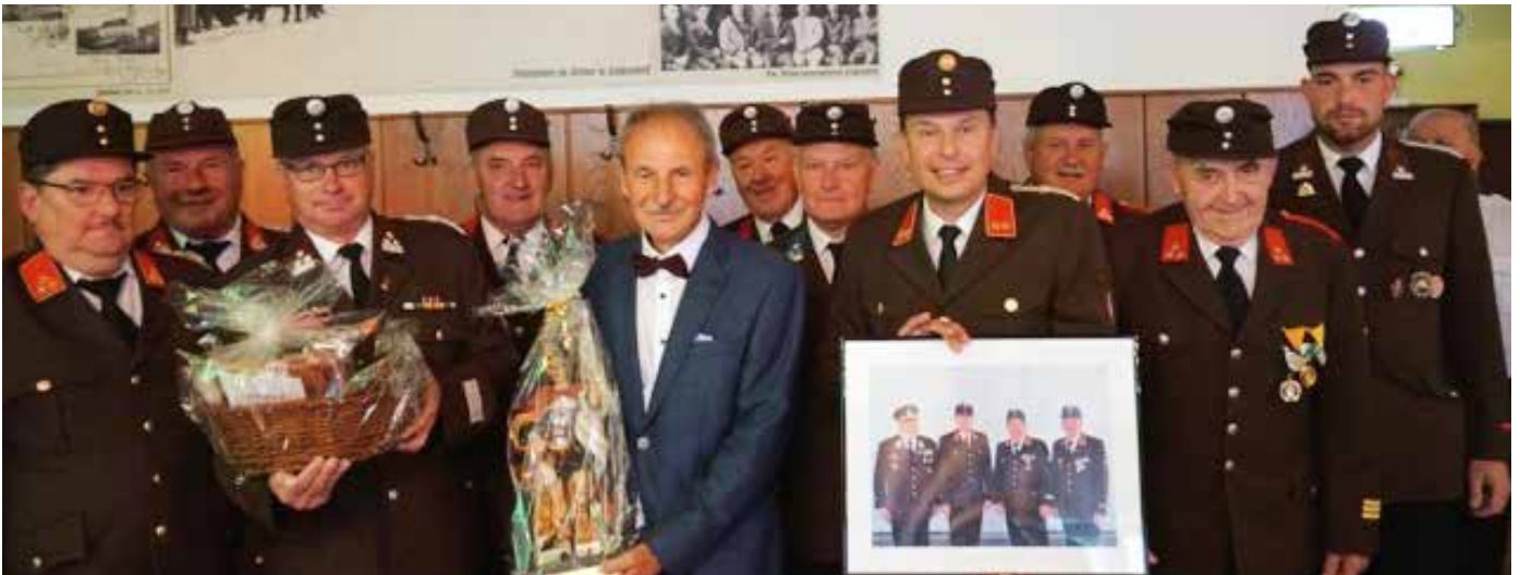
Die Feuerwehrkameraden überreichten Geschenke an den Jubilar.

Dafür möchte ihm die gesamte Belegschaft der FF Gillersdorf nochmals danken und seine Kameraden freuen sich auf viele weitere gemeinsame Jahre.