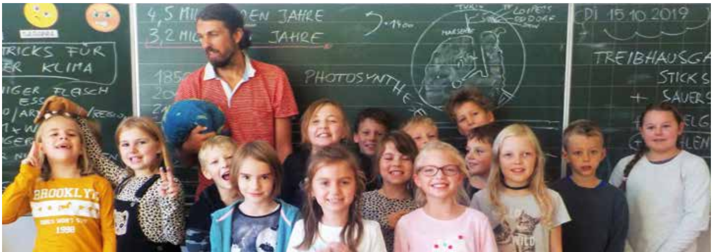
Klimaschutz wird auch in der VS Loipersdorf großgeschrieben.

Besonders spannend erlebten die Kinder die durchgeführten Experimente und Spiele, an denen sie sich auch aktiv beteiligen durften. Mit vielen lebensnahen Beispielen konnte in den Kindern das Bewusstsein geweckt werden, dass jeder einzelne von ihnen mit einer bewussten Lebensweise zur Verbesserung bzw. Erhaltung einer gesunden Umwelt beitragen kann. Die Kinder der VS Loipersdorf waren von dem interessanten Vormittag begeistert und möchten sich auch in Zukunft für den Klimaschutz einsetzen.