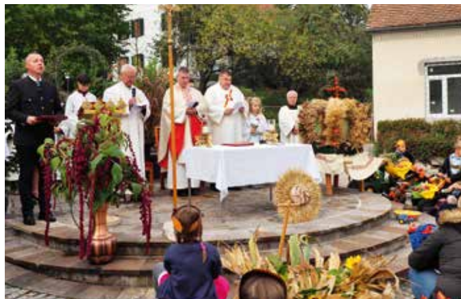
Die hohe Geistlichkeit bei der Hlg. Messe.