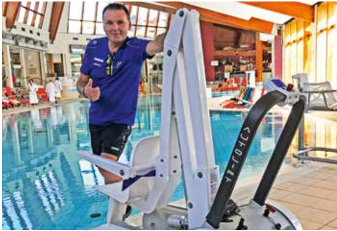
Mobiler Behinderternlift überall einsetzbar

Am 8. Oktober 2019 wurde ein neuer Behinderternlift ins Thermenbad geliefert. Der Vorteil zum alten Lift: Er ist mobil und kann überall eingesetzt werden.