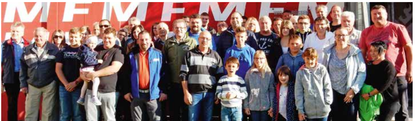
Eine große Anzahl an Feuerwehrmitgliedern beteiligte sich am Ausflug.

Am 21. September 2019 starteten die Mitglieder der FF Loipersdorf um 7 Uhr 30 Uhr, nach längerer Pause, wieder einmal zu einem Feuerwehrausflug. Die erste Station war die Besichtigung des FW-Museums in Groß St. Florian. Danach ging die Reise weiter nach Maribor. Nach dem Mittagessen wurde die Stadt in einem Touristenzug besichtigt. Anschlie-