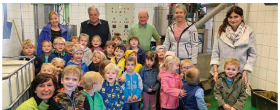
Es war ein sehr interessanter Besuch bei der Ölmühle Papst.