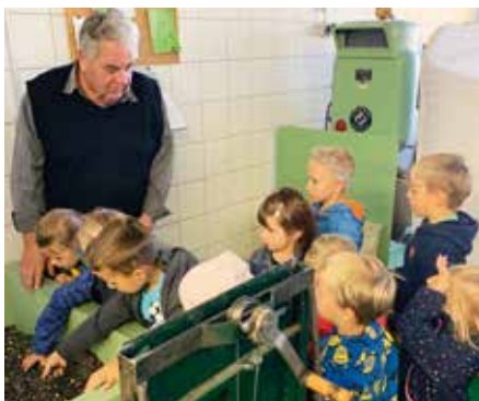
Die Verarbeitung der Kürbiskerne wird beobachtet.

Zum Schluss erfolgte eine Verkostung des frisch gepressten Kernöles. Bevor sich wieder alle auf den Rückweg machten, stärkte man sich beim Buschenschank Papst mit der Jause, damit alle voller neuer Energie wieder in den Kindergarten marschieren konnten.