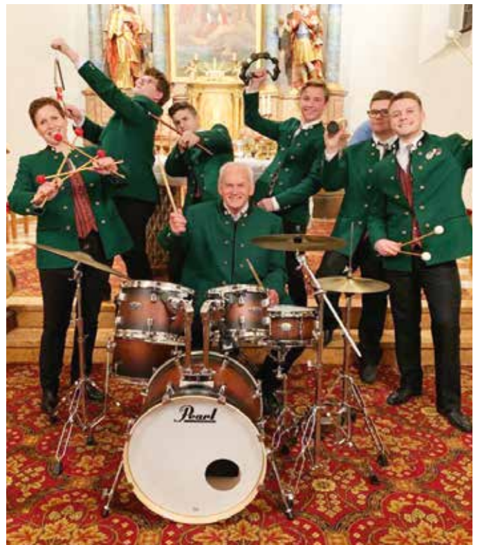
Große Begeisterung herrscht über die Anschaffung von neuem Schlagwerk.

Abgesehen davon, nahm es uns Schlagzeugern die Motivation zum Spielen. Somit verlor nicht nur der Klang der Schlaginstrumente an Qualität, sondern auch der Klang des Gesamtorchesters musste darunter leiden. Die Investition hat es uns ermöglicht, fehlende Ausstattung anzuschaffen und, soweit möglich, beschädigte und veraltete Instrumente zu restaurieren. Das neue Drum-Set, und besonders die Anschaffung der dritten Pauke, hat das Spielen beträchtlich vereinfacht. Weiters hat sich die Klangqualität dadurch um ein Vielfaches erhöht, und abgesehen davon, wird es Neueinsteigern mehr Motivation und Freude am Musizieren bereiten.