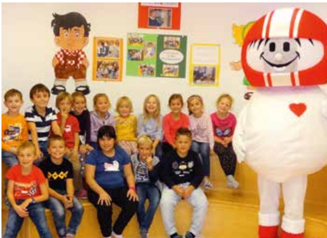
Gruppenfoto mit HELMI

Am 3. Oktober 2019 fand für die Schüler der 1. und 2. Klasse der vom Kuratorium für Verkehrssicherheit organisierte HELMI - Aktionstag statt. In informativer und kindgerechter Art und Weise wurden die Kinder für mögliche Gefahren im Straßenverkehr sensibilisiert. Das durchgeführte Experiment, das ihnen in anschaulicher Weise im abgedunkelten Raum mit einer Taschenlampe verdeutlichte, wie wichtig reflektierende Kleidungsstücke im Straßenverkehr sind, fand großen Anklang. Auch das wichtige Thema „Angurten im Auto“ wurde besprochen und gleich wieder in einem Versuch dargestellt. Die Freude bei den Kindern war dann natürlich groß, als HELMI bei der Tür hereinkam und sich zu einem Erinnerungsfoto zu ihnen gesellte.