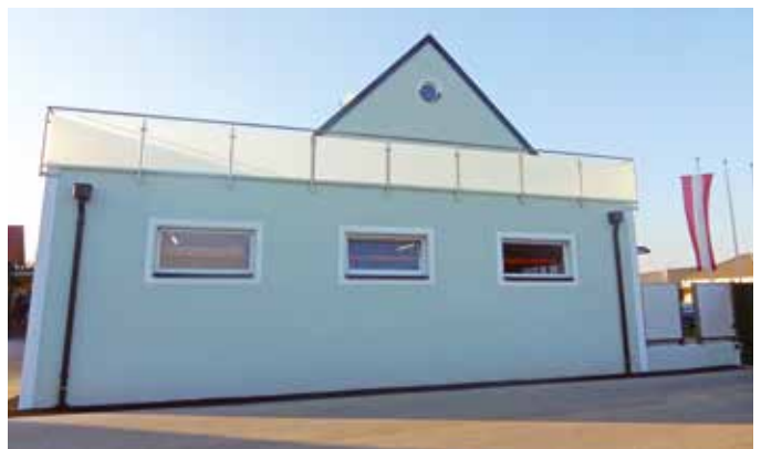
Die Feuerwehrkameraden sind stolz auf ihr neu adaptiertes Rüsthaus.