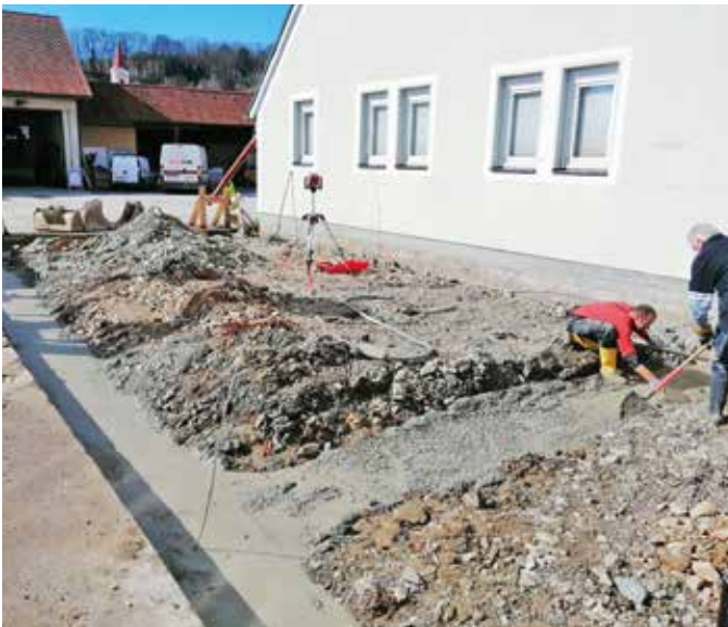
Beginn des Zubaues beim Feuerwehrhaus.

Aufgrund des akuten Platzmangels im bestehenden FW-Haus war es nötig geworden, durch einen Zubau Platz für diverse FW-Gerätschaften und Ausrüstungsgegenstände zu schaffen. Insgesamt wurden rund 1.250 Stunden von den Kameraden der FF Loipersdorf für den Zubau ehrenamtlich geleistet.