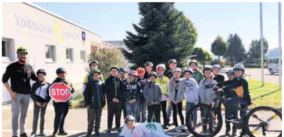
Von den Easy Drivers konnten die Kinder viel lernen.

Neben einem individuellen Rad- und Helmcheck erlernten die Kinder die Basisfertigkeiten wie stabiles Lenken, richtiges Starten, Handzeichen geben und sicheres Bremsen. Besonders Hindernisse zu überqueren, machte allen sichtlich Spaß. Am Ende des Kurses erhielten die Kinder ein Diplom über die erfolgreiche Kursteilnahme.