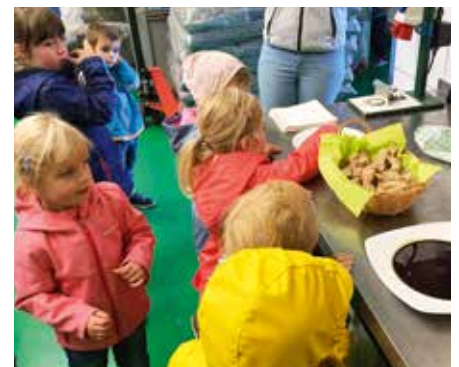
Endlichen dürfen die Kinder kosten.