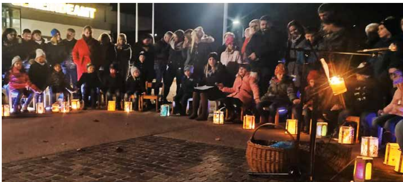
Viele Besucher beim Laternenfest

Fleißig wurden Lieder und Gedichte sowie das Theaterstück „Frederick“ geübt. Die Kinder zeigten mit großer Begeisterung ihr Können. Die Pädagoginnen und Betreuerinnen sind sehr stolz auf sie und wünschen auf diesem Wege, allen Familien eine besinnliche Winter- und Weihnachtszeit und dass jeder Einzelne auf sein Herz hören mag und die Augen auch für jene offenhält, die Hilfe brauchen, so wie es einst St. Martin tat. Frohe Weihnachten wünscht das gesamte Krippen- und Kindergartenteam.