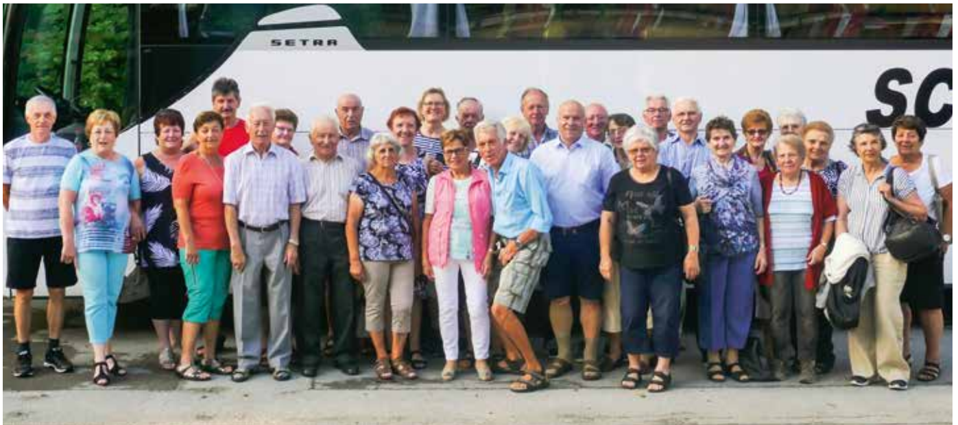
Eine große Teilnehmerschar beteiligte sich am Zweitages-Ausflug nach Slowenien.

wahr, auf dem Bledersee eine Schifffahrt zur Kirche „Maria Himmelfahrt“ zu machen, welche sich Mitten im See befindet. Wer nicht an der Schifffahrt teilnahm, konnte mit dem Touristenbus eine Rundfahrt um den See absolvieren. Das Mittagessen wurde im Gasthaus Avsenic , der Heimat der Oberkrainer, konsumiert. Mit viel neu gewonnenen Eindrücken wurde die Heimreise angetreten. Natürlich war noch ein Buschenschankbesuch eingeplant.