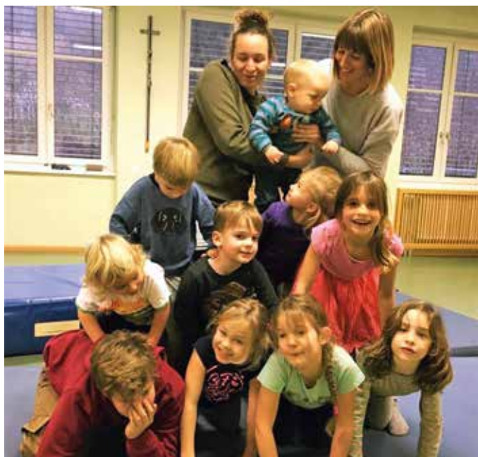
Große Begeisterung herrscht bei den Kindern beim Kinderyoga und -tanz ist Stein.