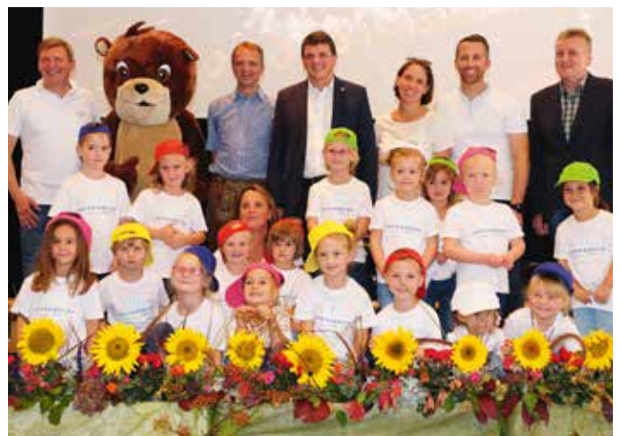
Ein großer Erfolg – das 1. Familienfest des Tourismuskindergartens Therme Loipersdorf