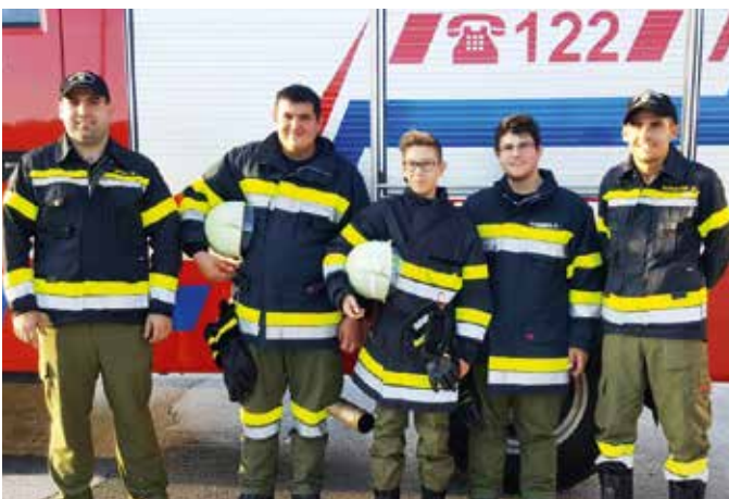
Die Teilnehmer bei der Grundausbildung 2

Am 19. Oktober 2019 wurde die Grundausbildung 2 in Ilz durchgeführt. Auf fünf Stationen wurden die Sachgebiete Strahlrohre, Leitern, Schaum, Rettungsgeräte und Entstehungsbrandbekämpfung praktisch gelehrt und beübt. Um die Fertigkeiten und Kenntnisse für den aktiven Feuerwehrdienst zu erlangen, muss sich jedes neue Feuerwehrmitglied einer umfangreichen Grundausbildung in zwei Teilen unterziehen. Von der Wehr Loipersdorf nahmen drei Kameraden an dieser Ausbildung teil, außerdem wurden zwei Ausbilder gestellt.