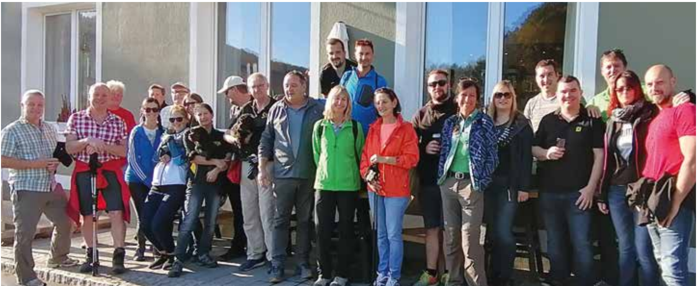
Treffpunkt für die Wanderer war beim Stangl Wirt.

Buschenschank Sorger . Nicht nur Sport stand auf dem Herbst-Programm des Vereins, sondern auch eine „Kärntner Speckverkostung“ sowie der Besuch des Stücks der Bühne Loipersdorf wurde von vielen MitgliederInnen angenommen.