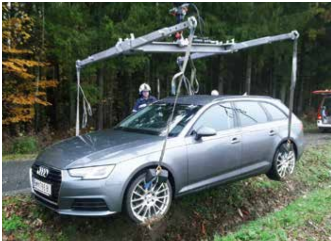
Das verunfallte Fahrzeug konnte mittels Ladekran des FF Fürstenfeld geborgen werden.

Die Feuerwehren Gillersdorf und Loipersdorf wurden am 14. November 2019 in der Früh zu einer Fahrzeugbergung alarmiert. Auf Grund des starken Nebels war ein Lenker mit seinem PKW auf der L445 Richtung Gillersdorf in den tiefen Straßengraben geraten. Da eine Bergung mittels Seilwinde der FF Loipersdorf, ohne eventuelle Schäden am Fahrzeug zu verursachen, nicht möglich war, wurde das Einsatzfahrzeug WLF der Feuerwehr Fürstenfeld nachalarmiert.