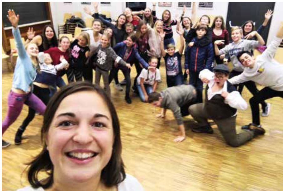
„Chorallen“ und „Voices“ hatten viel Spaß im Pfarrheim.