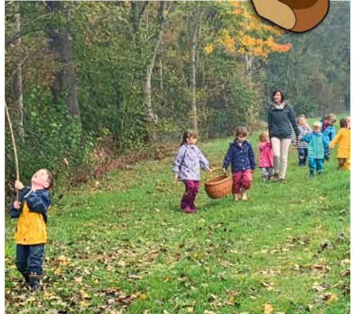
Voll Freude werden die Schätze transportiert.