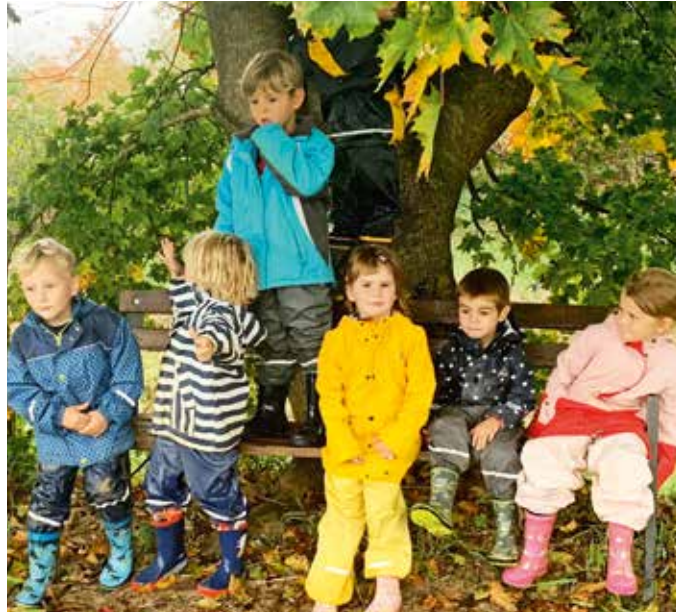
Eine kurze Pause während der interessanten Schatzsuche.

Voll Begeisterung wurde im Herbst eine Suche nach Schätzen in der Natur durchgeführt. Alles verändert sich, die Bäume verlieren ihre Blätter, Wiesen und Felder bereiten sich auf den Winter vor. Was findet man alles in der Natur? Es wird beobachtet, geschaut und erkundet... Im Kindergarten