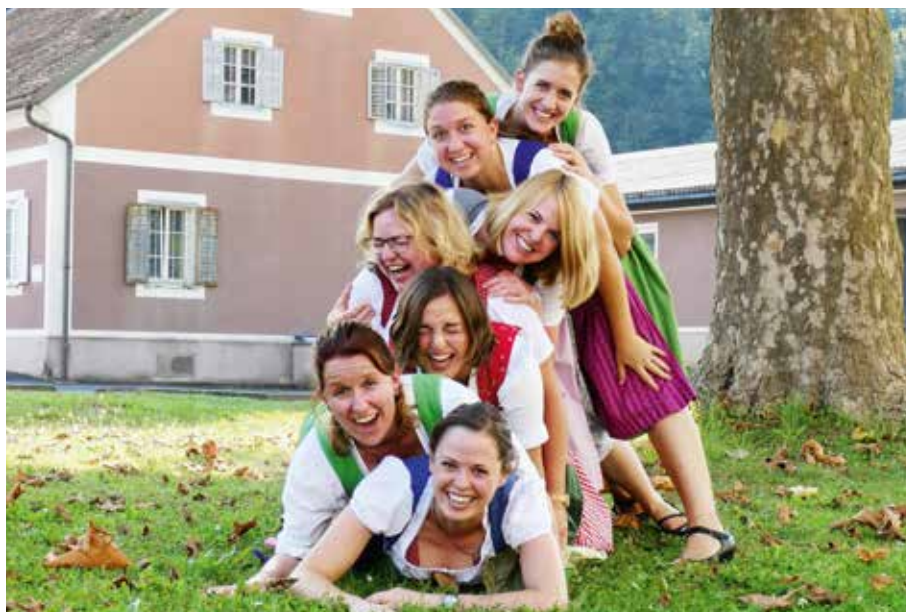
Immer viel Spaß bei den Chornissen.

In diesem Sommer wurden die Chornissen wieder von Hochzeitspaaren eingeladen, ihre Trauungszeremonien gesanglich zu gestalten. Die Sängerinnen stürzten sich eifrig in die Probenarbeit und der Chor war u. a. Gast in Breitenfeld, Fürstenfeld und St. Martin. Die Chornissen danken den Paaren für ihr Vertrauen und wünschen nochmals alles Gute für ihre gemeinsame Zukunft. Die Chornissen würden sich freuen am 24. Dezember 2019 bei der Christmette in Loipersdorf mit Beginn um 21 Uhr 30 viele bekannte Gesichter zu treffen.