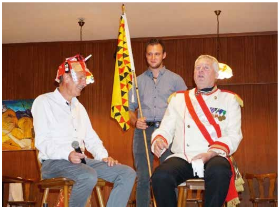
„Audienz beim Kaiser“ - sehr unterhaltsam inszeniert von der Wandergruppe Fürstenfeld.