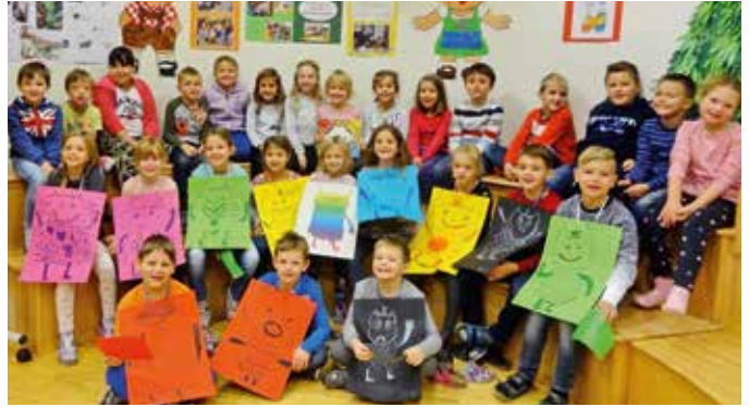
Stolz präsentieren die Kinder ihre „Gefühlsbilder“.

Mit großer Begeisterung präsentierten die Kinder der zweiten Klasse ihre Gefühlbilder und lasen entsprechende Texte aus dem Buch vor. Die Schüler und Schülerinnen der ersten Klasse bewunderten die schön gestalteten Bilder und hörten neugierig und interessiert zu; auch konnten sie selbst über ihre eigenen Gefühle sprechen.