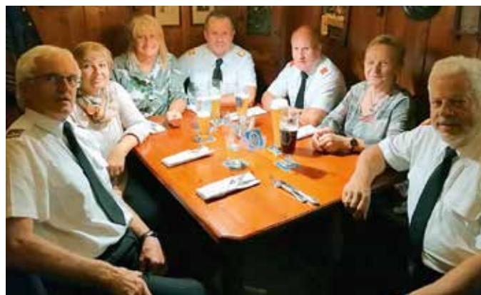
Zahlreiche Teilnehmer der FF Dietersdorf nahmen an der Feuerwehrwallfahrt teil.

Vom steirischen Landesfeuerwehrverband wurde am 28. September 2019 die vierte steirische Feuerwehrwallfahrt nach Mariazell durchgeführt. 1.500 Kameraden der steirischen Feuerwehrfamilie pilgerten nach Mariazell. Unter ihnen auch sieben Kameraden/innen der Wehr Dietersdorf.