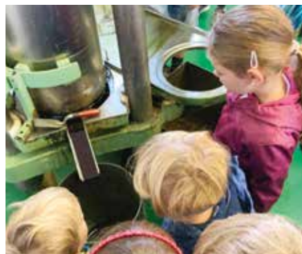
Neugierig wird auf das Fliesen des Öles gewartet.