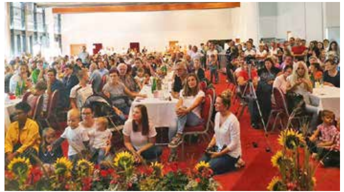
Das Kindergarten-Team hat sich über die 1.000-Euro-Spende der Therme sehr gefreut.

Zum 20-jährigen Jubiläum feierte der Kindergarten das Fest der Feste im Congress. Das Team des ersten österreichischen Tourimuskindergartens und die mitwirkenden Eltern haben sich bei der Organisation selbst übertroffen. Selten war der große Saal so voll wie am 20. Oktober 2019.