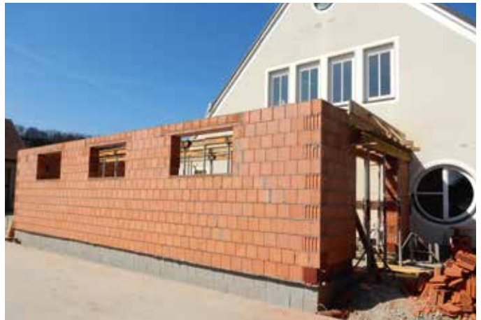
Unter tatkräftiger Mithilfe vieler Feuerwehrkameraden war der Rohbau bald fertig.