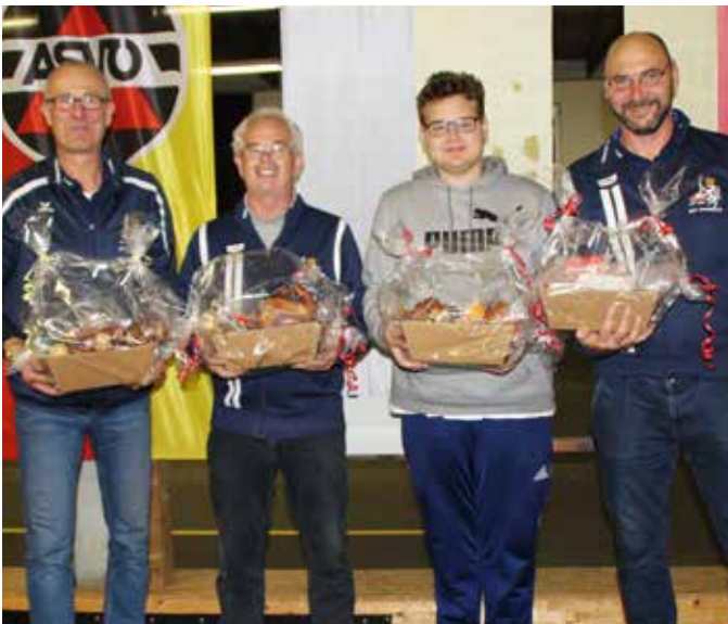
Über den Sieg am Nachmittag freute sich der ESV Kroisbach.