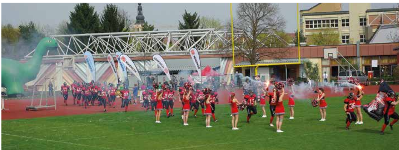
Eine große Show erwartet die Zuseher wieder am 26. April in Fürstenfeld

Infos über die Atlas Raptors Fürstenfeld gibt es auch auf www.raptors-football.at .