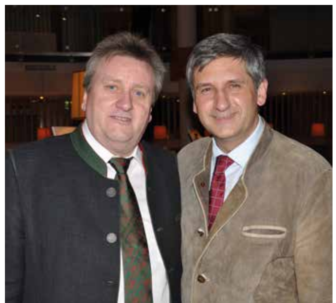
Bgm. Spirk und Bundesparteiobmann, Vizekanzler Spindelegger

die Europäische Union und die Europawahl 2014 referierte. Bei der Abschlussveranstaltung im Hotel Loipersdorf Spa & Conference signalisierten Bundesparteiobmann Spindelegger und Klubobmann Lopatka Bgm. Herbert Spirk, dass der ÖVP Parlamentsklub wieder zu einer Klausurtagung nach Loipersdorf kommen werde.