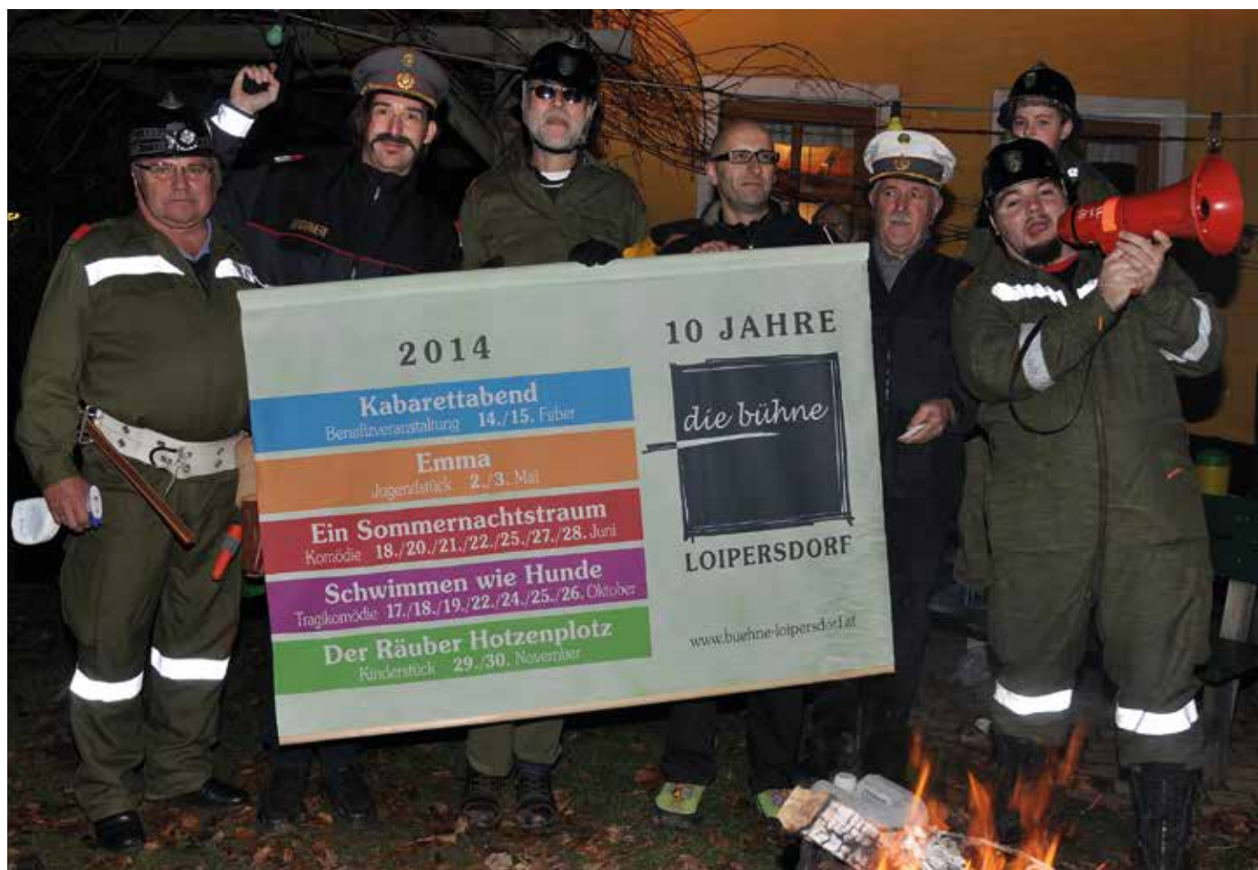
Lustige Präsentation des Programmes „10 Jahre Bühne

Ihr 10-jähriges Bestehen feiert heuer die Bühne Loipersdorf. Aus diesem Anlass haben sich die Verantwortlichen ein ambitioniertes Programm für das Jubiläumsvorjahr vorgenommen. Vorgestellt wurde es erstmals am 1. Jänner im Zuge der traditionellen Fackelwanderung um die Therme Loipersdorf – und zwar im Rahmen eines Sketches beim Thermenheiligen Wagner.