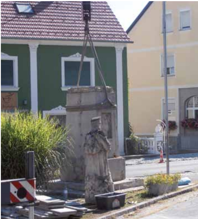
Ein „Krieger“ auf Wanderschaft: Die Heimkehrerstatue auf dem Kriegerdenkmal wurde vom Sockel gehoben, der Betonsockel mittels Autokran an seinen neuen Standort verlegt.