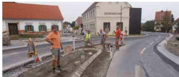
Herstellung der Verkehrsinsel im Bereich der Kurve vor dem Gasthof Jandl.

Aufbringen des Asphaltdeckbelages vor dem Gemeindeamt in der „Jandl-Kurve“. Bei der Herstellung des Asphaltdeckbelages war es erforderlich die Fahrbahn zur Gänze zu sperren. An dieser Stelle möchten wir uns besonders bei allen betroffenen Anrainern für ihr Verständnis wegen den Beeinträchtigungen durch den Baustellenbetrieb und die Verkehrsbehinderungen bedanken. Nach einer kurzen Bauzeit von etwa 5 Monaten sind nun die Arbeiten weitestgehend abgeschlossen. Im kommenden Frühjahr wird es lediglich notwendig sein, die Humusierungsarbeiten im Bereich der Grünflächen noch zu vervollständigen.