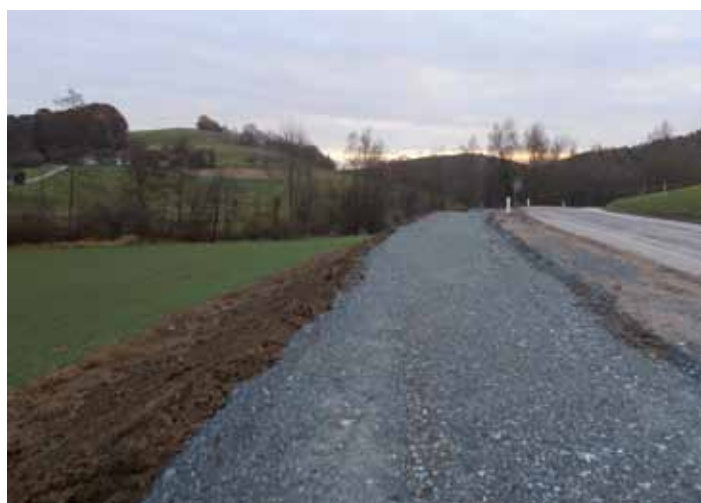
Geh- und Radweg in Richtung Stein: Der Rohkörper des Geh- und Radweges sowohl in Richtung Stein als auch in Richtung Gillersdorf ist hergestellt. Hier werden mögliche Setzungen während des Winters abgewartet und sodann im Frühjahr die Feinplanie und der Asphaltbelag hergestellt.

Im heurigen Jahr wurden an beiden Geh- und Radwegabschnitten der Unterbau und die Grobplanie sowie die Entwässerung errichtet sobald es die Witterung im Frühjahr erlaubt, erfolgt für beide Abschnitte die Aufbringung der Feinplanie und des Asphalttes sowie die Humusierung und Bepflanzung. Nach Fertigstellung und Eröffnung beider Geh- und Radwegabschnitte tragen diese zur Verkehrssicherheit einerseits der Bevölkerung und andererseits für die zahlreichen Urlaubsgäste bei.