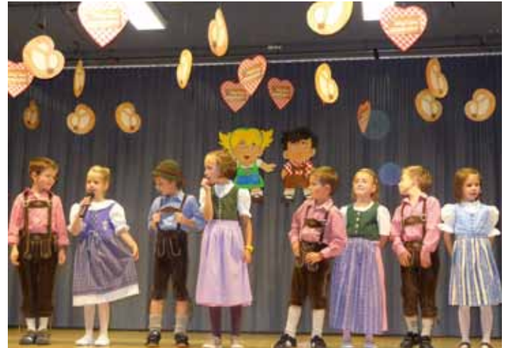
Schulkinder beim „Auf` brezelt“