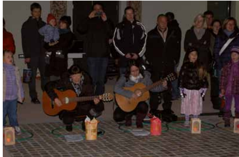
Kindergartenkinder beim Vortragen der Gedichte und Lieder

Ein herzlicher Dank für die großzügigen Spenden. Der erzielte Reinerlös kommt ausschließlich den Kindern des Kindergartens Loipersdorf zugute.