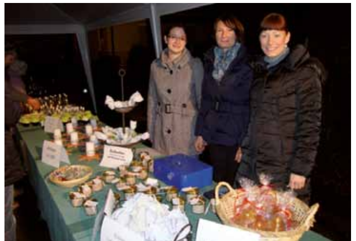
Kindergartenteam mit handgefertigten Basteleien.

Am 28.11. fand unser „Adventmarkt der Sinne“ statt. Zum Bestaunen gab es geschmackvolle, handgefertigte Besonderheiten rund um die Sinne. Tannenduft, selbstgebackenes und Punch rundeten unseren Adventmarkt ab.