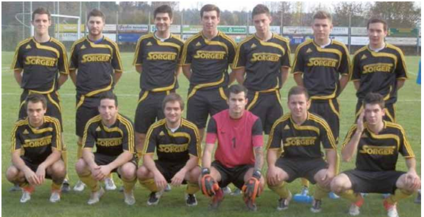
Kampfmannschaft DUSV Therme Loipersdorf

Besser als in der Meisterschaft ging es im Cupbewerb. Nach Siegen gegen Eichkögl (6:2), Auersbach (6:0), Bad Gleichenberg (5:2) Großsteinbach (2:1) kam der DUSV in die 5. Runde, wo gegen die Mannschaft aus Pöllau (5. in der Oberliga) die Partie mit 0:2 verloren wurde. Wir gratulieren der Mannschaft zu dieser tollen Leistung.