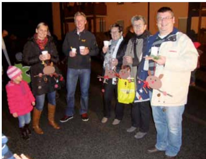
Zufriedene Besucher beim Adventmarkt