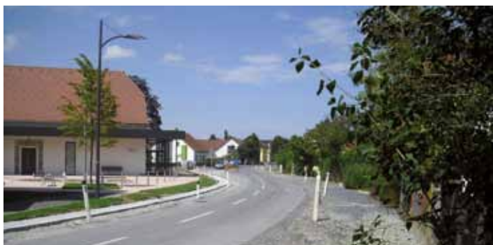
Beginn der Arbeiten im Bereich des Dorfplatzes: Die Fahrbahn wurde verbreitert, durchgehend eine neue Entwässerungsleitung verlegt.

„Gesamtlänge des Ausbauabschnittes ca. 900 m.“