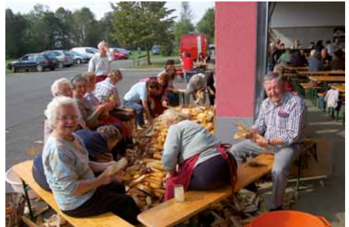
Fleißige Senioren beim Woazoheitr