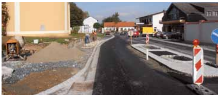
Neue Verkehrsinsel östlich der Raiba vor dem neuen Platz des Kriegerdenkmals.