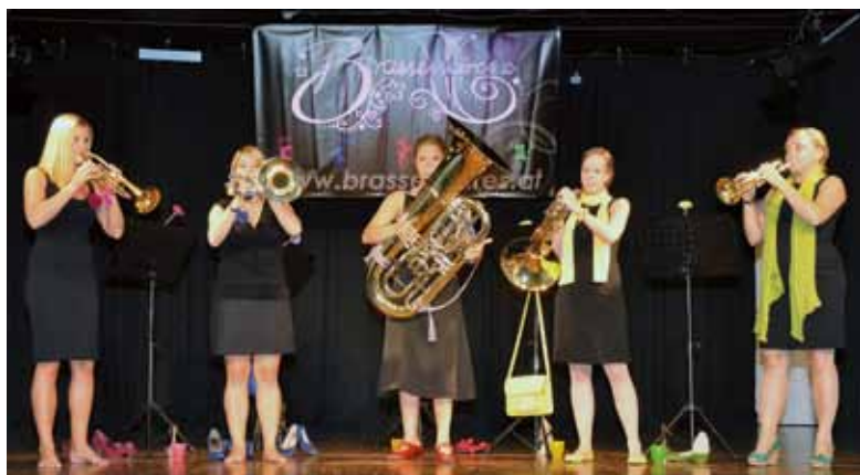
Da spielen die Frauen den Marsch!

Mit abwechslungsreichen Stücken von modern bis traditionell, mit Gesang, Show und Schmäh für Mann und Frau begeisterten sie die Besucher im Pfarrheim. Und zwar so beeindruckend, dass sogar am Sonntag am Kirchplatz noch über die Frauen „getratscht“ wurde. „Blech“ gehabt, wer das versäumt hat.