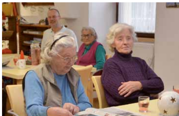
Gemütliche Stunden in der Fürstenfelder Senioren-Tagesbetreuung: Z'sam-Sitzen, über die Welt und unsereins reden.

Kostenlose Schnuppertage sind jederzeit möglich. Informationen erhält man im Gemeindeamt Loipersdorf, T.: 03382/8225, oder direkt bei der Senioren-Tagesbetreuung Fürstenfeld, Klostersgasse 6, T.: 03382/54228-29.