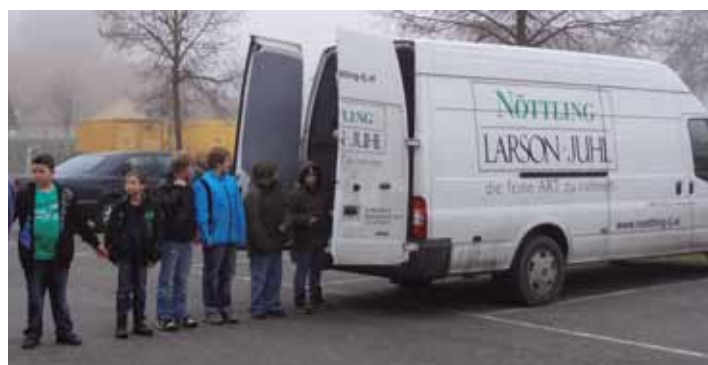
Kinder der VS Loipersdorf beim Verladen der Schuhkartons.

Die VS Loipersdorf beteiligte sich an der Aktion „Weihnachten im Schuhkarton“ , die von der Hilfsgemeinschaft „Geschenke der Hoffnung“ organisiert wird. Dabei werden Schuhkartons mit Geschenken befüllt und an notleidende Kinder in Schulen, Waisenhäusern, usw. verteilt. Heuer gehen die Pakete nach Weißrussland, wo ein Drittel der Bevölkerung unter der Armutsgrenze lebt. Mit Begeisterung brachten sowohl die SchülerInnen als auch die Kinder des Thermenkindergartens die befüllten