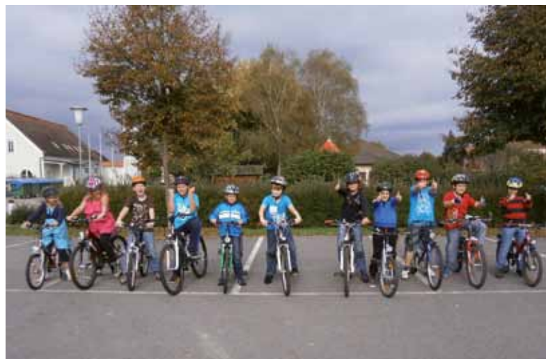
Teilnehmer der diesjährigen Radfahrprüfung