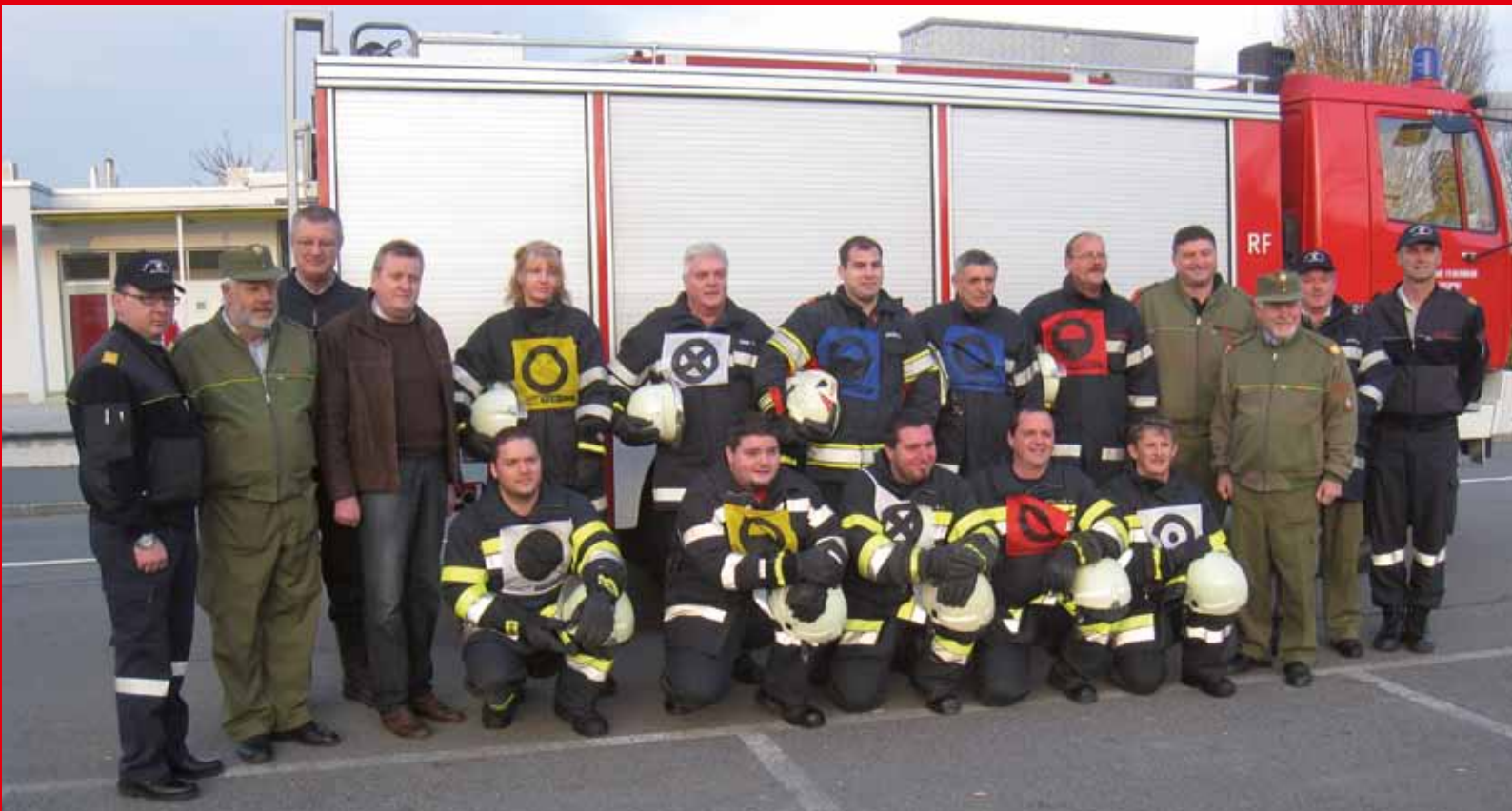
Kameraden der FF Loipersdorf mit Ehrengästen