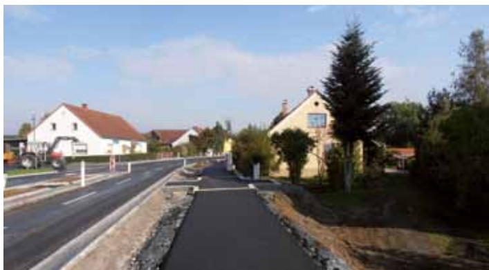
Neuer Gehweg südlich des Hauses „Trummer“.

Mitte Juni 2012 wurde nach einem mehrjährigen Planungsprozess mit dem Bau der Ortsdurchfahrt Loipersdorf begonnen. Das Bauvorhaben erstreckte sich von der Abzweigung der Schulstraße im Norden bis zum Gehöft Huber im Osten. Die Gesamtlänge des Bauvorhabens betrug ca. 900 m.