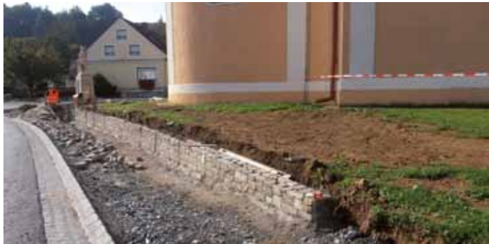
Neue Natursteinmauer als Abgrenzung zwischen der Grünfläche um die Kirche und der neuen Gehsteiganlage.

rund € 800.000,--, davon werden rund € 410.000,-- seitens des Landes Steiermark übernommen. Der Rest von ca. € 390.000,-- muss durch die Gemeinde getragen werden. Die Gemeinde muss aber auch zusätzlich für die Beleuchtung und die Bepflanzung aufkommen.