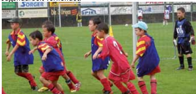
Teilnehmer des Nachwuchsturniers