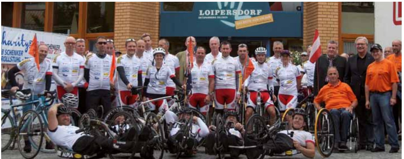
Teilnehmer der Rollstuhl-Tour und Ehrengäste vor dem Ziel bei der Therme

Am 21. August starteten fünf Handbiker des RC ENJO Vorarlberg zusammen mit Betreuern und Helfern von Altach (Vlbg) zu uns nach Loipersdorf.