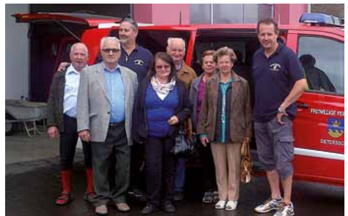
Teilnehmer des Familienradausfluges

Von den Kameraden der FF Stein wurden wir zu einer Stärkung eingeladen. Danach ging es weiter zum höchsten Punkt unseres ehemaligen Bezirkes, zum GH Gether am Kögelberg. Bei Backendl und Getränken verbrachten wir einen schönen Nachmittag mit gelebter Kameradschaft.