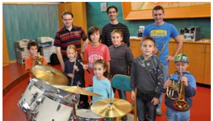
Kinder beim Schnuppern mit den Lehrern der Musikwerkstatt

Folgende Instrumente werden angeboten: Blockflöte, Querflöte, Klarinette, Saxophon, Trompete, Flügelhorn, Bariton, Euphonium, Tuba, Horn, Posaune und Schlagwerk. Es wird vom Musikverein auch ein bestimmtes Kontingent an Leihinstrumenten zur Verfügung gestellt. Anmeldungen werden jederzeit entgegengenommen!