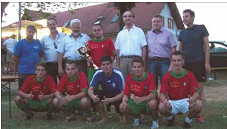
Gratulation der Siegermannschaft aus Söchau

Der Bürgermeister, die Führung der FF Gillersdorf sowie Sponsoren der Veranstaltung gratulierten der Siegermannschaft aus Söchau.