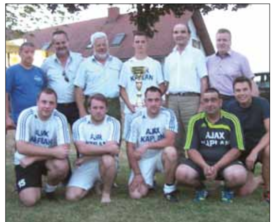
Unsere Mannschaft belegte den guten 4. Platz