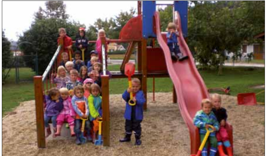
Unsere heurigen Kindergartenkinder

Wir freuen uns auf ein aufregendes, erlebnisreiches und fantasievolles Kindergartenjahr in dem wir viele Märchen hören werden, diese nachspielen, Lieder dazu singen, uns verkleiden und vieles mehr.