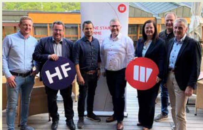
Neuwahlen beim Wirtschaftsbund in Bad Loipersdorf

Einen großartigen und sensationellen Erfolg landete