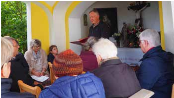
Maiandacht bei der Sammer-Kapelle in Stein