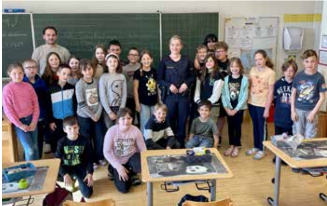
Die Kinder waren von der Polizistin begeistert.

Beim anschließenden Bummel durch Fürstenfeld fand der Ausflug einen gemütlichen Ausklang.