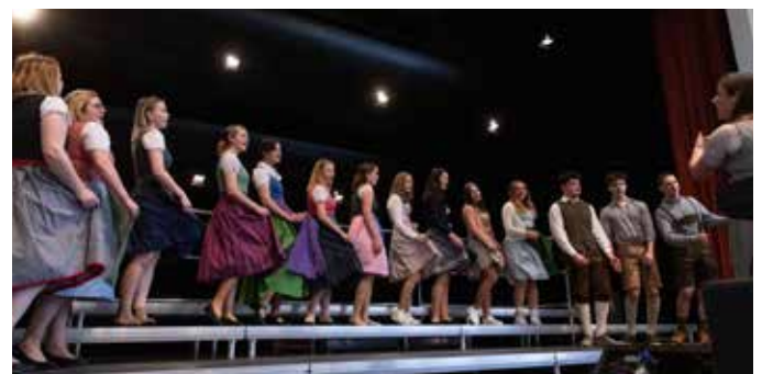
Auftritt beim Bezirks- und Landesjugendsingen