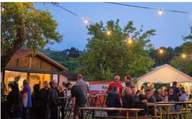
Fröhliche Stimmung beim Bergfest in Stein

Zum 59. Mal fand am 27. und 28. Mai 2023 das Bergfest der Feuerwehr Stein statt. Bei traumhaftem Wetter konnten zahlreiche Gäste begrüßt werden. Für die musikalische Unterhaltung sorgten am Samstag die „Die jungen Unterlammer“ , der Frühschoppen am Sonntag wurde vom Musikverein Unterlamm gespielt.