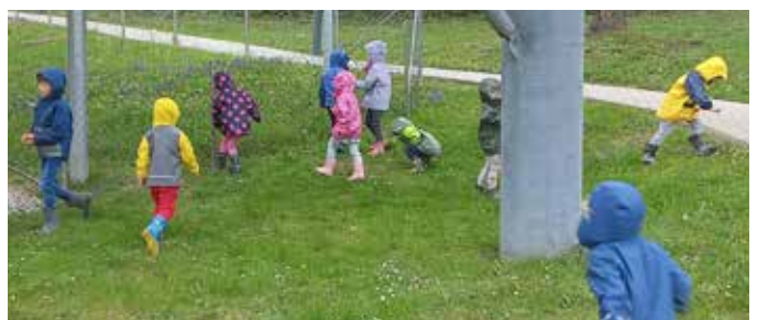
Die Kinder beim Löwenzahnblüten suchen und sammeln

Summ summ summ, die Kinder vom Tourismuskindergarten summten wie die Bienen herum und machten süßen Löwenzahnhonig. Das war ein Geschenk für Mama & Papa!