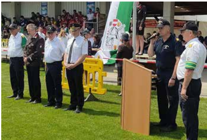
Eröffnungsfeier mit Grußworten des Kommandanten