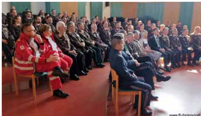
Bei der Delegiertensitzung wurden wichtige Informationen weitergegeben.

Für beste Unterhaltung bei guten Speisen und Getränken sorgte der Musikverein Thermo Loipersdorf . Ein großes Dankeschön gilt der Ortsbevölkerung für den zahlreichen Besuchern.