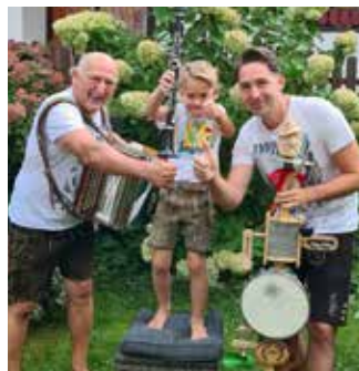
Die Huaba Buam