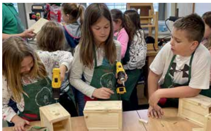
Arbeiten mit der Bohrmaschine