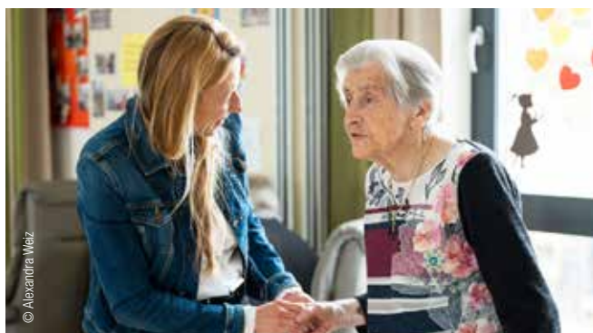
Gesundheitslandesrätin Juliane Bogner-Strauß begrüßt die neuen Maßnahmen

• Pflegende Angehörige: Der Angehörigenbonus wird erweitert. Damit erhalten 22.500 Personen zusätzlich diesen Zuschuss von 750 Euro in diesem und 1500 Euro ab dem kommen-