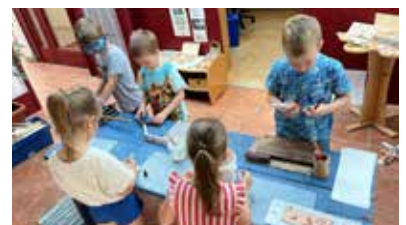
Hoch konzentriertes Arbeiten der Kinder

Es ist noch kein Meister vom Himmel gefallen. Beim Hämmern-Sägen-Leimen üben die Kinder in der Kindergarten-tischlerei „Holzwurm“ ihr Können.