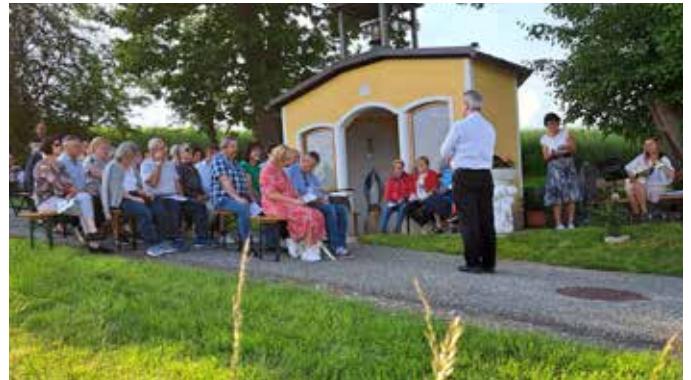
Maiandacht bei der Konrath-Kapelle in Stein