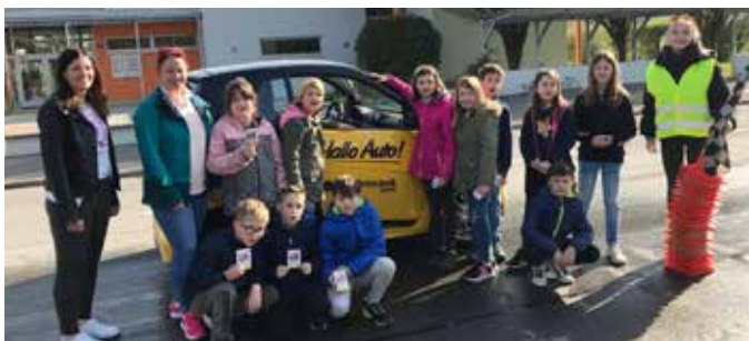
Die Kinder der dritten Schulstufe