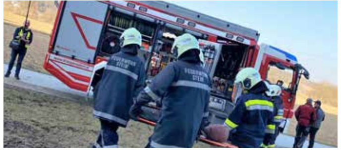
14 Kamerad:innen nahmen an der Abschnittsübung von der FF Stein teil.

Am 4. März 2023 fand eine Großübung des Abschnittes 4 statt, an der die Feuerwehr Stein mit 14 Kamerad:innen teilnahm. Zu den Übungsszenarien zählten unter anderem ein Unwetterzenario sowie ein Werkstattbrand, hier musste auch die Löschwasserversorgung über eine lange Wegstrecke sichergestellt werden.