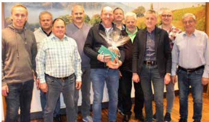
Der Jubilar im Kreise der Gemeinderäte und Fraktionsmitglieder