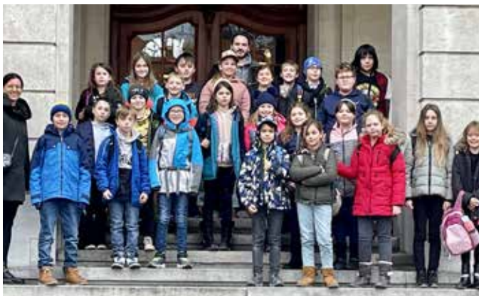
„Frau Holle“ gefiel den Kindern sehr.