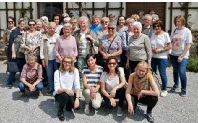
Die Teilnehmerinnen an der Fahrt ins Blaue