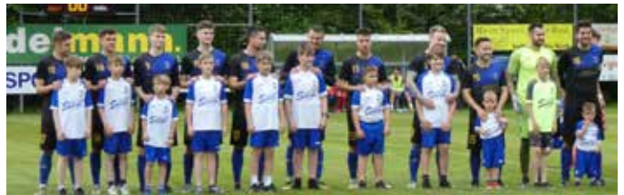
Die Kampfmannschaft mit Kindermannschaft

Als großes Highlight für die Kleinen des DUSV hat sich die Eröffnung des neuen Fußballplatzes herausgestellt, denn sie durften bei großem Beifall mit den beiden Kampfmannschaften einlaufen. Auch im Nachwuchsbereich näherte man sich der spielerischen Sommerpause. Nach längerer Pause findet heuer auch wieder ein Jugendcamp von 17. bis 19. Juli 2023 im Waldstadion statt. Die Ferienpassaktion der Gemeinde für das Fußballschnuppern ist deshalb auch von 17. bis 19. Juli 2023 möglich. Die Nachwuchstrainer und das Betreuersteam wünschen sich viele neugierige Kinder, um den Nachwuchskader des Vereines zu vergrößern.