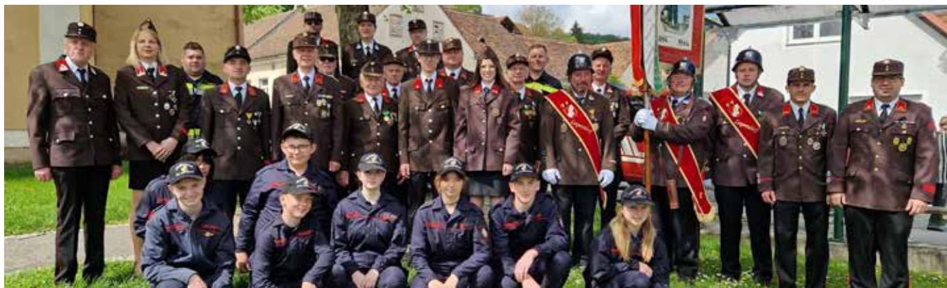
Gemeinsame Florianifeier aller Feuerwehren aus der Gemeinde Bad Loipersdorf