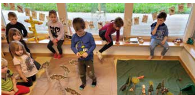
Klima, Wald und Wasser interessiert die Kinder sehr.

Spannendes rund um Klima, Wald und Wasser hieß es in intensiven drei Projekt-Wochen. Die Kinder bekamen anhand von Puppentheaterstücken, Experimenten, einem Stationenbetrieb und dem „Kliwawa-Song“ Schritt für Schritt Einblick in dieses komplexe Thema. Forscher:innen- und Informationskarten bzw. -tafeln rundeten das Angebot ab. Die Kinder tauchten zuerst mit den Puppentheaterstücken in einen Themenbereich ein. Dabei erläuterten vier Protagonist:innen Szenarien, wie sie täglich in unserem Umfeld vorkommen. Bei diesen Theaterstücken wurde auch das Sprachverständnis gefördert. Durch neue (Fach)begriffe wurde der Wortschatz erweitert, Konzentration und Merkfähigkeit trainiert. Dazu kamen kurze Wörter auf den Forscher:innen-Karten, die bei interessierten Kindern bereits die Lust auf das Lesen geweckt haben. Bei den anschließenden Stationen erlebten die Kinder die Inhalte der Theaterstücke in Form von Experimenten noch einmal. Das Ziel war es auch hier neues Wissen mit Motorik zu verknüpfen.