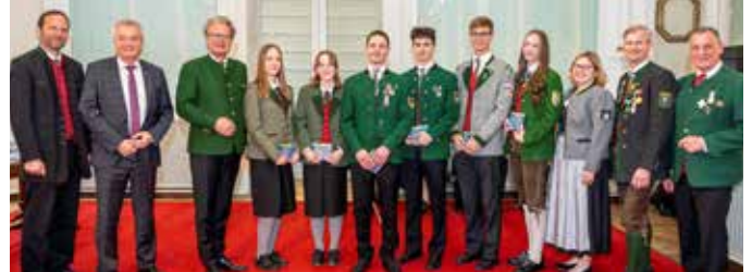
Ausgezeichnete Musiker:innen vom Musikbezirk Fürstenfeld

Weise bereichern. Wenn Musikerinnen und Musiker das Leistungsabzeichen in Gold erhalten, ist das Beweis für die hohe Qualität der steirischen Blasmusik.“