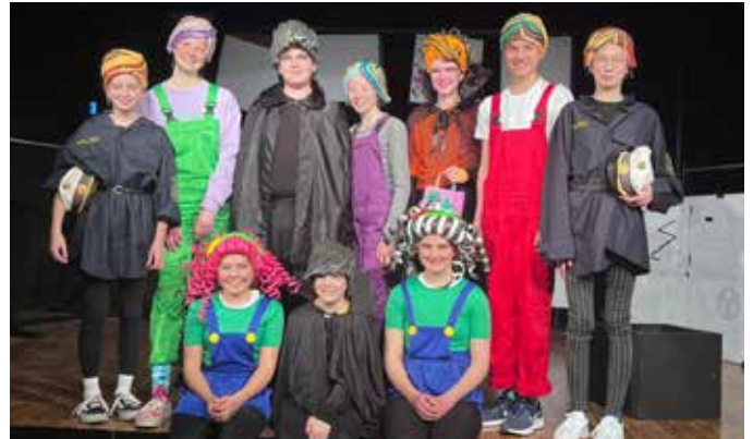
Die Jungschauspieler:innen nach dem erfolgreichen Auftritt

sich auch in den Zuschauerzahlen niederschlug und somit das Kinder- und Jugendstück 2023 zu einem sehr beachtlichen Erfolg für die „Bühne“ machte.