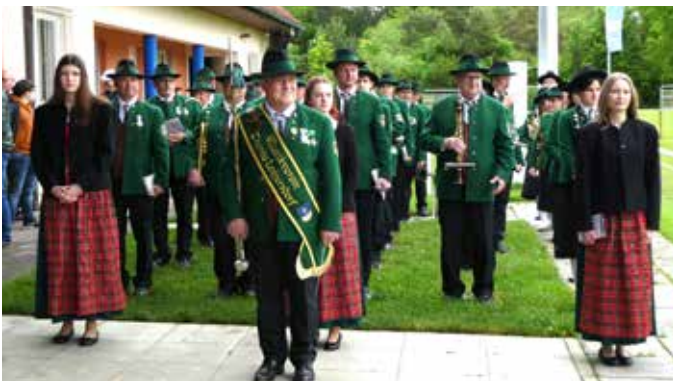
Festliche Umrahmung der Eröffnung durch den MV Therme Loipersdorf

Am Pfingstamstag gab es mit dem Bezirksleistungsbewerb der Feuerwehren bereits die erste Großveranstaltung. Am 25. Juni 2023 war mit der Bezirks-Marschmusikwertung die nächste Großveranstaltung.