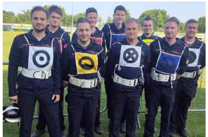
Die erfolgreiche Wettkampfgruppe der FF Dietersdorf