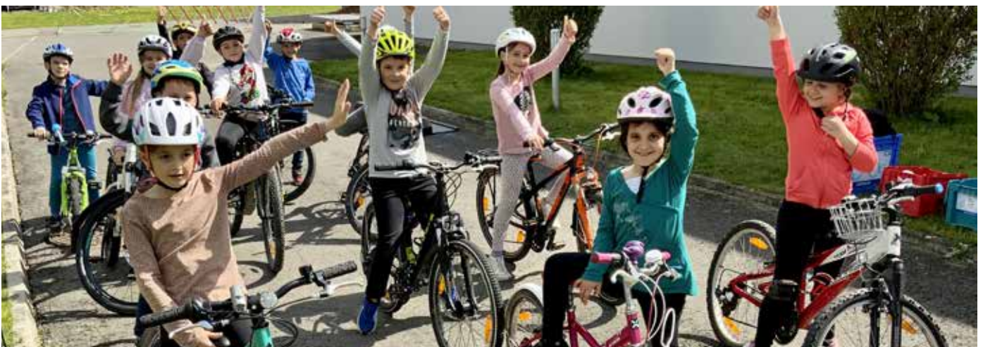
Super war der Radworkshop

„Wir bedanken uns auch noch recht herzlich bei den freiwilligen Helferinnen und Helfern für ihre Zeit und Ausdauer.“