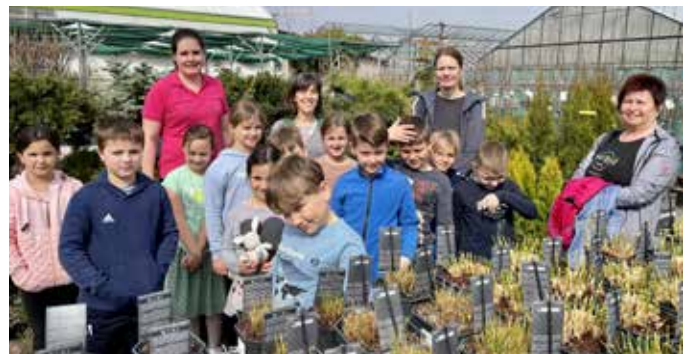
Informativer Tag in der Gärtnerei Langer

Auf der Besichtigungstour durch die Verkaufsräume konnte man viele Schnittblumen, Grünpflanzen und duftende Kräuter sehen. Begeistert waren alle auch von der automatischen Bewässerungsanlage und dem Kühlraum. Man hörte wichtige Informationen zu Schädlingen und Nützlingen im Garten. Nach einer stärkenden Jause fuhren alle wieder zurück in die Schule. Dieser Schulvormittag in der Gärtnerei war sehr interessant und informativ.