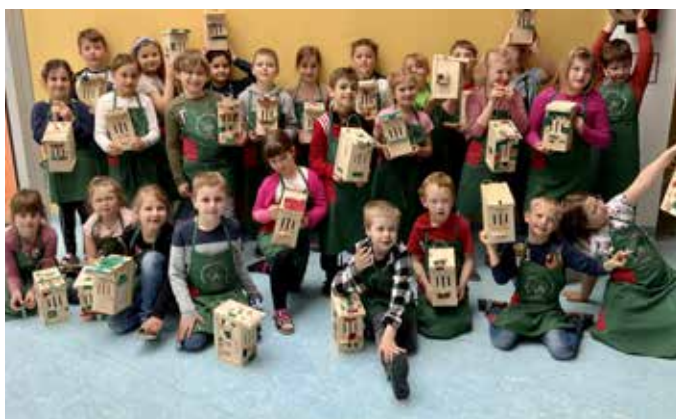
Stolz präsentierten die Kinder ihre Nistkästen.

Am Ende des Workshops waren sich alle Schüler:innen einig: „Ein Werkunterricht dieser Art kann öfter stattfinden.“