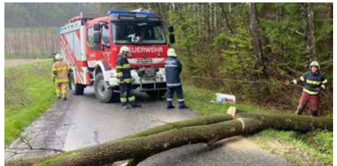
Rasch wurde der umgestürzte Baum durch die FF Stein entfernt.

Am 15. April 2023 wurde die Feuerwehr Stein gegen 8 Uhr 20 zu einem Einsatz gerufen. Ein Baum blockierte die Straße Richtung Dornegg. Die Baumteile konnten rasch entfernt und die Straße somit wieder freigegeben werden.