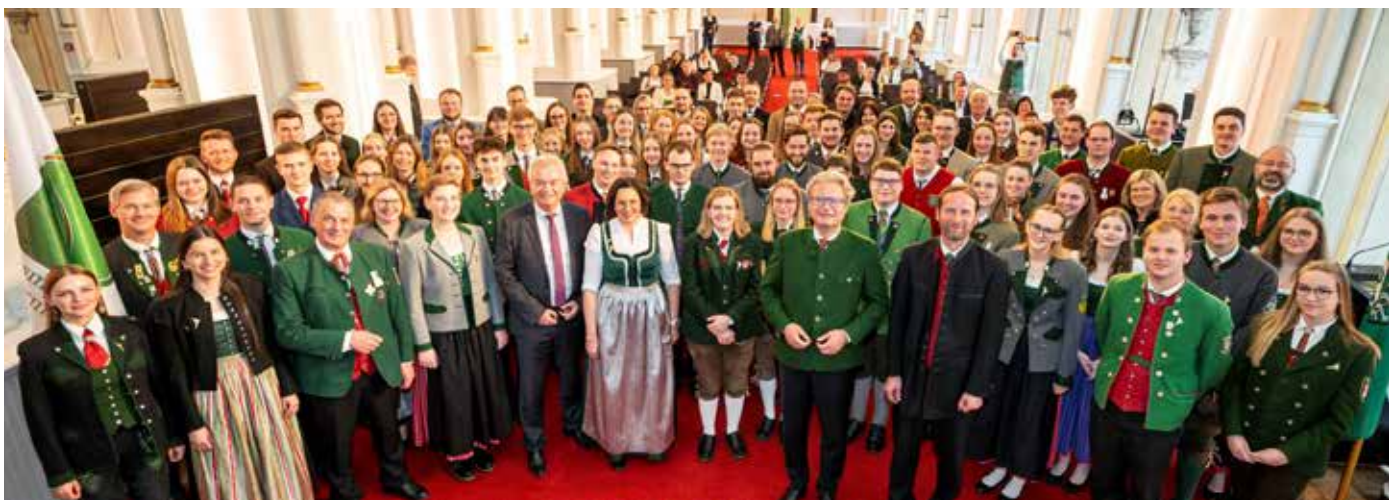
Musiker:innen vom Blasverband erhielten das Leistungsabzeichen.