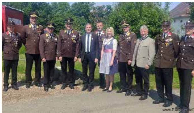
Ehrengäste mit Geehrten