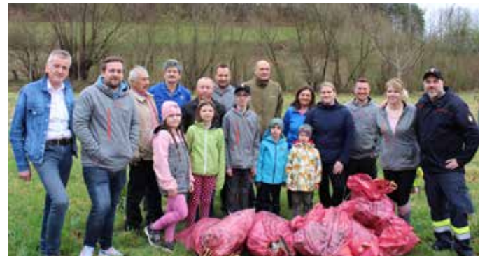
Die „Frühjahrsputzer“ in Stein