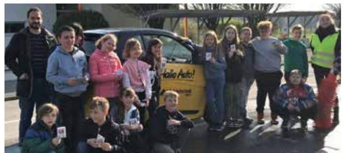
Die Kinder der vierten Schulstufe