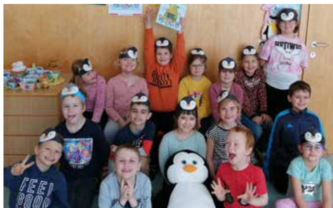
Die Kinder der ersten Klasse beim Vorlesetag.