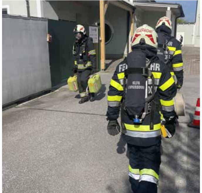
Gewissenhaft wurde von den Atemschutzträgern der ÖFAST abgelegt.

Der ÖFAST (Österreichischer Feuerwehr-Atemschutz-Leistungstest) ist eine jährliche Überprüfung der Atemschutzträger. Der als strukturierte Atemschutzübung aufgebaute Test stellt mit fünf verschiedenen Übungen die Tauglichkeit fest: Gehen mit und ohne Last, Überwinden von Hindernissen, Schlauch rollen und Stiegen steigen.