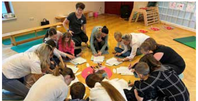
Eifrige Mamas mit ihren Schulanfänger-Kindern

„Mama schau was ich schon kann - 1 2 3 - wir fangen an!“ Bei diesen Schulstationen durften die Mamas nochmals Schulanfänger sein.