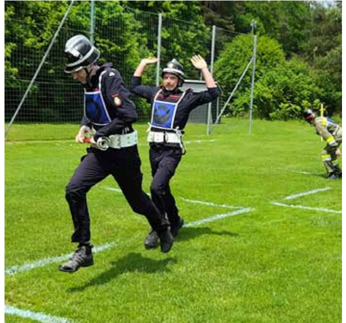
Voller Einsatz bei der Übergabe beim Staffellauf