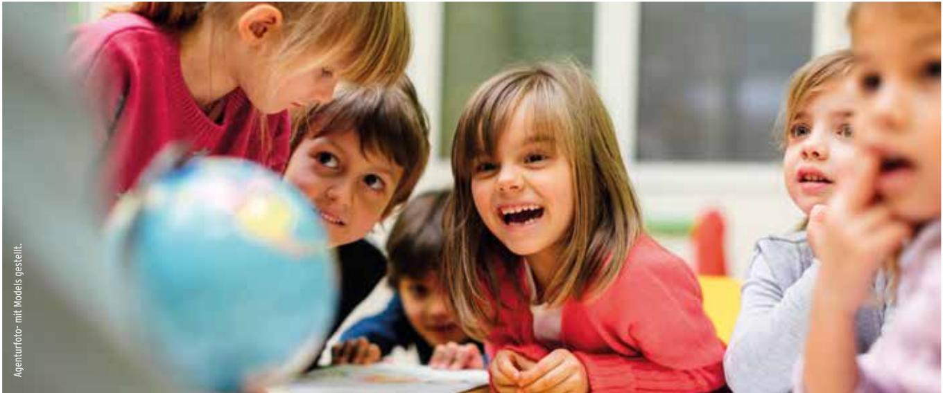
Agenturfoto - mit Models gestellt.