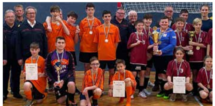
Erfolgreiche Teilnahme am Jugendfußballturnier

Die Jugendlichen der Feuerwehr Stein nahmen am 4. März 2023 am Fußballturnier der Jugendfeuerwehren des Bereichsfeuerwehrverbandes Fürstenfeld in Ilz teil. Gemeinsam mit der Jugendfeuerwehr Dietersdorf konnte der ausgezeichnete 2. Platz erreicht werden.