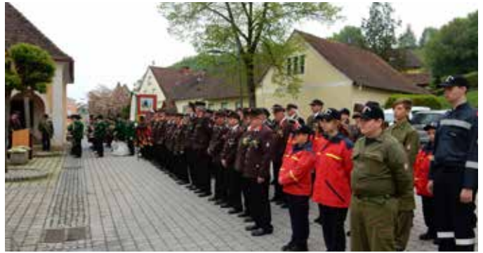
Floriani in Bad Loipersdorf