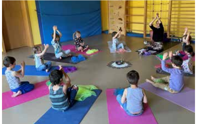
Eifrig beteiligen sich schon die Kleinsten beim Kinderyoga.

Mit einem wunderbaren ausgeglichenen Körpergefühl kamen die Kinder in den Alltag zurück. „Wir freuen uns schon jetzt aufs nächste Mal.“