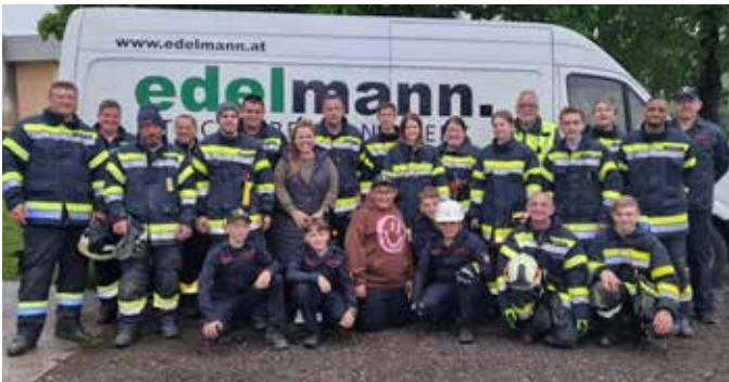
Erfolgreicher Übungseinsatz bei der Tischlerei Edelmann

Rauchentwicklung mit fünf vermissten Personen in der Tischlerei Edelmann , so lautete der Übungsbefehl für die erste Frühjahrsübung am Freitag, dem 12. Mai 2023. Beim Eintreffen wurden die zwei Atemschutztrupps für die Menschenrettung mit der Wärmebildkamera beauftragt und zwei C-Leitungen für die Brandbekämpfung vorgerichtet. Währenddessen wurde die Wasserversorgung mit der Tragkraftspritze hergestellt und die Übungsstelle abgesichert. Nachdem die fünf vermissten Personen gefunden waren, konnte die Übung erfolgreich beendet werden. Die FF Bad Loipersdorf bedankt sich recht herzlich bei der Firma Edelmann für die zur Verfügungstellung der Tischlerei sowie die anschließende Verpflegung.