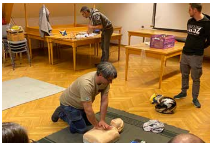
Erster-Hilfe-Kurs im Rüsthaus der FF Bad Loipersdorf

Am 27. und 28. März 2023 fand der Erste-Hilfe-Kurs im Rüsthaus statt. Um für den Einsatzfall, aber auch im privaten Bereich für den Ernstfall gewappnet zu sein, wurde der 16-stündige Grundkurs an zwei Tagen absolviert. Gelehrt wurden dabei die Theorie bei verschiedensten Verletzungen sowie Praxisbeispiele, wie die stabile Seitenlage, die Reanimation usw. Abgeschlossen wurde der Kurs mit einem kurzen schriftlichen Test.