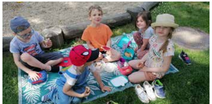
Die Kinder genießen die Gartenzeit in vollen Zügen.

Die warmen Temperaturen werden nun wieder genutzt, um sich draußen ordentlich zu bewegen und die Sonne zu genießen. Der große Garten im Kindergarten lädt zu vielfältigen Spielideen ein. Besonders gerne wird mit Wasser und Sand gespielt, um ausgiebig zu matschen und zu gatschen, sowie auch das Fahren mit den Fahrzeugen. Jedes Kind findet dabei etwas zu spielen und alle haben Spaß und Freude!