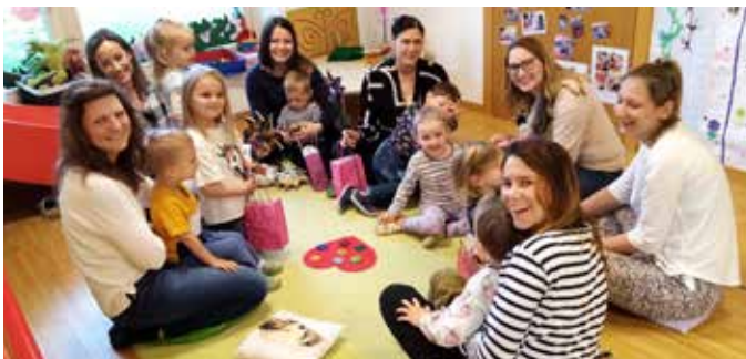
Stolz überreichten die Kinder der Kinderkrippe ihre Geschenke zum Muttertag an ihre Mamas.

Die Mamas der Kinderkrippe wurden anlässlich des Muttertages zu einem Verwöhn-Nachmittag in den Kindergarten eingeladen. Als Überraschung wurde ein Lied vorgesungen, ein selbstgemachter Rosensirup serviert, ein Billet und eine gebastelte Blume überreicht. Die Mamas wurden auch mit einer Kribbel-Krabbel-Massage verwöhnt. Zum Schluss gab es noch Waffeln mit Vanilleeis und einen leckeren Kuchen. Die Mamas konnten sich wieder mal ausgiebig miteinander unterhalten und austauschen. Es war ein gelungener und schöner Nachmittag.