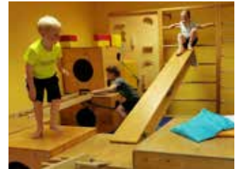
Viel Spaß haben die Kinder mit der Bewegungsbaustelle.