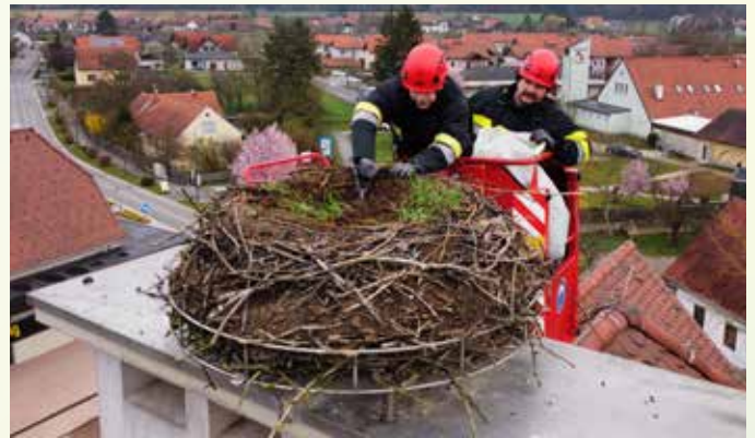
Storchennestreinigung durch die Stadtfeuerwehr Fürstenfeld

Nachdem sich alljährlich die Störche im Storchennest auf dem Dach des Gemeindeamtes aufhalten und einnisten, war es notwendig das Storchennest zu reinigen. Die Arbeiten wurden erfolgreich von den Feuerwehrkameraden der Freiwilligen Feuerwehr Fürstenfeld mit Hilfe ihrer Drehleiter durchgeführt. Ein herzliches Danke dafür!