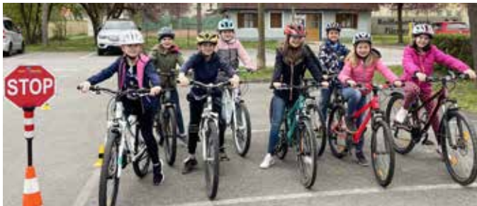
Mit großer Begeisterung waren die Kinder der dritten und vierten Schulstufe beim Radfahrkurs dabei.

Mobilitätsform wahrzunehmen und ihre Fahrpraxis im geschützten Bereich zu trainieren. Der Radfahrkurs wird durch das Bundesministerium für Klimaschutz, Umwelt, Energie, Mobilität, Innovation und Technologie unterstützt und ist für Volksschulen kostenfrei. Den Kindern hat die Trainingseinheit sichtlich großen Spaß gemacht.