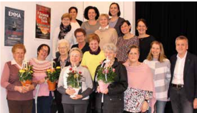
Fröhliches Beisammensein der Geburtstagskinder im Pfarrheim Bad Loipersdorf