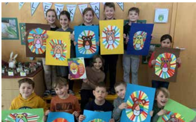
Die Kinder der zweiten Klasse beim Vorlesetag.