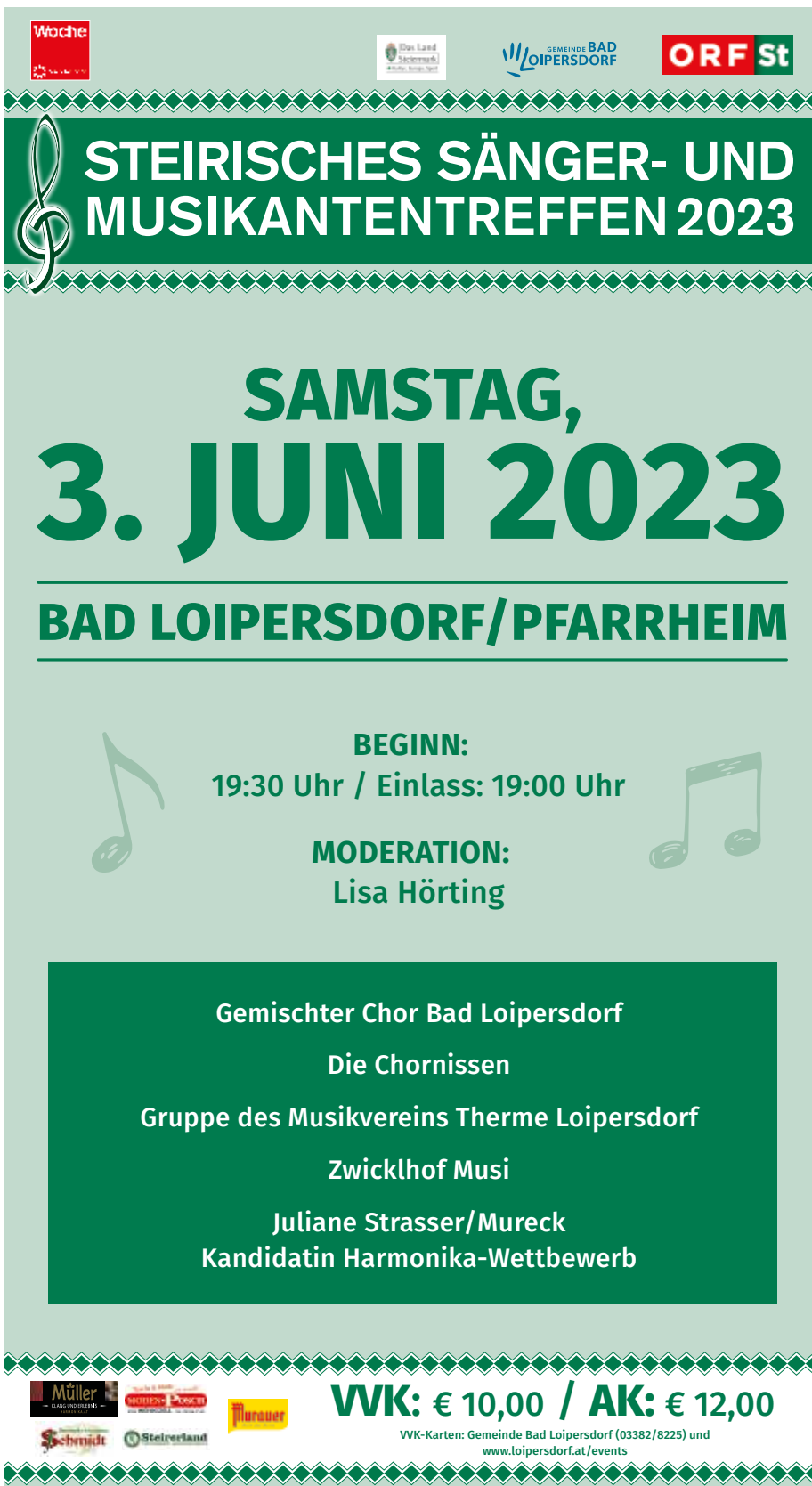
Ihr Bürgermeister Herbert Spirk