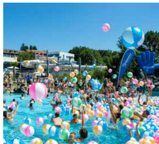
#wearewater-Fest im Thermenresort Loipersdorf