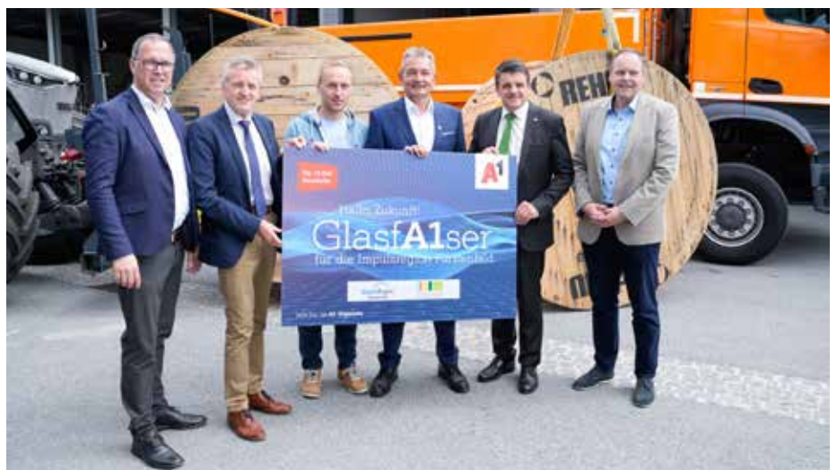
Der Gemeindevorstand mit Vertretern von A1 und der Impulsregion.

Für weitere Details zum Glasfaserausbau und die genauen Anschlussmöglichkeiten wird es eine eigene Informationsveranstaltungen geben.