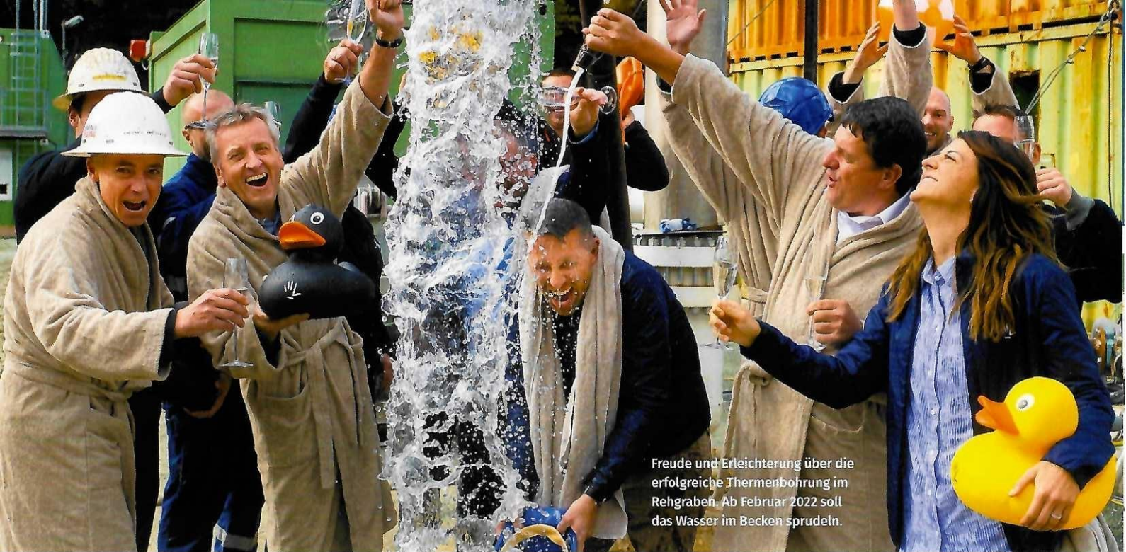
Freude und Erleichterung über die erfolgreiche Thermalwasserbohrung im Rehgraben. Ab Februar 2022 soll das Wasser im Becken sprudeln.